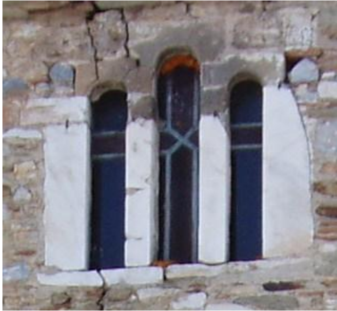
Λεπτομέρειες παραθύρου πρόσοψης