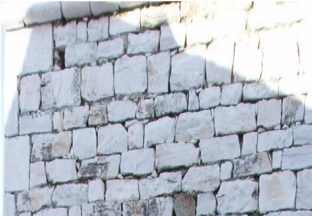
Λιθοδομή του καμπαναριού