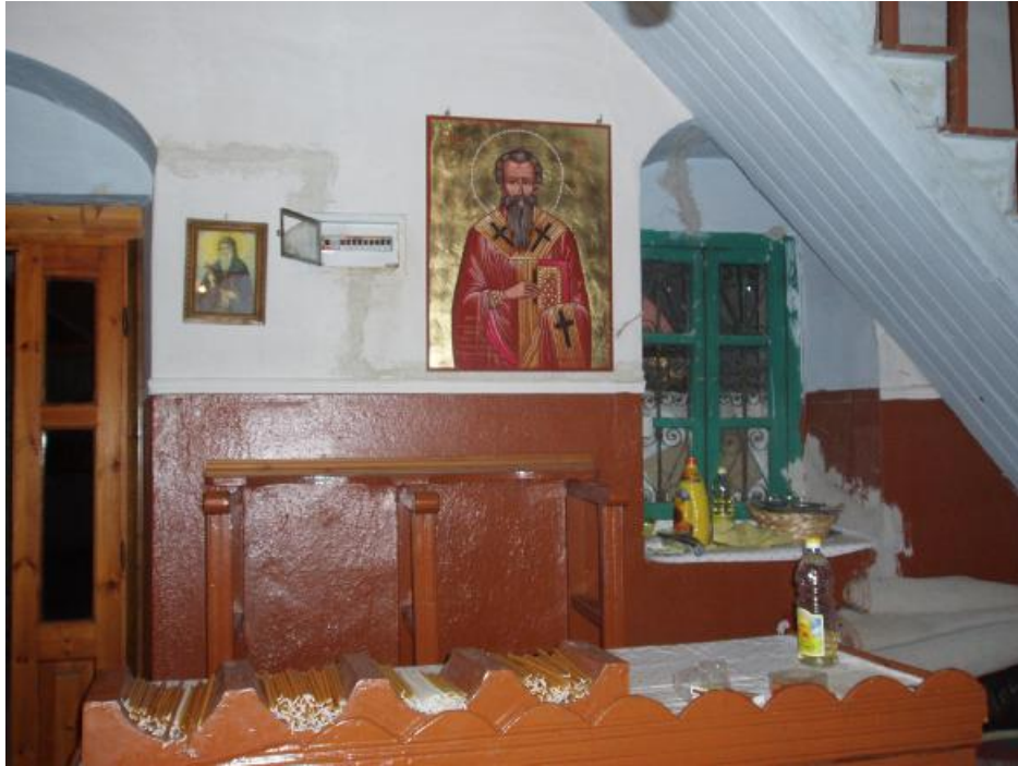
Το παγκάρι με τα κεριά στο αριστερό μέρος της εισόδου και κάτω από τη σκάλα του γυναικωνίτη