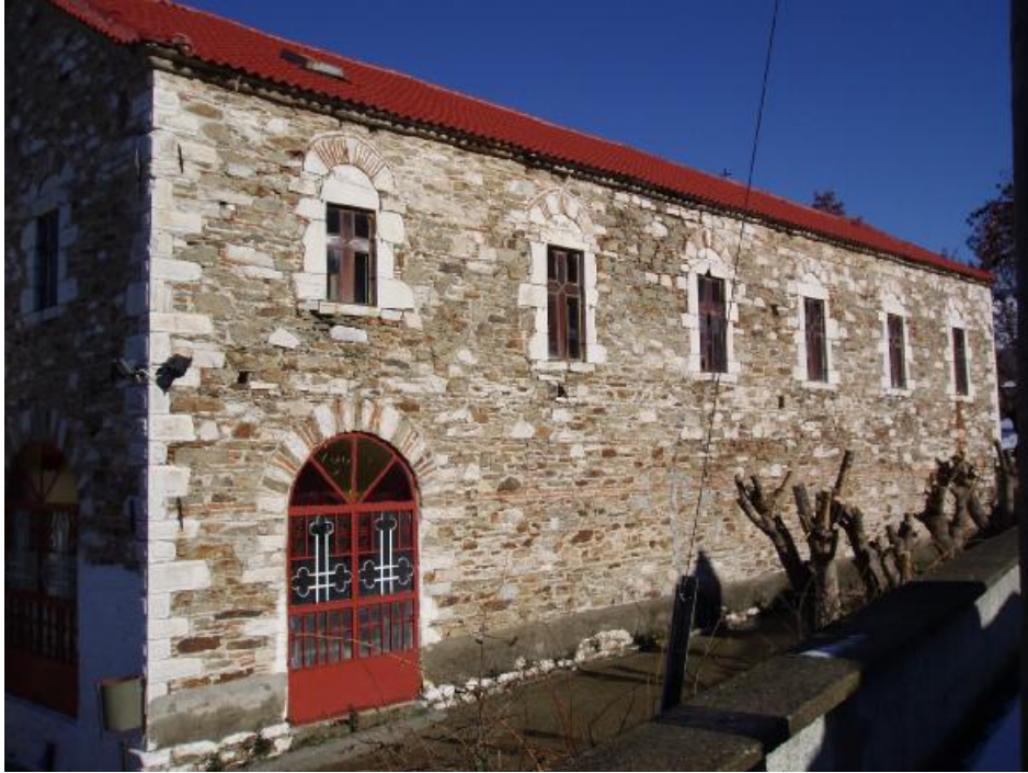
Πλάγια όψη του ναού