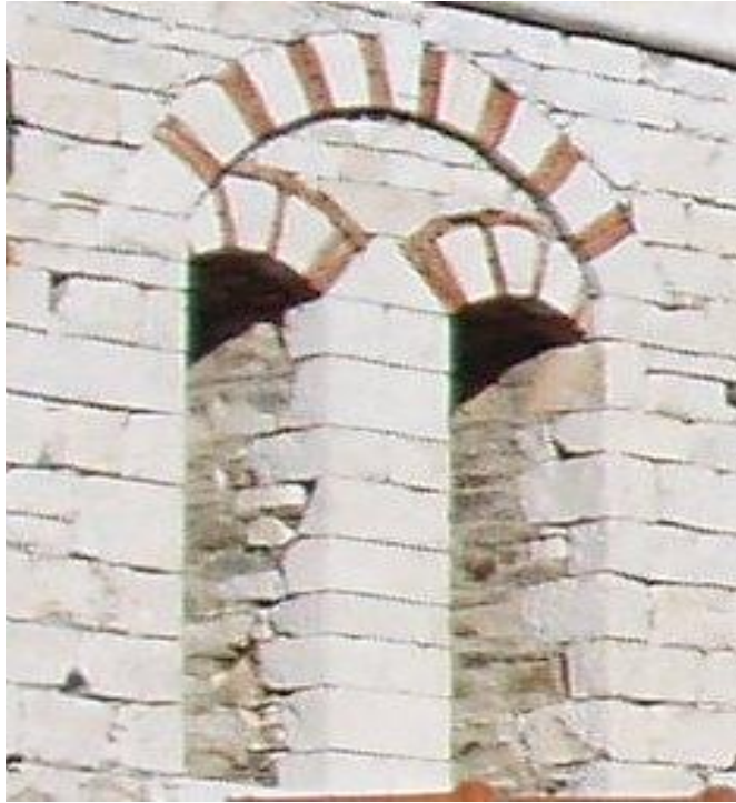
Λεπτομέρειες παραθύρου του καμπαναριού