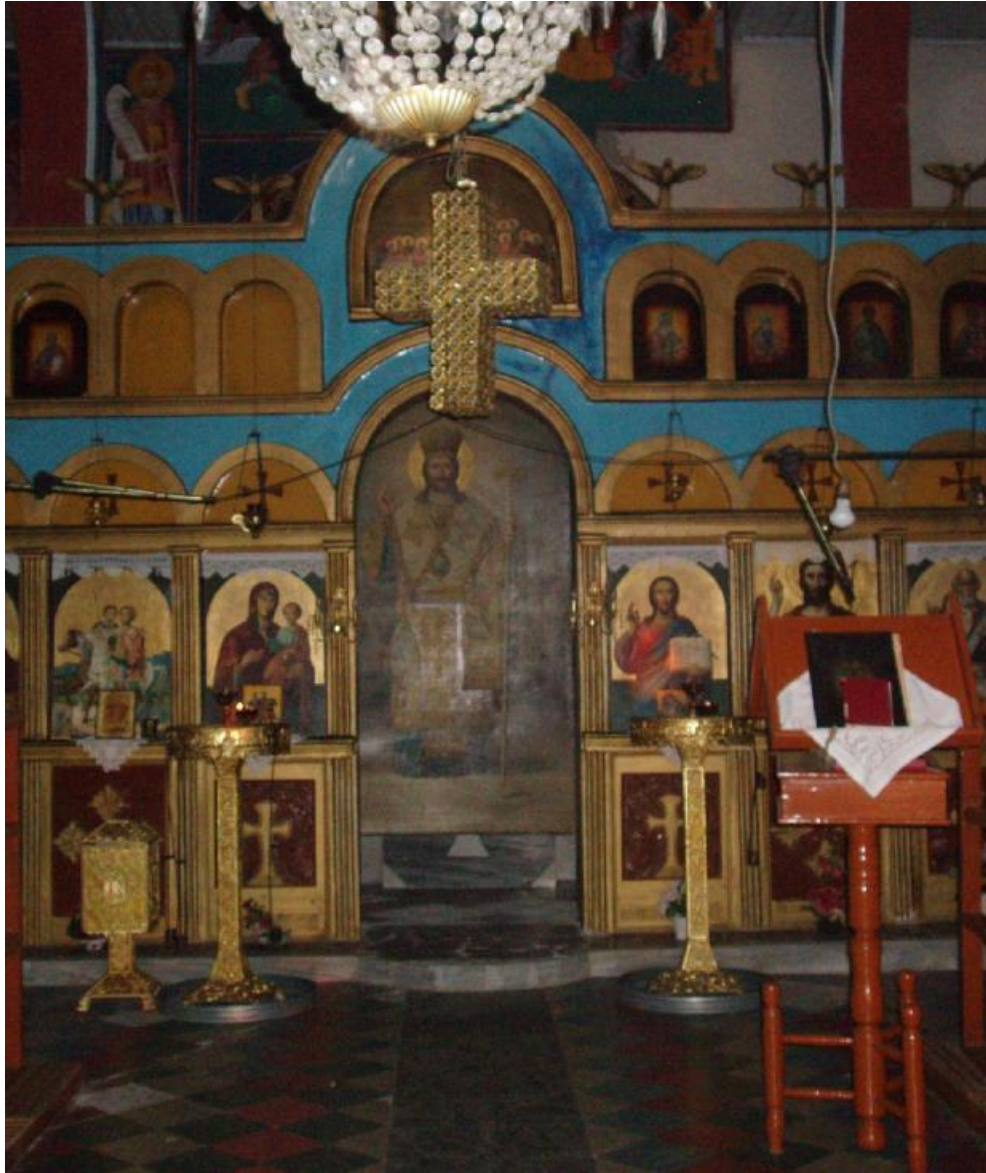
Εσωτερικός χώρος του ναού