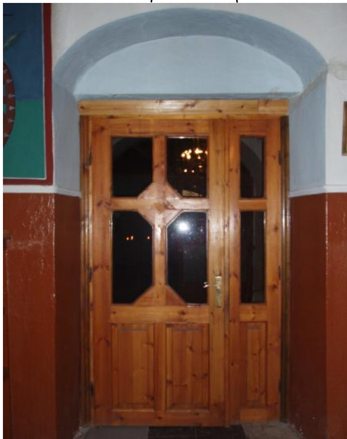
Η κύρια είσοδος του ναού