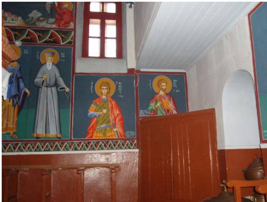
Αγιογραφίες στο εσωτερικό του ναού