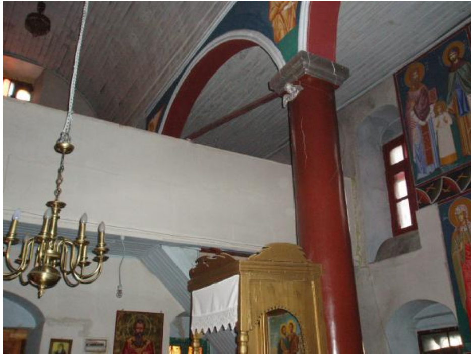
Οι καμάρες στο εσωτερικό του ναού