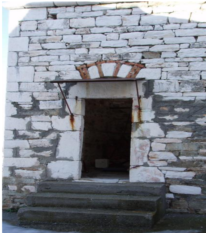
Η είσοδος του καμπαναριού