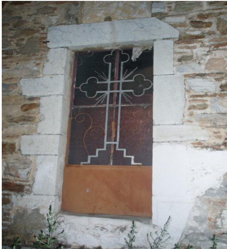
Η είσοδος για τον γυναικωνίτη