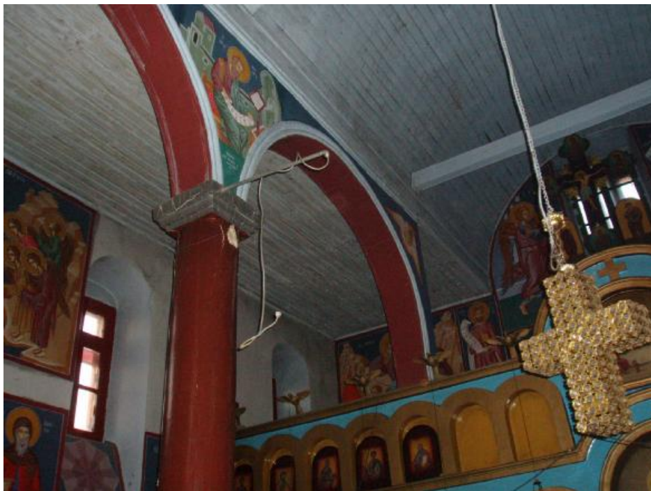
Οι καμάρες και η ξύλινη οροφή