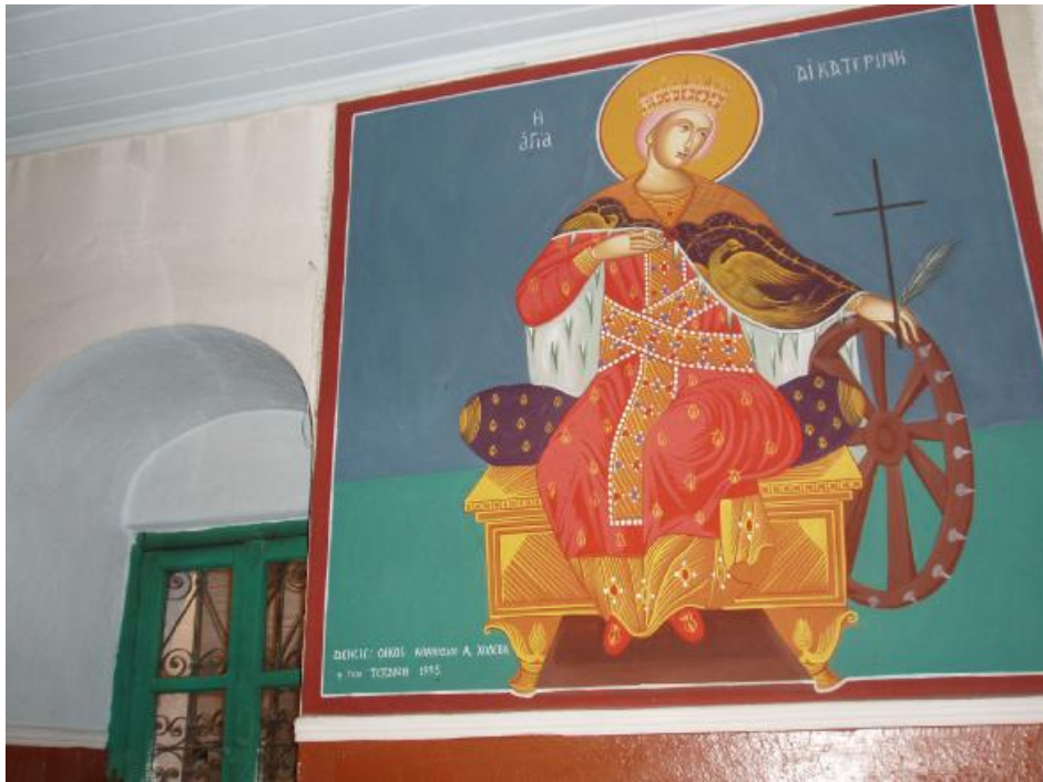
Αγιογραφία της Αγίας Αικατερίνης στο εσωτερικό του ναού