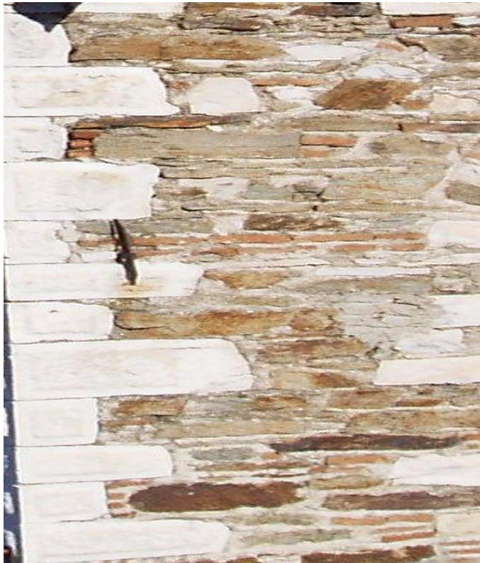
Λεπτομέρειες λιθοδομής στις γωνίες του ναού