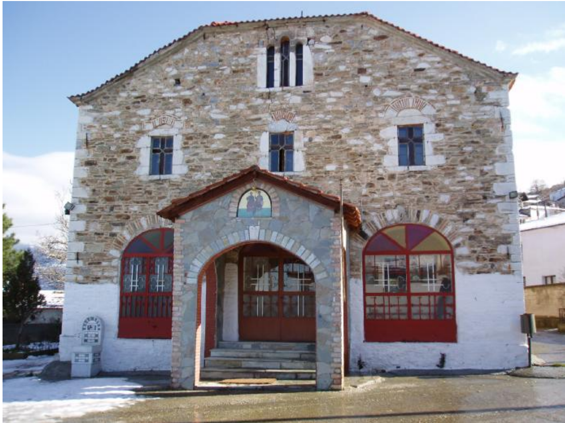
Πρόσοψη του ναού των Αγίων Θεοδώρων