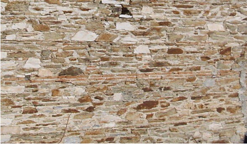
Λιθοδομή του ναού