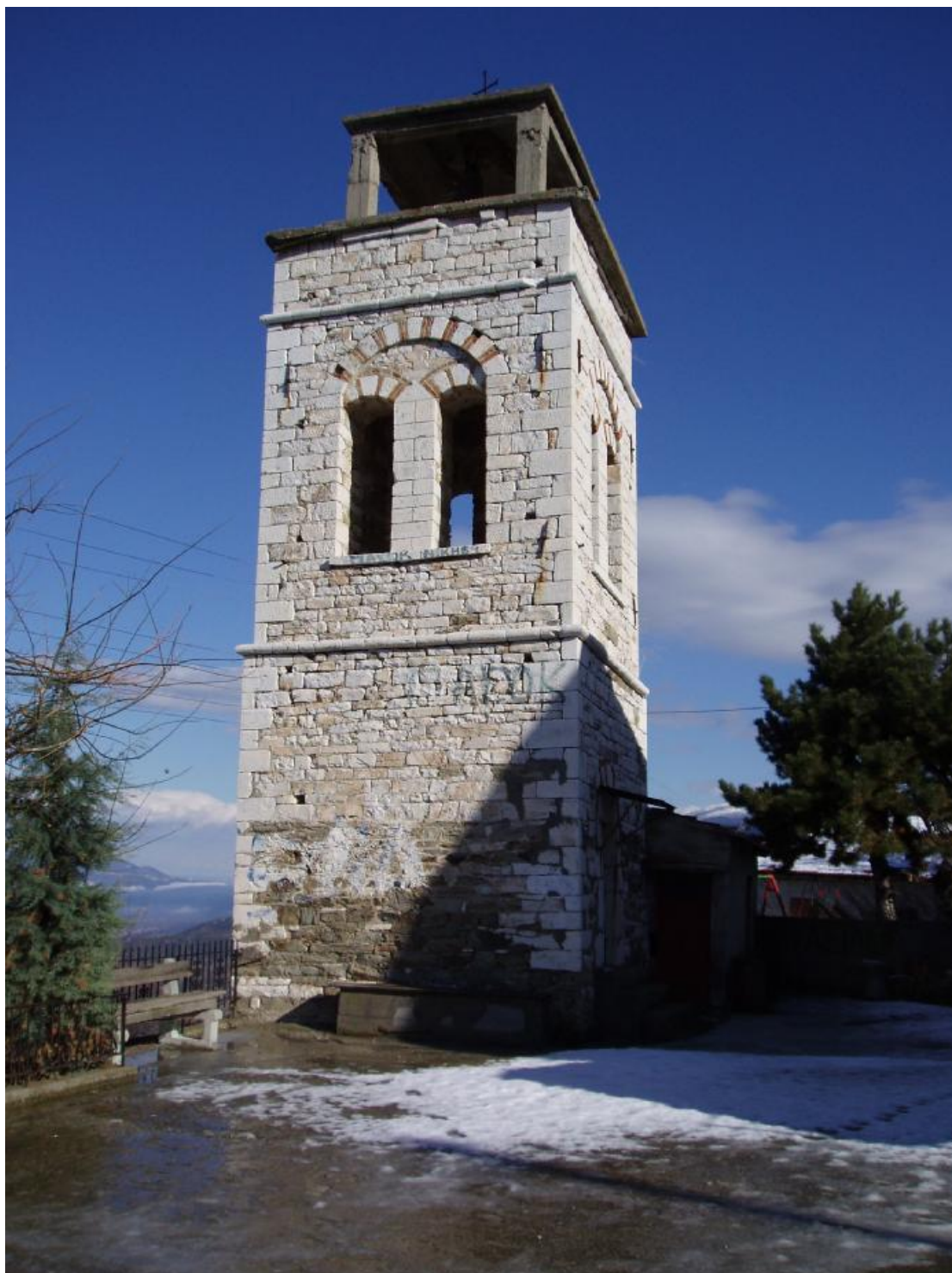
Το καμπαναριό στη σημερινή του μορφή