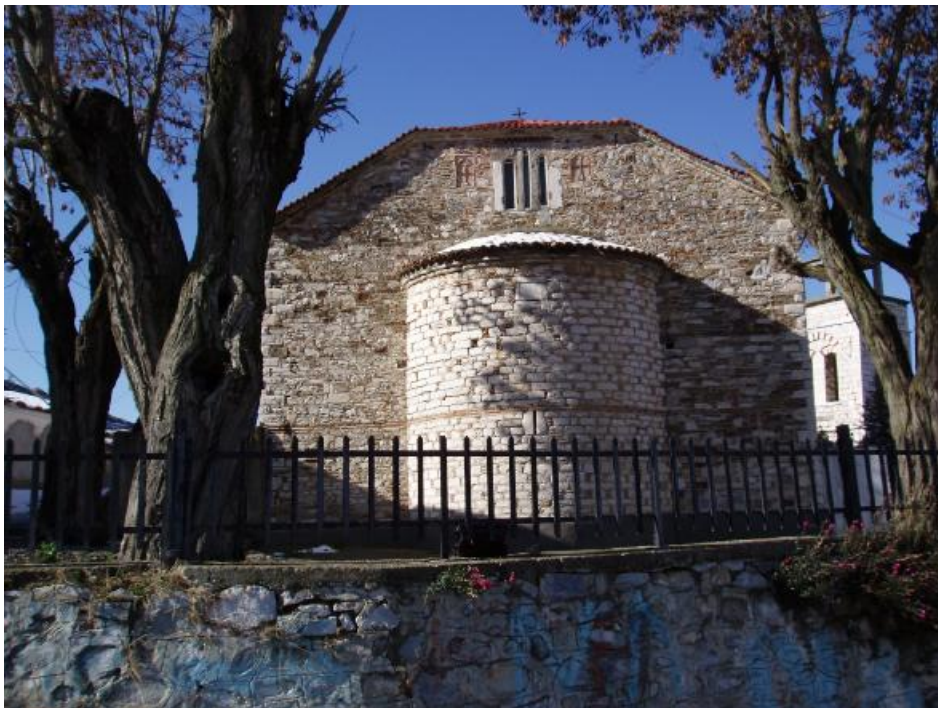
Το πίσω μέρος του ναού