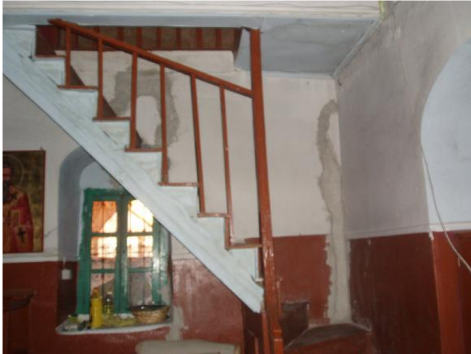
Η ξύλινη σκάλα που οδηγεί στον γυναικωνίτη