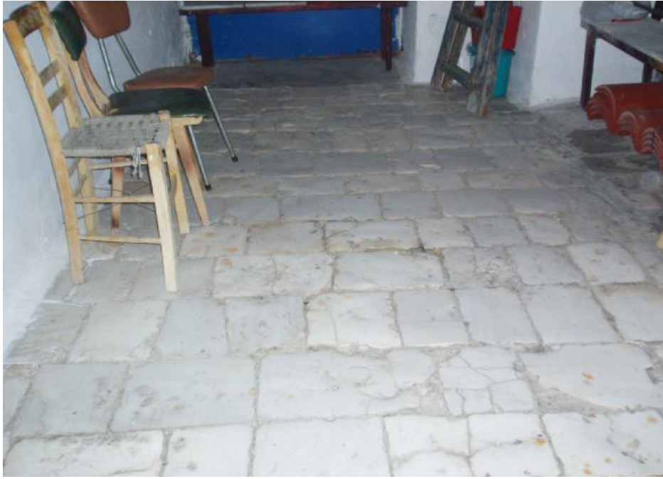
Το μαρμάρινο δάπεδο στον προθάλαμο της εκκλησίας