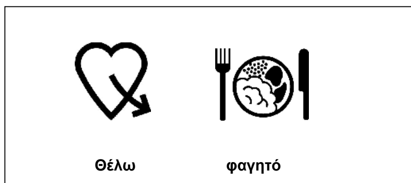
Εικόνα 1: Παράδειγμα εικόνων ΜΑΚΑΤΟΝ

Το σύστημα ΜΑΚΑΤΟΝ χρησιμοποιείται με επιτυχία σε άτομα με βαριές, σοβαρές, μέτριες ή ελαφριές μαθησιακές δυσκολίες (νοητική υστέρηση), σε άτομα με αυτισμό, σε άτομα με σωματικές αναπηρίες και σε άτομα με αισθητηριακές ή πολυαισθητηριακές αναπηρίες. Επίσης, σημαντική βοήθεια παρέχει, σε παιδιά με Ειδική Γλωσσική Διαταραχή ή/και με άλλες αναπτυξιακές γλωσσικές διαταραχές και σε άτομα με επίκτητες γλωσσικές διαταραχές (αφασίες, δυσαρθρίες, διαταραχές της φωνής κ.α) (Walker 1980).