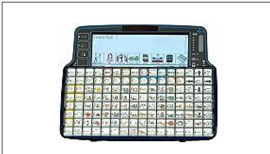
Εικόνα 5: Παράδειγμα μέσων επικοινωνίας με φωνή με σύμβολα/ εικόνες/ λέξεις.

Ο λογοθεραπευτής πρέπει να γνωρίσει το εκπαιδευτικό πρόγραμμα και να προγραμματίσει το σχετικό λεξιλόγιο, ανάλογα με τα θέματα. Θα ήταν χρήσιμο να εκπαιδευτεί ο δάσκαλος για τον προγραμματισμό καινούργιων λέξεων στο Μέσο Επικοινωνίας με Φωνή.