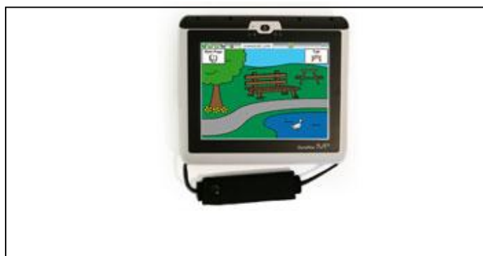
Εικόνα 3: Παράδειγμα συσκευής υψηλής τεχνολογίας