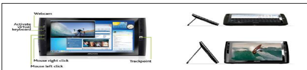
Εικόνα 6: Εικόνες από τη συσκευή ARCHOS 9 PC Table

Η παραπάνω συσκευή θεωρήθηκε ως η καταλληλότερη για το άτομο, διότι το βάρος και το μέγεθός της, την καθιστούν ικανή στην προσαρμογή στο αμαξίδιο του ατόμου. Επιπλέον, είναι φορητή και έτσι το άτομο μπορεί να την έχει πάντοτε μαζί του. Το λειτουργικό της σύστημα, καθώς και η μνήμη της υποστηρίζουν το λογισμικό που δημιουργήθηκε και τέλος, το κόστος της δεν ήταν μεγάλο και η οικογένεια μπορούσε να πραγματοποιήσει την αγορά.