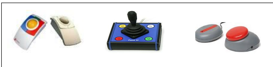
Εικόνα 4: Παράδειγμα ειδικών συσκευών υποστηρικτικής τεχνολογίας

Η σημαντικότερη προϋπόθεση για τη χρήση του ηλεκτρονικού υπολογιστή είναι οι γνωστικές ικανότητες του παιδιού και το επίπεδο κατανόησής του. Το παιδί πρέπει να είναι σε θέση να κατανοήσει πως λειτουργεί ο υπολογιστής και να τον χρησιμοποιήσει, ώστε να φέρει εις πέρας το πρόγραμμα. Υπάρχουν παιδιά που είναι σε θέση να χειριστούν αποτελεσματικά τα πλήκτρα του υπολογιστή και άλλα όχι, είτε από επίπεδο κατανόησης, είτε από επίπεδο κινητικών δυσκολιών. Τα τελευταία μπορεί να είναι παιδιά με Γλωσσική Καθυστέρηση, Νοητική Υστέρηση, Απραξία, Εγκεφαλική Πάρεση, Σύνδρομο Down, κ.α. Σε αυτά τα παιδιά μπορούν να συστηθούν ειδικές συσκευές υποστηρικτικής τεχνολογίας με διακόπτες και σχετικά εξαρτήματα.