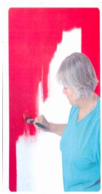
Πίνακας 24: Εκφορές του ρήματος βάφω (βάζω χρώμα)