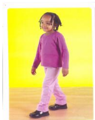
Πίνακας 48:Εκφορές του ρήματος περπατάω (πάω με τα πόδια)