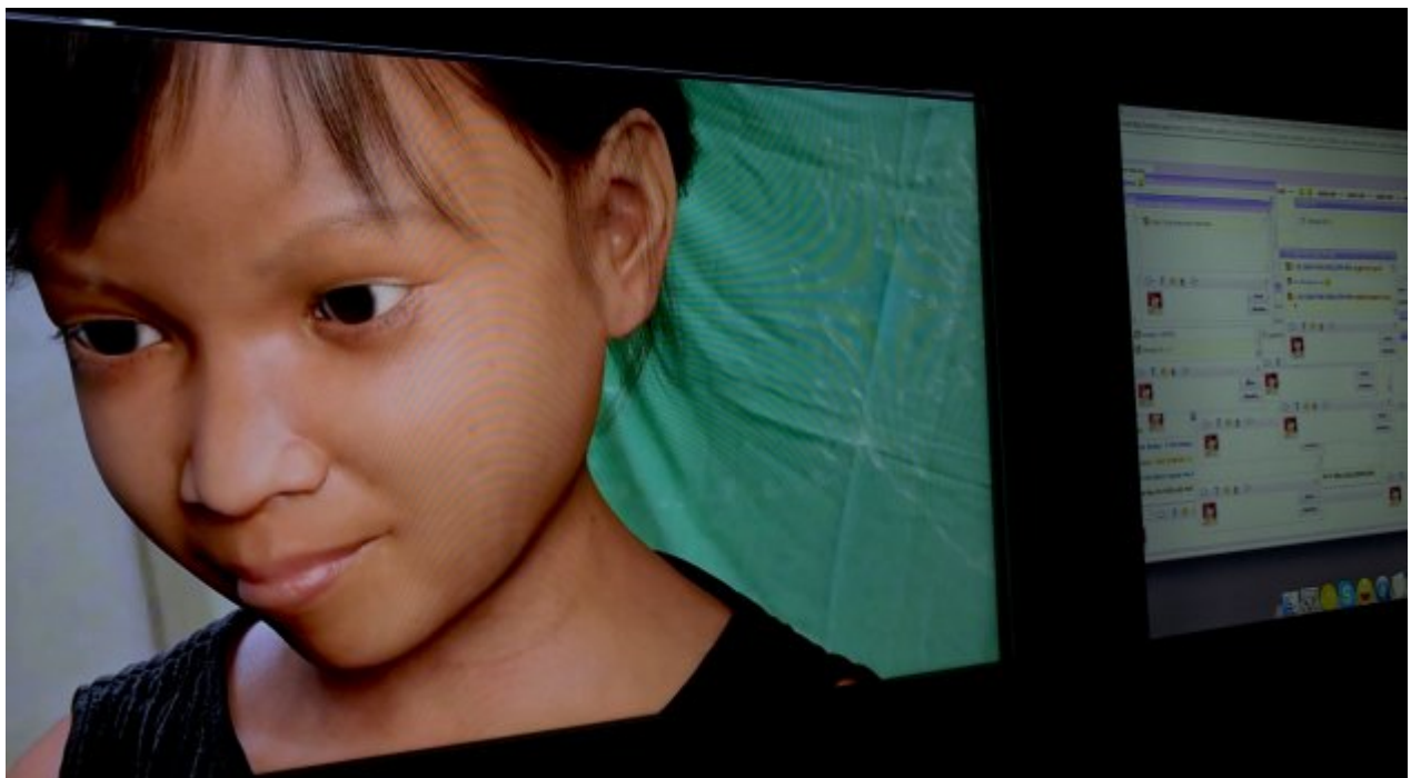
Εικόνα 2: Η «Sweetie»

Το «τσίμπημα» έχει επιστήσει πολλή δημοσιότητα γύρω από το θέμα, συμπεριλαμβανομένων και ορισμένων επικρίσεων της Terre des Hommes για την προσπάθειά της να πάρει το νόμο στα χέρια της, ή για να βασιστούν τα ευρήματά τους σε ένα μοντέλο υπολογιστή. Αντίθετα, τα μέλη της Terre des Hommes έχουν καταφέρει να παράγουν ένα εργαλείο για τις υπηρεσίες επιβολής του νόμου, το οποίο μπορεί να χρησιμοποιηθεί για να αποτρέψει την εκθετική αύξηση της πρακτικής αυτής.