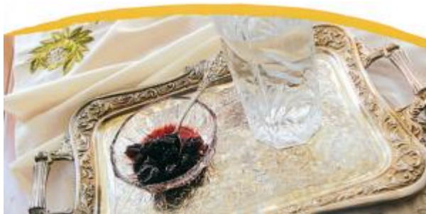
Αγροτουριστικός Συνεταιρισμός Γυναικών Τριγώνου Έβρου «ΓΑΙΑ»