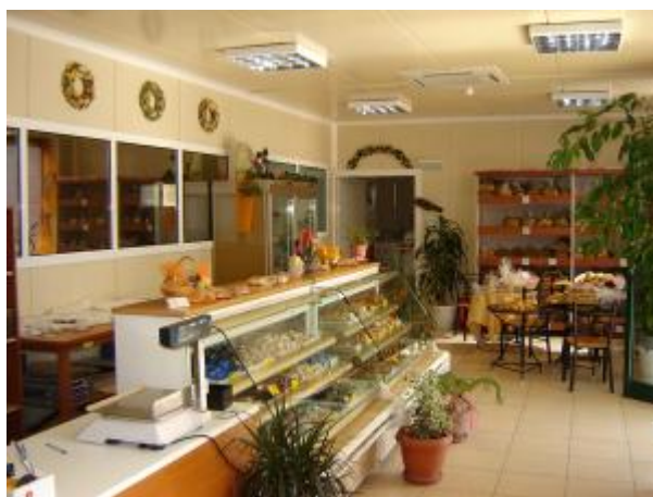
Γυναικείος Συνεταιρισμός Ασιτών Ηρακλείου Κρήτης