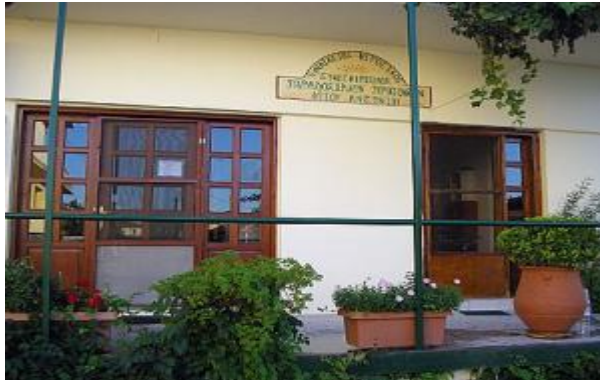
Αγροτικός Βιοτεχνικός Γυναικείος Συνεταιρισμός Βελβεντού Κοζάνης