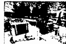
Στον Αυλάνα. Οι νέες φυλακές ανηλίκων τελικά δεν κατάφεραν να βοηθήσουν τους 250 εγκλείστους, καθώς τα προγράμματα στήριξης δεν έχουν διάρκεια

«Αυτό σημαίνει ότι στην πράξη θα πρέπει να έχουν εξαντληθεί όλα τα ηπιότερα μέτρα, όπως η επίπληξη, η επιμέλεια γονέων, η επιμέλεια επιμελητή ανηλίκων, η εργασία για την κοινότητα, η αποζημίωση του θύματος ή της οικογένειάς του με χρήματα που θα προέλθουν από εργασία του ανηλίκου δράστη. Οι κανόνες αυτοί φυσικά δεν έχουν δεσμευτική δύναμη. Ωστόσο, στην πράξη εφαρμόζονται τόσο στη χώρα μας όσο και στα περισσότερα ευρωπαϊκά κράτη».