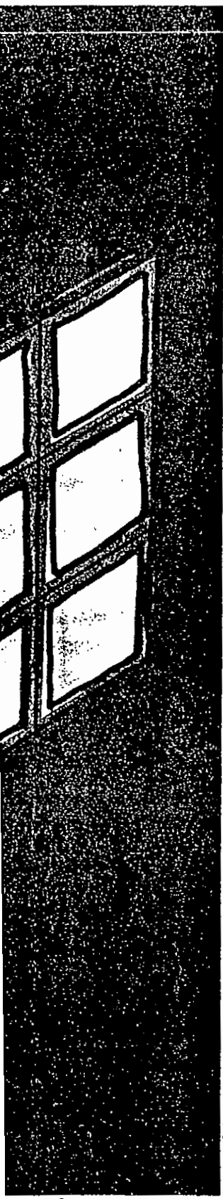
Illustration: Richard May

with disabled people pursuing their right to have relationships because this might expose staff to a risk of allegations, or the disabled person to abusive practices by care staff. In some cases, care providers would also have to deal with parental disapproval of residents being permitted to have sexual relationships.