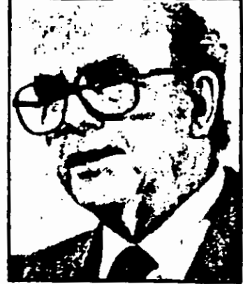
Ο πρωθυπουργός κ. Α. Παπανδρέου μιλάει στο Εθνικό Συμβούλιο Ανώτατης Παιδείας