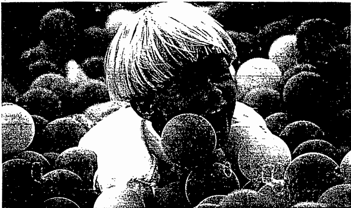
DEBORAH LEVINS ON / SUPERSTOCK