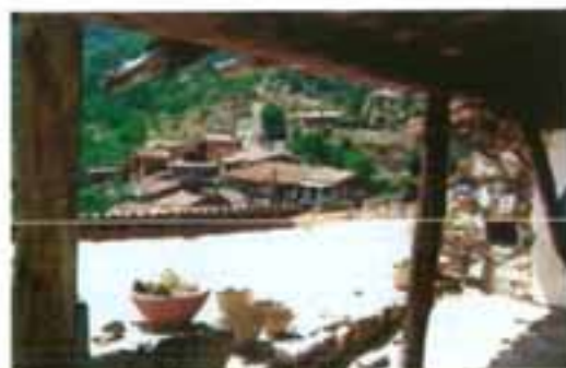
Το χωριό Φικάρδου

Με βάση το Σχέδιο Οικονομικών Κινήτρων προχωρεί η διαδικασία για την επιδιόρθωση παραδοσιακών σπιτιών σε διάφορα χωριά, οι ιδιοκτήτες των οποίων