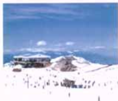
Άποψη από το χιονοδρομικό κέντρο του Παρνασσού

Έκταση: 2.120 τ.χλμ. Πληθυσμός (2001): 48.284 Κατανομή πληθυσμού: Αγροτικός:31.760 Αστικός :16.524 Δημοί :12 Πρωτεύουσα: Άμφισσα Βουνά: Γκιώνα Βαρδούσια Οίτη Παρνασσός Ποτάμια: Μόρνος