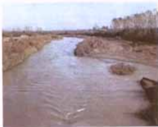
Ο Σπερχειός ποταμός

Ο νομός συνορεύει βόρεια με τους νομούς Μαγνησίας, Λάρισας, Καρδίτσας, δυτικά με το νομό Ευρυτανίας και νότια με τους νομούς Αιτωλοακαρνανίας, Φωκίδας και Βοιωτίας. Ανατολικά βρέχεται από τον Ευβοϊκό και τον Μαλιακό κόλπο και από τον διάυλο των Ωρεών.