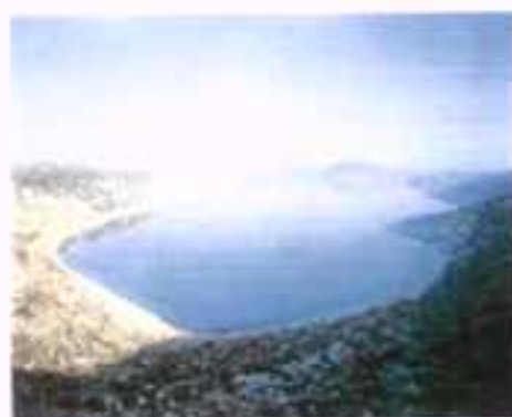
Άποψη της λίμνης Υλίκης στο νομό Βοιωτίας