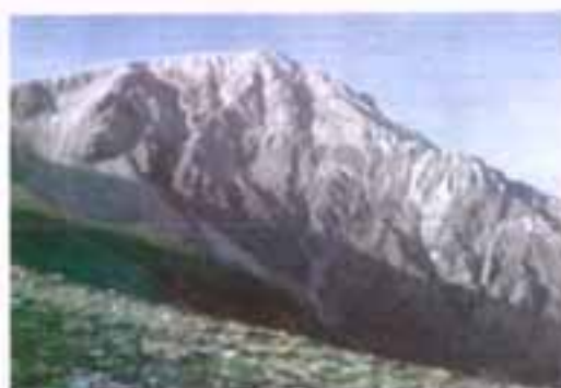
Άποψη του Τυμφρηστού

Έκταση: 1.869 τ.χλμ. Πληθυσμός(2001): 32.053 Κατανομή πληθυσμού: Αγροτικός: 25.278 Αστικός : 6.775 Δημοί: 11 Πρωτεύουσα: Καρπενήσι Βουνά: Τυμφρηστός Άγραφα Καλιακούδα Πίνδος Οξυά Ποτάμια: Αχελώος Ταυρωπός Άγραφιώτης