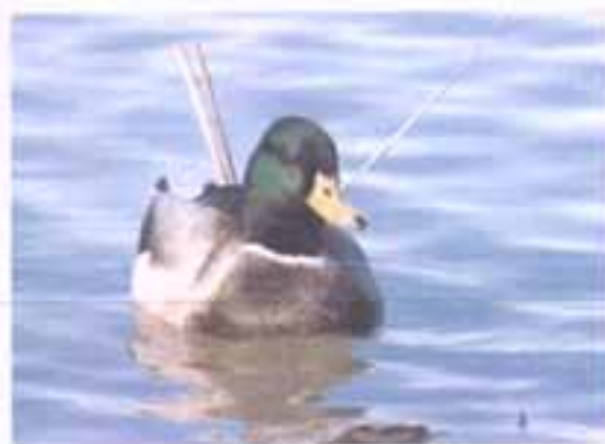
Πρασινόκεφαλη πάπια ( Anas platyrhynchos ) στη λιμνοθάλασσα Μεσολογγίου

Ο υγροβιότοπος του Μεσολογγίου - Αιτωλικού, μαζί με το Δέλτα του Αχελώου και του Εύηνου (Φίδαρη), είναι ένας απ' τους μεγαλύτερους της Μεσογείου. Βρίσκεται στο δυτικότερο άκρο της Στερεάς Ελλάδας, στο Νομό Αιτωλοακαρνανίας. Έχει έκταση 250.000 στρέμματα και έχει δημιουργηθεί, με την πάροδο του χρόνου, απ' τις φερτές ύλες των δύο ποταμών.