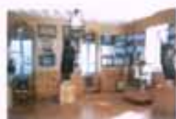
Ε σωτερικό του Μουσείου