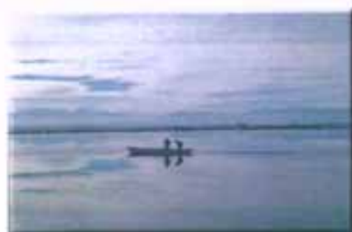
Ψάρεμα στη λιμνοθάλασσα

Στο Αχελώο ψαρεύονται Κεφαλοειδή, Λαυράκια, Βελάνισσες, Στρωσιδία ( Barbus albanicus ), Κυπρίνια ( Cyprinus carpio ), Πέστροφες ( Salmo trutta ), Δρομίτσες ( Rutillus ylikiensis ) και Γλανίδια ( Parasilurus aristotelis ), που είναι είδος ενδημικό του Αχελώου. Τα τελευταία απαντώνται επίσης στα νερά της Λυσιμαχίας και της Τριχωνίδας.