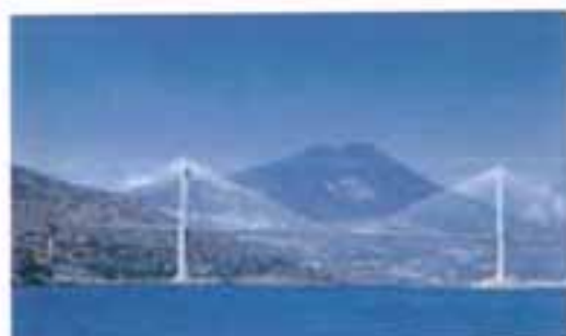
Η νέα, σύγχρονη "κρεμαστή" γέφυρα