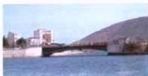
Η γέφυρα στο στενό του Ευρίπου