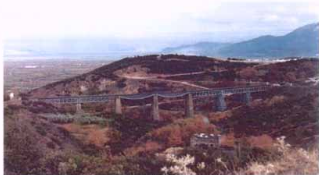
της Γραμμής Αθήνας - Λάρισας.

Πάνω απ' το χωριό βρίσκεται η ιστορική γέφυρα του Γοργοποτάμου, που ενώνει τις δύο πλαγιές της Οίτης. Πάνω της περνά η σιδηροδρομική γραμμή Αθηνών - Θεσσαλονίκης. Το 1905 το σιδηροδρομικό δίκτυο μέχρι το Μπράλο ήδη λειτουργούσε πλήρως. Το υπόλοιπο όμως ορεινό σιδηροδρομικό δίκτυο από Μπράλο μέχρι Λιανοκλάδι ήταν υπό κατασκευή. Η κατασκευή της γέφυρας του Γοργοποτάμου τελείωσε το 1905. Της 20 Ιουλίου 2005 αρχίζει η εκμετάλλευση του τμήματος Μπράλου - Λιανοκλαδίου με σκοπό να εξυπηρετήσει τοπικούς συρμούς που έκαναν τα άλλα σιδηροδρομικά έργα στη περιοχή. Της 24 Αυγούστου 1908, αφού τελείωσαν τα έργα, γίνεται η πρώτη επίσημη λειτουργία