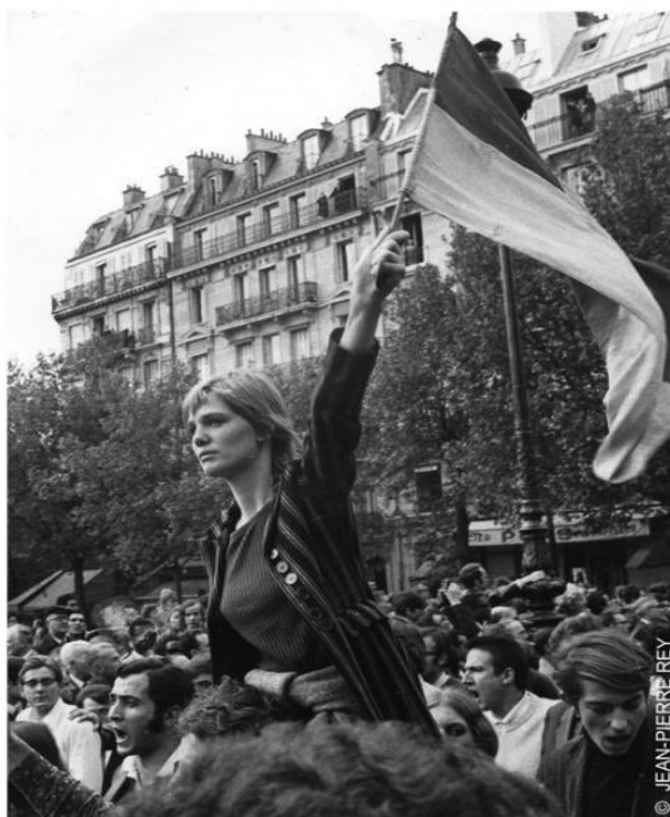
Εικόνα 2: Χαρακτηριστική φωτογραφία του Μάη του '68, γνωστή με τον τίτλο "La Marianne de Mai 68".

Τις επόμενες ημέρες οι φοιτητές κατέλαβαν τη Σορβόνη ανακηρύσσοντάς την «αυτόνομο λαϊκό πανεπιστήμιο», ενώ οι εργαζόμενοι άρχισαν να καταλαμβάνουν τα εργοστάσια. Η αρχή έγινε με την καθιστική διαμαρτυρία στις αεροπορικές εγκαταστάσεις της Ναντ, ακολούθησε άλλη μία απεργία στο εργοστάσιο της “Renault” της Ρουέν και σταδιακά και σε άλλα εργοστάσια της Γαλλίας. Μέχρι τις 16 Μαΐου οι εργαζόμενοι είχαν καταλάβει περίπου 50 εργοστάσια και μέχρι τις 17 Μαΐου οι απεργοί ήταν 200.000. Σταδιακά τις επόμενες ημέρες οι απεργοί έφτασαν τους 10.000.000, δηλαδή τα 2/3 του εργατικού δυναμικού της χώρας. Τα αιτήματα της διαμαρτυρίας σταδιακά πήραν πολιτικές και κοινωνικές διαστάσεις ζητώντας την παραίτηση της κυβέρνησης και του Προέδρου Σαρλ Ντε Γκωλ. Σε πολλές περιπτώσεις ομάδες απεργών εργατών προσπάθησαν να αναλάβουν την αυτοδιοίκηση των εργοστασίων όπου δούλευαν.