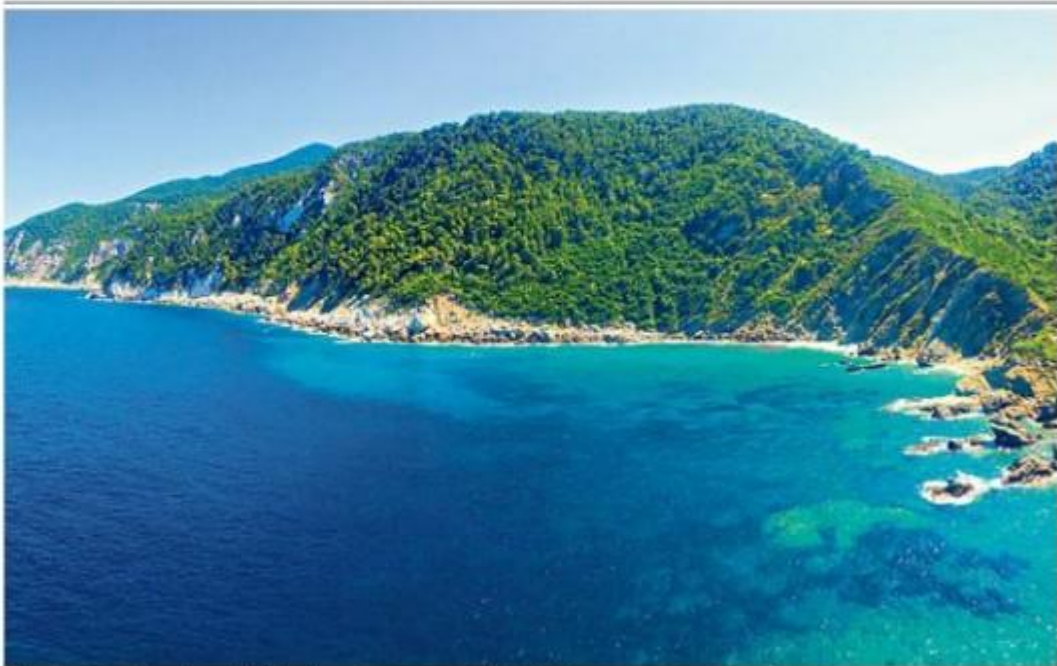
The view from the chapel of Agios Ioannis.

Authentic hilltop towns, empty beaches, and characterful tavernas frequented by hordes of pregnant cats - Skopelos has nearly everything a visitor to Greece could ask for