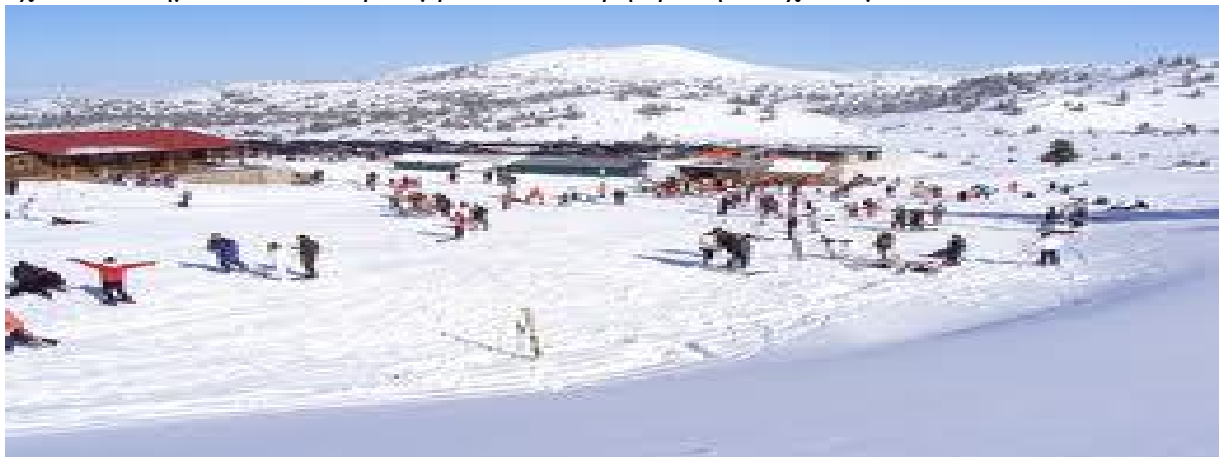
Χιονοδρομικό Κέντρο Καλαβρύτων