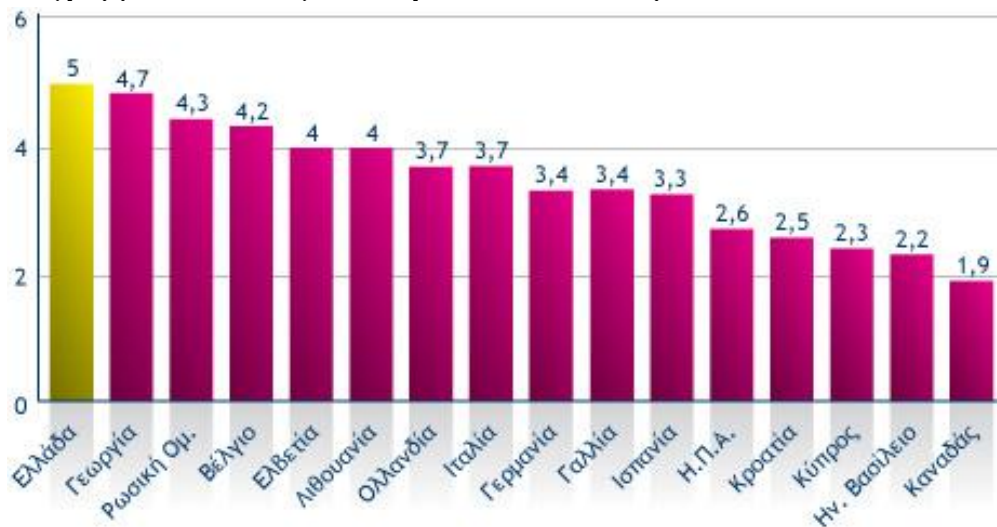
Διάγραμμα 1.1 Αναλογία Γιατρών ανά 1000 άτομα