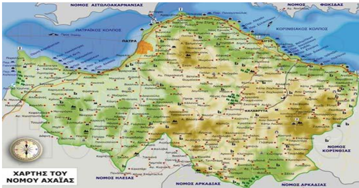
Εικόνα 1.1. Νομός Αχαΐας

Ο Νομός Αχαΐας διοικητικά ανήκει στην Περιφέρεια Δυτικής Ελλάδας μαζί με τους νομούς Αιτωλοακαρνανίας και Ηλείας. Αποτελεί το γεωγραφικό κέντρο βάρους της περιφέρειας, καθώς κατέχει το 29% της συνολικής έκτασης και το 43% του συνολικού πληθυσμού της. Αποτελείται από τις επαρχίες Πατρών, Αιγιάλειας και Καλαβρύτων και διαιρείται σε 21 Δήμους και 2 Κοινότητες. Πρωτεύουσα του νομού είναι η πόλη της Πάτρας η οποία είναι το τρίτο σε μέγεθος αστικό κέντρο της χώρας. Η Αχαΐα συνδυάζει φυσική ομορφιά και πολιτιστική ανάπτυξη. Αποτελεί ένα κομμάτι Ελληνικής γης που αναδεικνύει την ιστορική κληρονομιά και το σύγχρονο πολιτισμό.