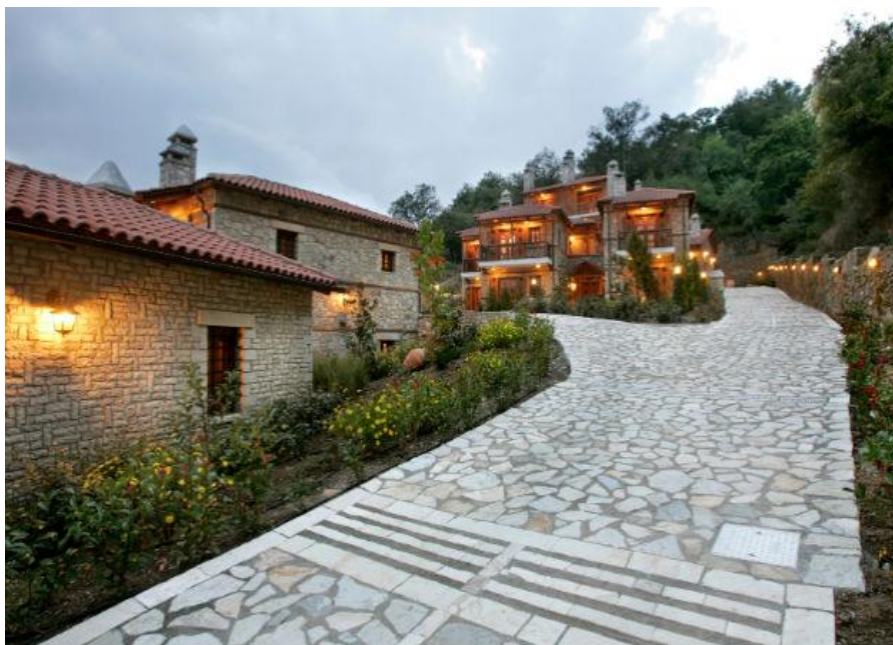
Εικόνα 1.1: Αγροτουριστικά Καταλύματα

ευαισθησία. Έχουν επίσης ως επί το πλείστον μεγάλη οικονομική επιφάνεια και επιλέγουν υπηρεσίες υψηλών προδιαγραφών 10 .