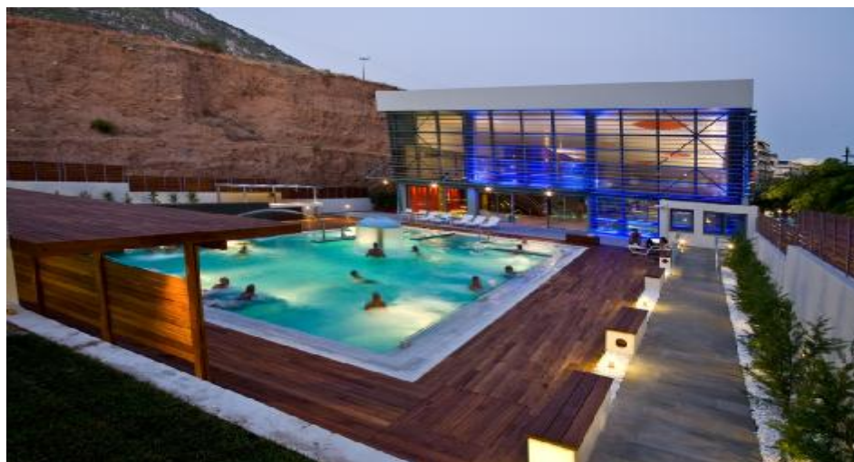
Σχ. 2.3. Loutraki Thermal Spa