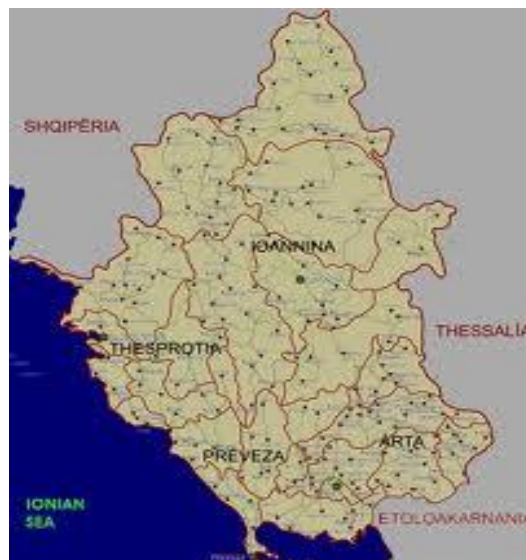
Η Περιφέρεια Της Ηπείρου

Η Ήπειρος αποτελεί το γεωγραφικό διαμέρισμα της Ελλάδας, το οποίο εκτείνεται στο βορειοδυτικό άκρο της. Την περιφέρεια της Ηπείρου αποτελούν οι νομοί Άρτας, Ιωαννίνων, Θεσπρωτίας και Πρέβεζας. Η έκταση της είναι 9.223 τ.χλμ. και πρωτεύουσα και μεγαλύτερη πόλη της είναι τα Ιωάννινα με πληθυσμό περίπου 112.000 κατοίκους.