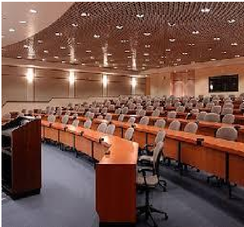
Συνεδριακός – Εκθεσιακός Τουρισμός

Συνεδριακός τουρισμός ονομάζεται ο τουρισμός, ο οποίος σχετίζεται με την παρακολούθηση συνεδρίων, εκθέσεων κ.λ.π. Για την ανάπτυξη του συνεδριακού τουρισμού σε έναν τόπο, σημαντικό ρόλο παίζει η διαθεσιμότητα των απαραίτητων υποδομών και υπηρεσιών, όπως για παράδειγμα αμφιθεάτρων, εκθεσιακών χώρων, υποδομών εστίασης, κ.α. Καθοριστικός επίσης παράγοντας για την προσέλκυση επισκεπτών είναι η ευκολία πρόσβασης στον τόπο που πραγματοποιείται ένα συνέδριο ή μια έκθεση.