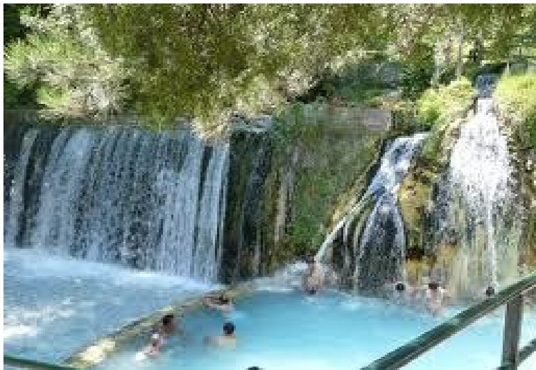
Θεραπευτικός - Ιαματικός Τουρισμός

Στη χώρα μας έχει αναπτυχθεί από τους αρχαίους χρόνους ο ιαματικός τουρισμός. Τα ιαματικά λουτρά αποτελούν μέρος του εθνικού μας πλούτου. Τα νερά των ιαματικών πηγών διαφέρουν από τα συνηθισμένα εξαιτίας της υψηλής τους θερμοκρασίας και της παρουσίας σπάνιων δραστικών συστατικών που περιέχουν και χαρακτηρίζονται ως μεταλλικά.