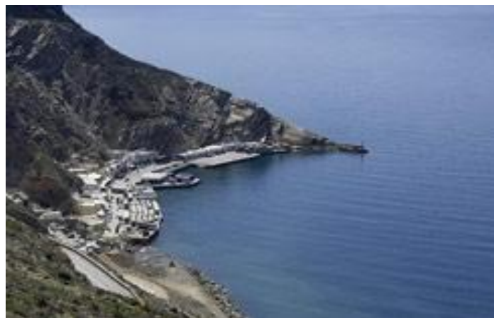
Αθηνιός- Το λιμάνι της Σαντορίνης

Στη Σαντορίνη ταξιδεύουν ακόμα πλοία από την Κρήτη, τη Ρόδο και βασικά από όλα τα Δωδεκάνησα καθώς και τα νησιά του Ανατολικού Αιγαίου με ενδιαμέσους σταθμούς. Το ταξίδι στο νησί της Θήρας μπορεί να γίνει με συμβατικό πλοίο ferry boat, με High speed ferries ή με δελφίνι, ανάλογα με την ημέρα και την εταιρία που κάποιος επιθυμεί να ταξιδέψει. Τους καλοκαιρινούς μήνες τα δρομολόγια των πλοίων διπλασιάζονται και πολλές φορές πολλαπλασιάζονται. ( www.ferries-greece.com )