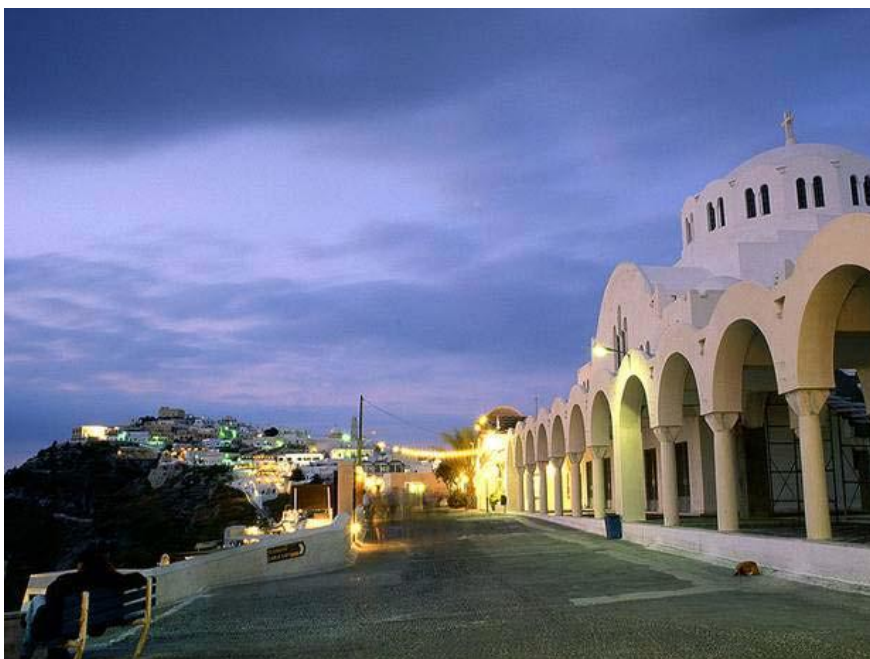
Παναγία Υπαπαντή ( Φηρά )

Όπως σε όλα τα κυκλαδίτικα νησιά, έτσι και στη Σαντορίνη, υπάρχουν εκκλησίες παντού, γεγονός το οποίο αποτελεί απόδειξη του δεσίματος της καθημερινής ζωής των κατοίκων του νησιού με τη θρησκευτική αντίληψη. Το νησί προσφέρεται για θρησκευτικό τουρισμό τόσο για τις ορθόδοξες όσο και για τις καθολικές του εκκλησίες και μοναστήρια. Αν και πρόκειται για ένα μικρό σε μέγεθος νησιωτικό προορισμό, διαθέτει συνολικά 329 ορθόδοξους ναούς και ξωκλήσια σε όλους τους οικισμούς της Σαντορίνης, καθώς επίσης και 10 καθολικούς ναούς. Επίσης, το νησί της Θηρασίας διαθέτει 14 εκκλησίες. ( www.santorini.gr )