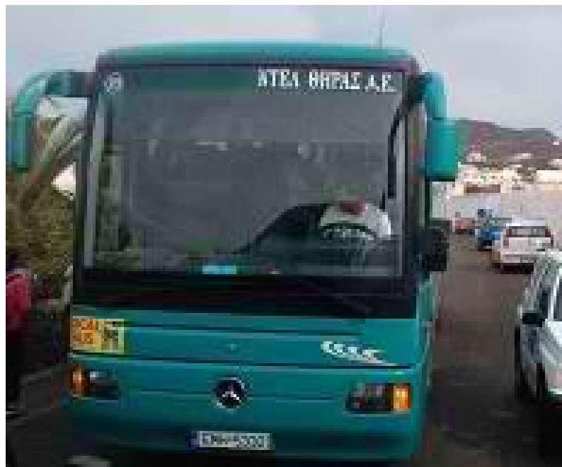
Λεωφορείο του κτελ Θήρας

Τα λεωφορεία του κτελ της Θήρας συνδέουν μεταξύ τους τους οικισμούς του νησιού. Με λεωφορείο γίνεται η μεταφορά των επισκεπτών του νησιού από το λιμάνι του Αθηνιού προς τα υπόλοιπα μέρη του νησιού, την Οία, τον Πύργο, το Ακρωτήρι κ.λ.π. Επίσης, από την πρωτεύουσα της Σαντορίνης, τα Φηρά μπορεί κανείς να χρησιμοποιήσει λεωφορεία του κτελ για να βρεθεί από την πιο κοντινή έως και την πιο μακρινή παραλία του νησιού. Γνωστές παραλίες όπου υπάρχουν τακτικά δρομολόγια αποτελούν η Κόκκινη Παραλία, η παραλία Βλυχάδα, ο Μονόλιθος, το Καμάρι και η Περίσσα. . ( www.santorini888.gr )