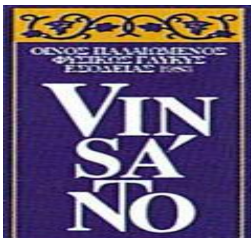
Βινσάντο-Το παραδοσιακό κρασί της Σαντορίνης

Το Βινσάντο (Vino di Santorini) το παραδοσιακό γλυκό κρασί της Σαντορίνης που είναι συνδεδεμένο με τη σύγχρονη ιστορία της και την έχει κάνει γνωστή σε όλο το κόσμο. Η οινοποίηση του γίνεται από λιασμένα σταφύλια στον καλοκαιρινό ήλιο της Σαντορίνης. ( www.santoriniinfo.gr )