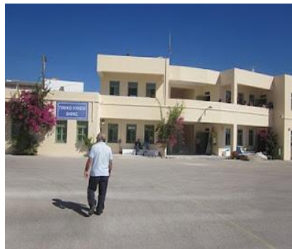
Γενικό Λύκειο Θήρας

Ακόμα αξίζει να αναφερθεί ότι υπάρχει παιδικός σταθμός και νηπιαγωγείο στην περιοχή της Οίας και στη Θηρασιά. ( www.dide.kyk.sch.gr )