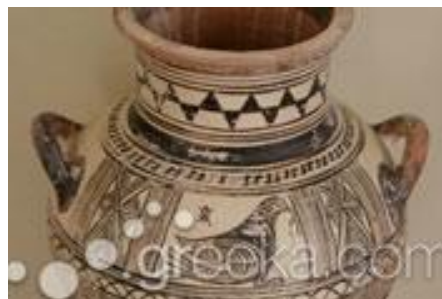
Λαογραφικό Μουσείο Σαντορίνης

Τέλος, αρκετές είναι και οι υποδομές που αναδεικνύουν τον αρχαίο πολιτισμό στο νησί, όπως για παράδειγμα το Αρχαιολογικό Μουσείο, το Λαογραφικό Μουσείο, το Μέγαρο Γκύζη, το Ναυτικό Μουσείο κ.ά. ( www.greeka.com )