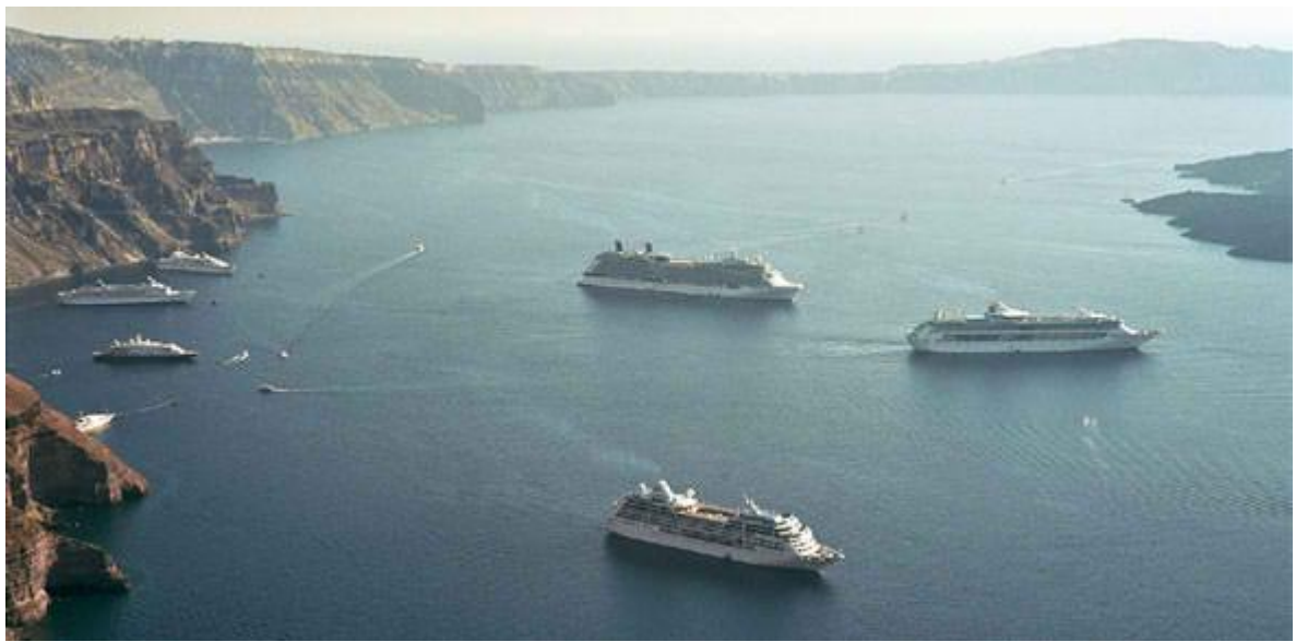
Τουρισμός της κρουαζιέρας