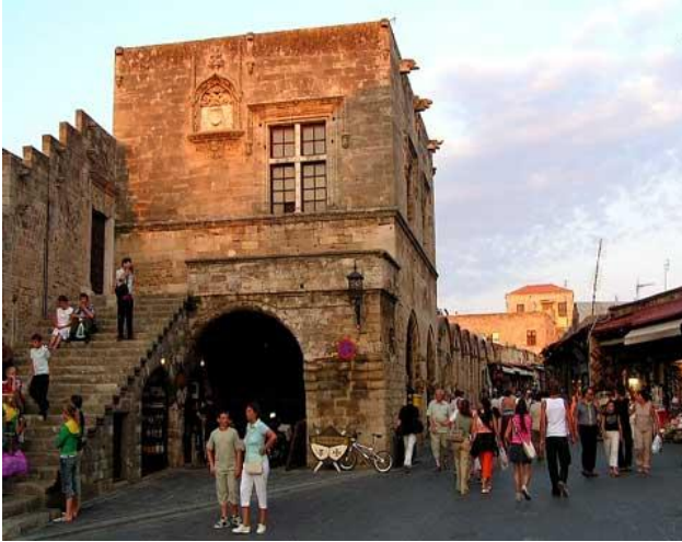
ΠΑΛΙΑ ΠΟΛΗ ΡΟΔΟΥ