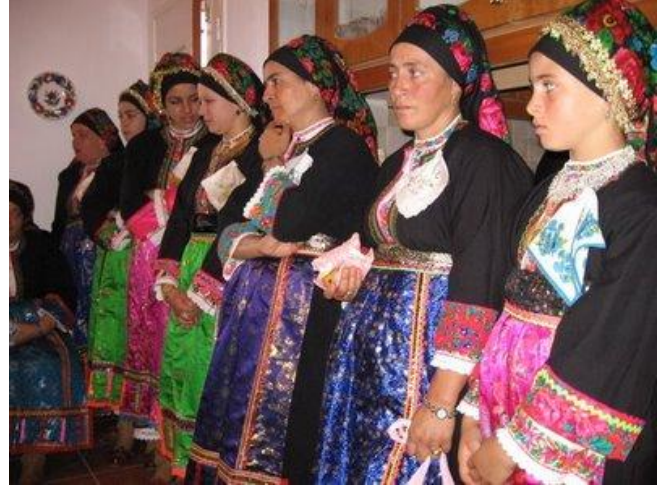
ΟΛΥΜΠΟΣ ΚΑΡΠΑΘΟΥ ΦΟΡΕΣΙΑ