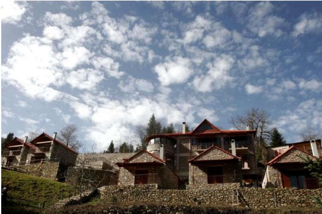
Άποψη των κτιριακών εγκαταστάσεων.