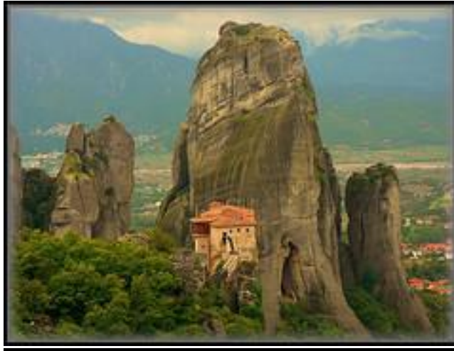
Φωτό 2: Μετέωρα

Η επιφάνεια της Ελλάδας καλύπτεται με 67% από βουνά. Έτσι, χρυσή ευκαιρία για την ανάπτυξη των εσόδων του κράτους είναι ο ορεινός τουρισμός. Σήμερα εκτιμάται ότι περίπου 100.000 άτομα ετησίως ανεβαίνουν το βουνό, ενώ κάθε χρόνο έχουμε 15.000 διανυκτερεύσεις στον Όλυμπο. Επίσης, περίπου 25.000 άτομα κάνουν ράφτινγκ ετησίως, ενώ συνήθως το 60% των τουριστών στα βουνά είναι ξένοι και το υπόλοιπο 40% Έλληνες.