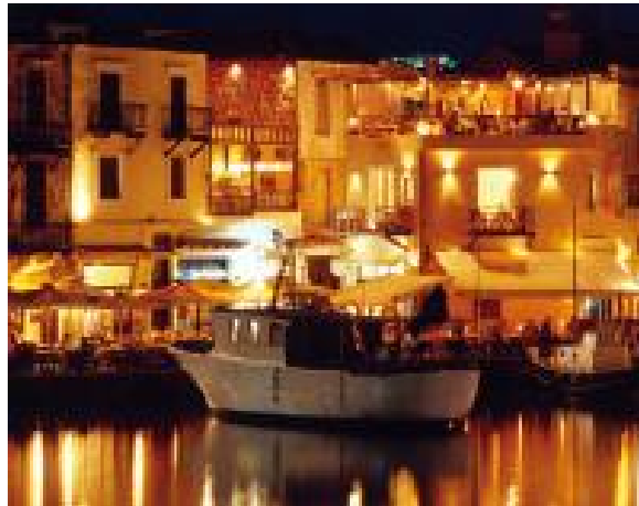
Το λιμάνι του Ρεθύμνου