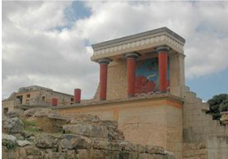
Τα τείχη της Κνωσού

στεατίτη, πέτρα, ελεφαντοκόκαλο, λατρευτικά αντικείμενα, αγγεία, σκεύη καθημερινής χρήσης, εργαλεία, όπλα, σφραγιδολίθοι, χρυσά κοσμήματα, όλα δουλεμένα με λεπτομέρεια και μεράκι, δείχνουν ότι οι Μινωίτες τεχνίτες κατείχαν καλά τα μυστικά της τέχνης τους και την υπηρετούσαν τέλεια.