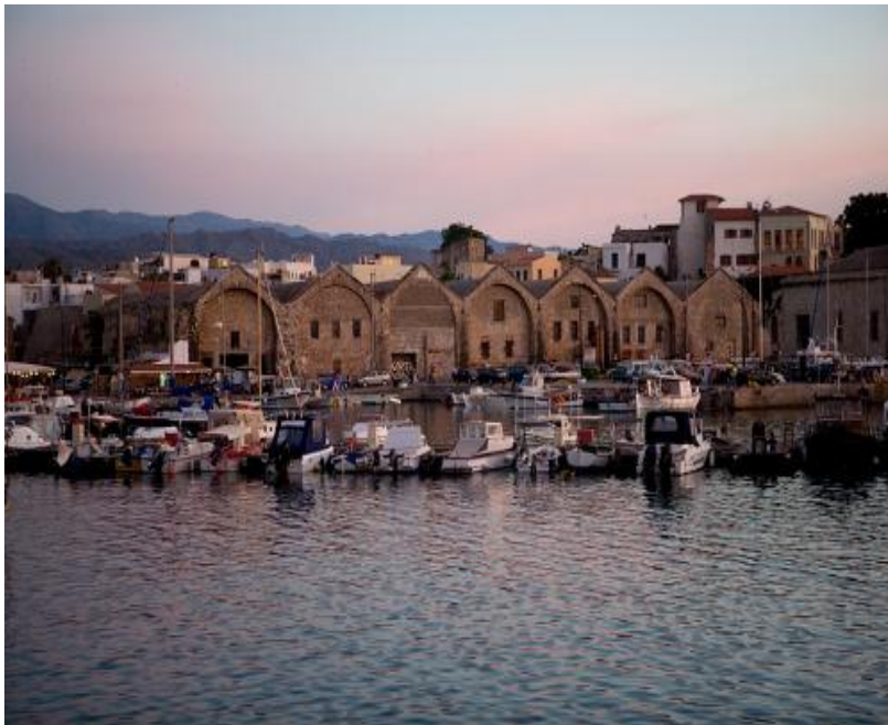
Το λιμάνι των Χανίων

μέχρι τη θάλασσα και νότια μέχρι το Ελαφονήσι. Το Καστέλι είναι η πιο σημαντική πόλη της περιοχής αυτής. Η πόλη αυτή έχει αρκετά ανεπτυγμένη τουριστική υποδομή. Στον παραλιακό δρόμο από το Καστέλι για το Ελαφονήσι οι επισκέπτες έχουν τη δυνατότητα να θαυμάσουν την άγρια ομορφιά της δυτικής Κρήτης. Οι παραλίες στο Ελαφονήσι, τη Φαλάσαρνα και τη Γραμβούσα είναι από τις ωραιότερες της Κρήτης. Αρκετές βυζαντινές και βενετικές εκκλησίες, καθώς και οι αρχαίες πόλεις της Πολυρρήνιας και των Φαλάσαρνων μπορεί να προκαλέσουν το ενδιαφέρον των επισκεπτών. Οι περιοχές της Γραμβούσας και της Σπάθας είναι σχεδόν αδύνατο να προσπελαστούν με αυτοκίνητο. Μόνο οι ορειβάτες μπορούν να απολαύσουν αυτά τα μέρη.