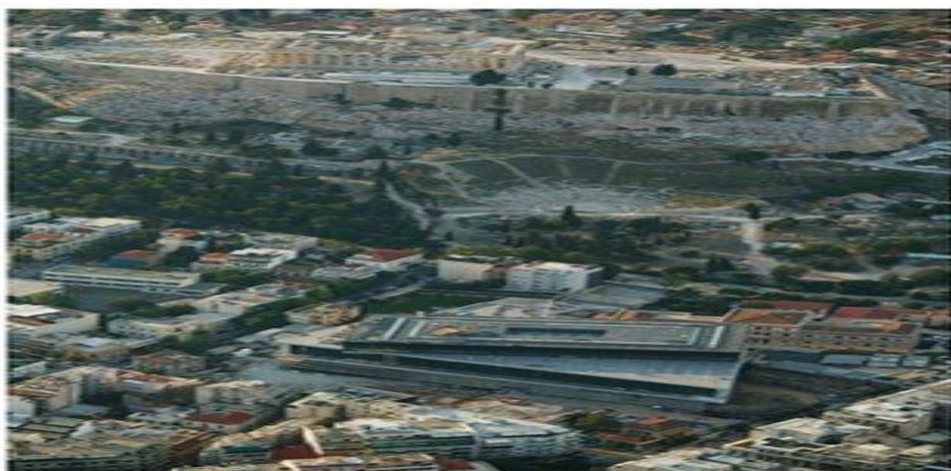
Ο Παρθενώνας, το Διονυσιακό Θέατρο και το Νέο Μουσείο της Ακρόπολης.

Το Μουσείο Ακροπόλεως και οι δραστηριότητές του είναι άρρηκτα δεμένα με τον αρχαιολογικό χώρο και τις εργασίες που πραγματοποιούνται στο πλαίσιο των αναστηλωτικών προγραμμάτων στα μνημεία του βράχου και των κλιτύων της Ακρόπολης. Από τις αρχές του 2007, οι αίθουσες του παλαιού Μουσείου έκλεισαν σταδιακά για το κοινό προκειμένου να πραγματοποιηθεί η αποσυναρμολόγηση, συντήρηση και προετοιμασία των γλυπτών που θα μεταφερθούν και θα εκτεθούν στο κτήριο του Νέου Μουσείου της Ακροπόλεως. Στη συνέχεια, οι εκθεσιακοί χώροι του παλαιού κτηρίου πρόκειται να αξιοποιηθούν κατάλληλα με στόχο την ενημέρωση των επισκεπτών για σχετικές με τον αρχαιολογικό χώρο και τα μνημεία δραστηριότητες.