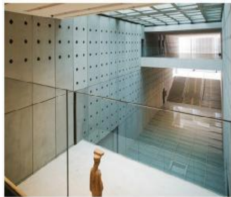
Ο εξώστης με θέα την Αίθουσα των Κλιτύων της Ακρόπολης