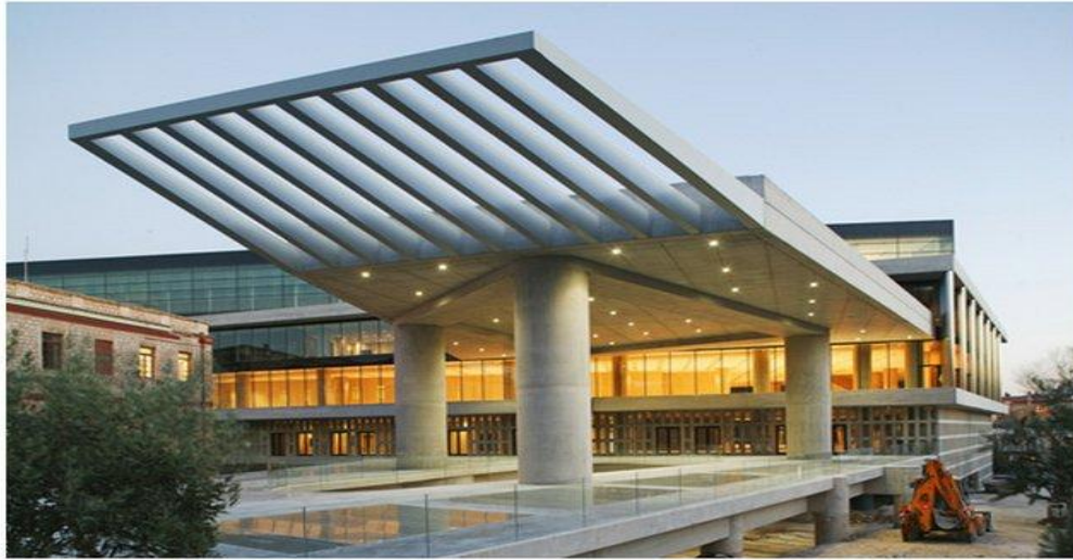
Η είσοδος στο Μουσείο

Εδώ και τρεις δεκαετίες η ελληνική πολιτεία έχει θέση ως στόχο την κατασκευή ενός νέου μουσείου που θα μπορεί με αξιώσεις να στεγάσει όλες τις σωζόμενες αρχαιότητες της Ακρόπολης. Ήδη κατά την κατασκευή του υπάρχοντος μουσείου πάνω στο βράχο το 19 ο αιώνα έγινε αντιληπτό ότι θα ήταν μικρό για την ανάδειξη των αρχαιοτήτων της Ακρόπολης. Η έλλειψη χώρου οδήγησε πολλά από τα αρχαιολογικά ευρήματα των ανασκαφών της Ακρόπολης σε άλλα μουσεία της Αθήνας. Οι περιορισμοί του υπάρχοντος μουσείου, η τεράστια σημασία των εκθεμάτων και η προσπάθεια αποκατάστασης της ενότητας των γλυπτών του Παρθενώνα έκαναν την ανάγκη ενός νέου μουσείου επιτακτική.