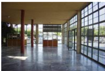
Η είσοδος του μουσείου

Το Αρχαιολογικό Μουσείο Ηρακλείου είναι από τα πιο μεγάλα μουσεία στην Ελλάδα και ένα από τα σημαντικότερα μουσεία στην Ευρώπη. Τα εκθέματά του περιλαμβάνουν αντιπροσωπευτικά δείγματα από όλες τις περιόδους της Κρητικής προϊστορίας και ιστορίας, που καλύπτουν περίπου 5.500 χρόνια, από τη νεολιθική εποχή μέχρι τους ρωμαϊκούς χρόνους. Κυρίαρχη θέση, όμως, στις συλλογές του