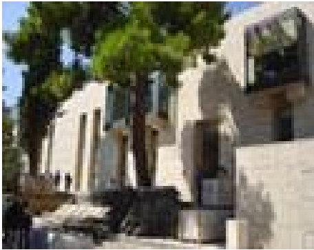
Άποψη του κτηρίου του μουσείου