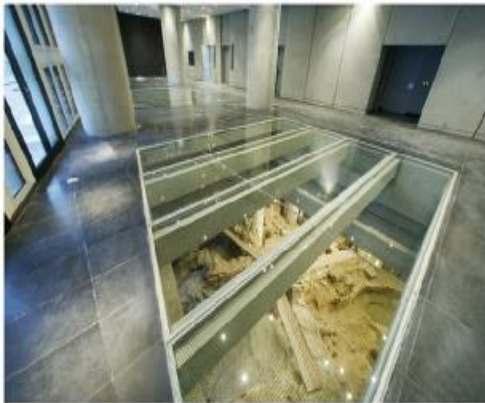
Το ισόγειο του Μουσείου

Αυτή η συλλογή περιλαμβάνει αντίγραφα κλασικών γλυπτών, ιδιαίτερα πορτρέτα.