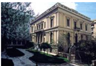
Εξωτερική άποψη του κτηρίου

Το Νομισματικό Μουσείο της Αθήνας είναι ένα από τα ελάχιστα στο είδος του στον κόσμο και το μοναδικό στην Ελλάδα και στα Βαλκάνια. Διαθέτει περίπου 600.000 νομίσματα, που καλύπτουν χρονολογικά την ελληνική αρχαιότητα, τη ρωμαιοκρατία, τους βυζαντινούς χρόνους, το δυτικό Μεσαίωνα και τους νεότερους χρόνους. Στις συλλογές του περιλαμβάνονται, επίσης, «θησαυροί» αρχαίων νομισμάτων, ανασκαφικές μαρτυρίες, μολυβδόβουλλα, μετάλλια και πολύτιμοι λίθοι, καταθέσεις δωρητών ή προϊόντα αγορών από το ίδιο το μουσείο.