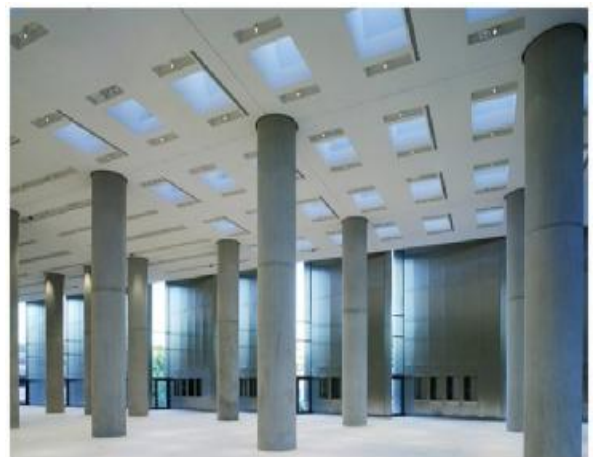
Η πολύστυλη Αίθουσα των Αρχαϊκών Γλυπτών