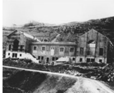
Άποψη του πρώτου μουσείου των Δελφών

Το Αρχαιολογικό Μουσείο Δελφών, από τα πιο σημαντικά στην Ελλάδα, παρουσιάζει την ιστορία του φημισμένου δελφικού ιερού και του πιο ξακουστού μαντείου του αρχαίου ελληνικού κόσμου. Οι πλούσιες συλλογές του περιλαμβάνουν κυρίως αρχιτεκτονικά γλυπτά, αγάλματα και έργα μικροτεχνίας, αφιερώματα των πιστών στο ιερό.