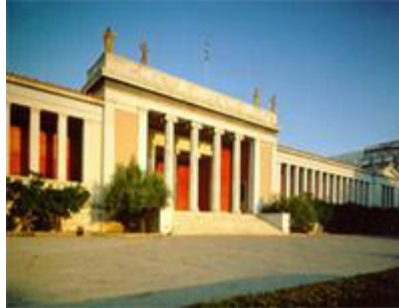
Πρόσοψη του κτηρίου του Εθνικού Αρχαιολογικού Μουσείου

Το Εθνικό Αρχαιολογικό Μουσείο είναι το μεγαλύτερο μουσείο της Ελλάδας και ένα από τα σημαντικότερα μουσεία του κόσμου. Ιδρύθηκε στα τέλη του 19ου αιώνα με σκοπό να φιλοξενήσει και να διαφυλάξει αρχαιότητες από όλη την Ελλάδα. Οι πλούσιες συλλογές του, που απαριθμούν περισσότερα από 20.000 εκθέματα, προσφέρουν στον επισκέπτη ένα πανόραμα του αρχαίου ελληνικού πολιτισμού από τις αρχές της προϊστορίας έως την ύστερη αρχαιότητα.