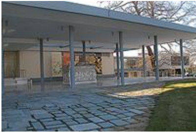
Η είσοδος του μουσείου