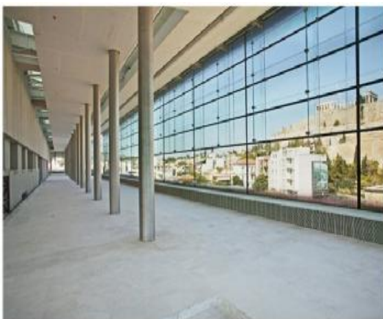
Η Αίθουσα του Παρθενώνα Άποψη της βόρειας πτέρυγας σε οπτική επαφή με τον ίδιο το ναό πάνω στο Βράχο

«Δεν υπάρχει κτίριο σαν το Νέο Μουσείο της Ακρόπολης και ως προς την έννοια και ως προς το περιεχόμενό του. Ανακαλεί μία κίνηση στον χώρο και τον χρόνο. Το Μουσείο φαίνεται να επιπλέει πάνω από την ανασκαφή που αποκαλύφθηκε στην διάρκεια των εργασιών» δήλωσε σε συνέντευξή του ο αρχιτέκτονας Bernard Tschumi.