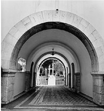
Η είσοδος του μουσείου

Το Βυζαντινό και Χριστιανικό Μουσείο, ένα από τα σημαντικότερα μουσεία στον κόσμο. Διαθέτει περισσότερα από 15.000 αντικείμενα, οργανωμένα σε συλλογές, τα οποία χρονολογούνται από τον 3ο έως και τον 19ο αιώνα. Οι συλλογές αυτές περιλαμβάνουν γλυπτά, εικόνες, έργα μικροτεχνίας, τοιχογραφίες, κεραμική και υφάσματα, χειρόγραφα, χαλκογραφίες, παλαίτυπα, καθώς και αντίγραφα έργων βυζαντινών και μεταβυζαντινών τοιχογραφιών και ψηφιδωτών. Προέρχονται από ολόκληρο τον ελλαδικό χώρο αλλά και από περιοχές του μείζονος ελληνισμού. Ο πλούτος των συλλογών και η αξία των εκθεμάτων το καθιστούν μια πραγματική κιβωτό της βυζαντινής και μεταβυζαντινής τέχνης.