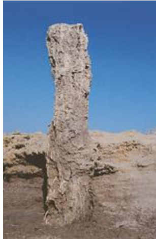
Το απολιθωμένο δάσος

Στις αμμουδερές παραλίες τέλος, συχνή είναι η παρουσία της χελώνας caretta-caretta . Στην περιοχή του Μαλέα υπάρχει ένα μνημείο της φύσης παγκόσμιας σημασίας. Πρόκειται για το περίφημο απολιθωμένο δάσος, που βρίσκεται κοντά στη θάλασσα και εντυπωσιάζει τον επισκέπτη με τους ηλικίας εκατομμυρίων ετών κορμούς του, καθώς υψώνονται μέσα από το έδαφος που το αποτελεί τεράστιος αριθμός απολιθωμένων κοχυλιών, δημιουργώντας έτσι ένα φυσικό ψηφιδωτό.