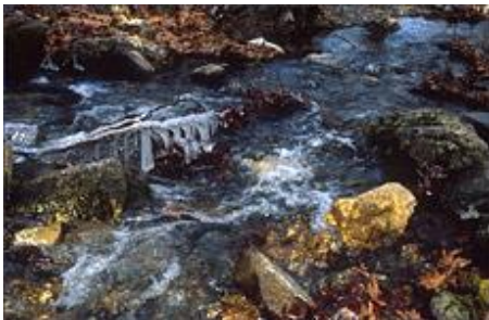
Χειμώνας στον Μαγγανιάρη

Αριστερά, πίσω από το Καταφύγιο το σηματοδοτημένο μονοπάτι οδηγεί στις θέσεις "Γούβες" (αμφιθεατρική θέση με λιβάδια), "Κρατήρα" (χαρακτηριστικό τρίεδρο σχηματισμό), "Πλάκες" (συνεχές "πλακόστρωτο" μονοπάτι μικρής κλίσης) και, τέλος, στις "Πόρτες" (διάσελο σε υψόμετρο 2.200), μετά από πορεία 2-2.30 ωρών.