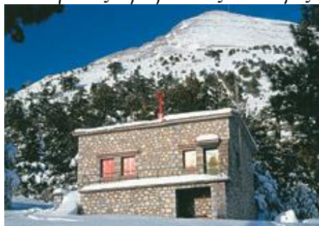
Ορειβατικό καταφύγιο Ταϊγέτου

Στοιχεία: Ελληνικός Ορειβατικός Σύλλογος Σπάρτης