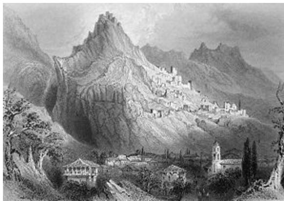
Άποψη του Μυστρά.

Γενικά οι εκκλησίες του Μυστρά αποτελούν χώρο μάθησης της βυζαντινής αρχιτεκτονικής ζωγραφικής, αγιογραφίας και χωροταξικής μελέτης της εποχής λίγο πριν την αναγέννηση.