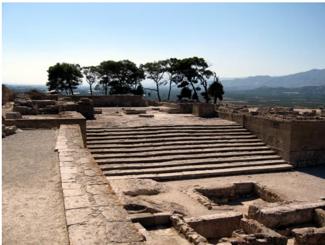
Ο ΑΡΧΑΙΟΛΟΓΙΚΟΣ ΧΩΡΟΣ ΤΗΣ ΦΑΙΣΤΟΥ