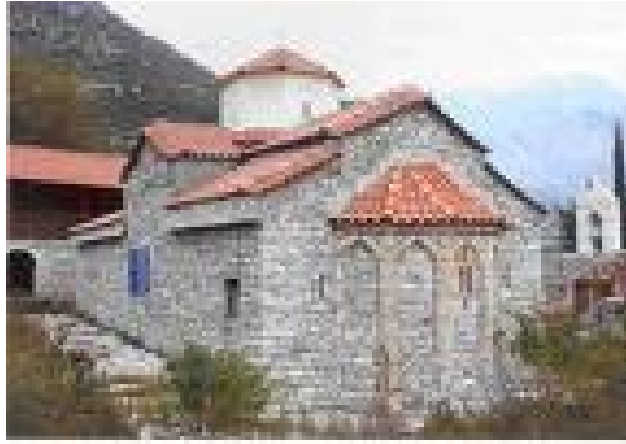
Το μοναστήρι της μονής

Η μονή Αγίας Τριάδας Τσαγκαρόλων κτίστηκε το 1612 από τους Κρητικής καταγωγής μοναχούς Ιερεμία και Λαυρέντιο που ανήκουν στη Βενετσιάνικη ορθόδοξη οικογένεια των Τσαγκαρόλων. Στη θέση της σημερινής μονής παλιότερα υπήρχε εκκλησιάκι αφιερωμένο στους Αγίους Αποστόλους. Το 1634 χτίστηκε η εκκλησία της μονής που είναι σταυροειδής με τρούλο.