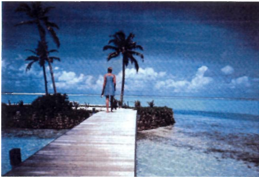
Στο Bali ξύλινα δρομάκια οδηγούν στον ωκεανό.

ατμόλουτρο με λεβάντα - ευκάλυπτο ή λεμονανθούς - μέντα, τα ιαματικά λουτρά και το μοναδικής τεχνικής μπαλινέζικο μασάζ με βασιλικό, λάδι καρύδας και πατσουλί. Το orient μασάζ βασίζεται στις ανατολικές θεωρίες σχετικά με τα κέντρα άσκησης πίεσης του σώματος. Τη φυσική λάμψη του δέρματος επαναφέρει το πίνινγκ με θαλάσσια άλατα, ρύζι και βανίλια. Για αντιγηραντική πρόληψη συνιστάται κούρα με αλόη και λεβάντα. Ενδεικτικές τιμές: Jimbaran σουίτα από 700 έως 1050 δολ, 60' μασάζ Balinese, aroma και orient 100δολ. Sayan: σουίτα από 400 έως 2800 δολ, 75' περιποίηση προσώπου – 100 δολ, δίωρο ελιξίριο σώματος – 120 δολ.