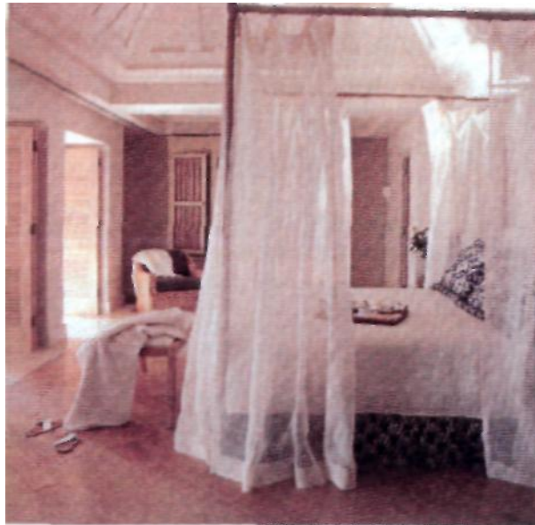
Ευάερα και δροσερά τα δωμάτια του Royal Mare.

Το Royal Mare Anti - Cellulite συνδιάζει μασάζ με έλαια, γυμναστική στις πισίνες και περιποιήσεις για τη βελτίωση της σιλουέτας και την καταπολέμηση της κυτταρίτιδας. Το Royal Mare Vein Tone επικεντρώνεται στην τόνωση της κυκλοφορίας των ποδιών με έμφαση στα κάτω άκρα. Το Royal Mare New Energy έχει σχεδιαστεί για την αύξηση της σωματικής αντοχής και τη διατήρηση της καλής φυσικής κατάστασης. Το Royal Mare Body Shape με θεραπείες όπως η πρεσοθεραπεία και η ενδερμολογία ενδυναμώνει το μυϊκό ιστό και συσφίγγει το δέρμα. Ενδεικτικές τιμές των θεραπειών: λουτρό υδρομασάζ – 50 ευρώ, επάλειψη φυκιών – 60 ευρώ, ενισχυμένη αναζωογόνηση προσώπου διάρκειας 1 ώρας – 70 ευρώ, πίνινγκ σώματος – 40 ευρώ.