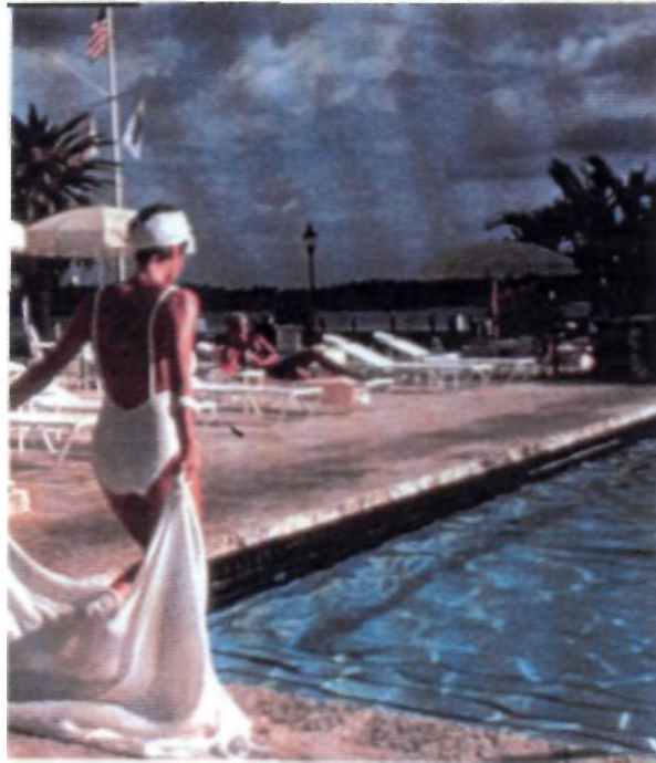
Η πισίνα του Spa Internationale.

περιλαμβάνει αρωματοθεραπεία ή κλασσικό μασάζ, island salt glow και super hydradermie facial – 300 ευρώ.