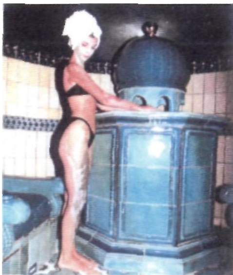
Συνδυασμός πήλινγκ με φυσικές λάσπες και ζεστής βροχής.

Το λασπόλουτρο που είναι επίσης καθολικό ή συνηθέστερα τοπικό (κατάπλασμα) στην περιοχή που πάσχει. Η δράση της λάσπης αποδίδεται κυρίως στις υψηλές θερμοκρασίες 40-46 C 0 και πλέον. Είναι γνωστοί οι επαγωγείς της θερμότητας, επίσης ότι τα στερεά σώματα κρατούν επί μακρό χρόνο τη θερμότητα και ότι τότε το ανθρώπινο σώμα την ανέχεται ευκολότερα. Γι' αυτό η λάσπη χρησιμοποιείται για δράση σε όργανα κατά βάθος. Αλλά η ιαματική λάσπη δεν αποτελεί ένα απλό μείγμα στερεού υποστρώματος και ιαματικού νερού. Το χώμα επιλέγεται από εδάφη ηφαιστιογενή, από προσχώσεις και έλη. Καλλιεργείται με το