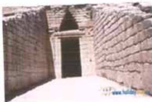
Η πύλη των Λεόντων.

Ένας μύθος λείπει ακόμα πως οι Μυκήνες πήραν το όνομα τους ίσως από το όνομα της κόρης του Ινάχου, που την έλεγαν Μυκήνη ή από το όνομα του Μυκηναία, που έχτισε, όπως λένε, την πόλη.