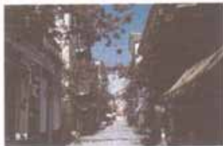
7.1 Αρχαιολογικό Μουσείο