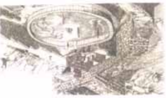
Ανασκόπηση του Περιβόλου Α από τον Α. Wace.