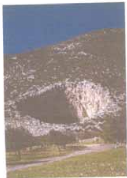
Η Μεγάλη Σπηλιό στο Δίδυμα.