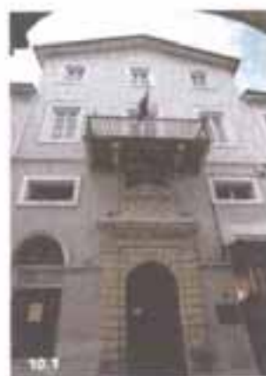
10.1 Πινακοθήκη Ναυπλίου