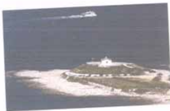
Ο Άγιος Αμβρόσιος.

Αν θέλετε να γνωρίσετε και τις ανατολικότερες ακόμα παραλίες της Ερμιονίδας, φτάνετε ως τη Δάρδιζα και το Θερμήσι, μικρό χωριό πνιγμένο σε περιβόλια που μοσχοβολούν την άνοιξη. Δίπλα του μεγάλες ξενοδοχειακές μονάδες και από πάνω του επιβάλλεται με τη μεγαλοπρέπεια του το ενετικό κάστρο που σας προκαλεί να εξερευνησετε.