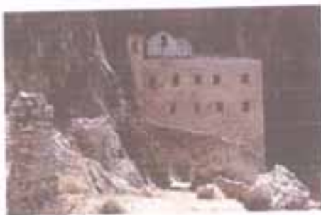
Η Μονή του Αυγού.

Δυτικά του Κρανιδίου και πολύ κοντά στην Κοιλιάδα βρίσκονται οι παραλίες Λεπίτσα, Δορούδι, Βροχίτσα, Λάκκες και Θυνί με καταγάλανες θάλασσες και μικρούς κολπίσκους.