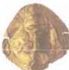
Χρυσή πρόσωπιδα από τον ταφικό περιβόλο Α', 16 ος π.Χ. αιώνας.