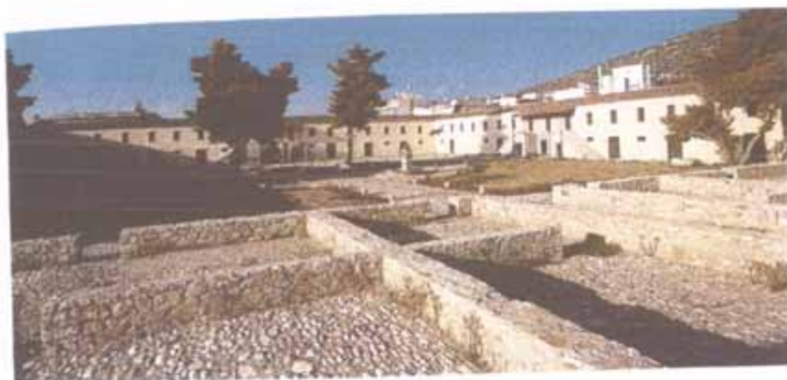
Οι Στρατώνες του Καποδίστρια.