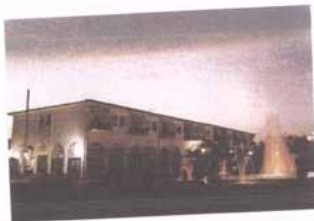
Πλατεία Ν. Κίου.

Η παραλιακή αυτή κωμόπολη με τη θαυμάσια αμμουδιά παρουσιάζει τα τελευταία χρόνια μεγάλη τουριστική κίνηση. Ειδικά τα πιο πρόσφατα χρόνια έχει αποκτήσει μεγάλη επισκεψιμότητα, ιδιαίτερα από ηλικιωμένους που κάνουν αμμόλουτρα, αφού η συγκεκριμένη άμμος έχει θεραπευτικές ιδιότητες κυρίως στις ρευματικές παθήσεις.