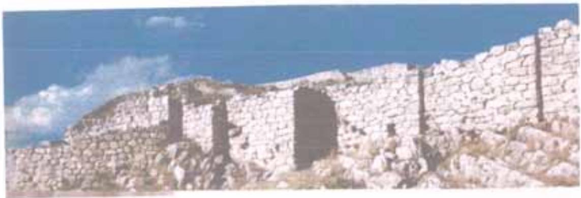
Άποψη του αρχαιολογικού τείχους

Σήμερα ο επισκέπτης θα θαυμάσει τα μυθικά κυκλώπεια τείχη, που κάθε ογκόλιθος ζύγιζε πάνω από 10 τόνους, τις μοναδικές σήραγγες, καθώς και το μέγαρο των ανακτόρων με την αίθουσα και τον πρόδομο, που είναι διακοσμημένα με υπέροχες παραστάσεις.