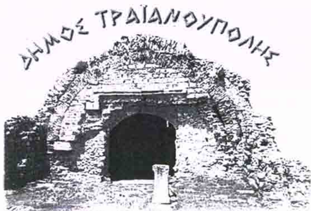
Καλώς ορίσατε στο Δήμο Τραϊανούπολης

Ο Δήμος Τραϊανούπολης βρίσκεται στο νότιο τμήμα του νομού Έβρου, περιλαμβάνει τους οικισμούς Ανθείας, Αρίστηνου, Λουτρού, Δωρικού, Νίψας, Αετοχωρίου, Πεύκων και καταλαμβάνει συνολική έκταση 178.560 στρεμμάτων. Ο συνολικός πληθυσμός του Δήμου είναι 3.390 κάτοικοι με την εξής κατανομή (Βλέπε Πίνακα 9):