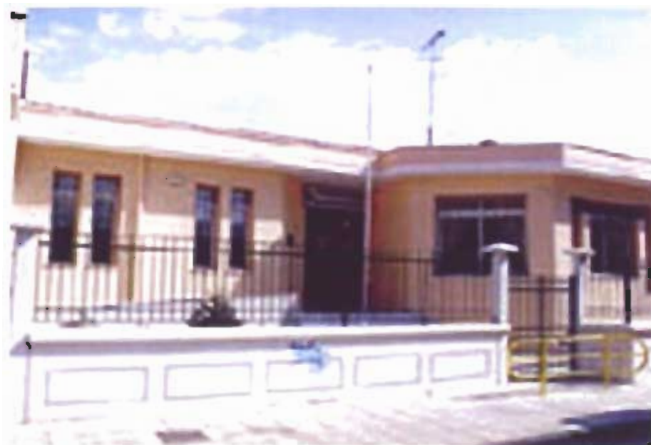
14. Πολιτιστικό Κέντρο Φιλόπολου Αδελφότητας Νάουσας