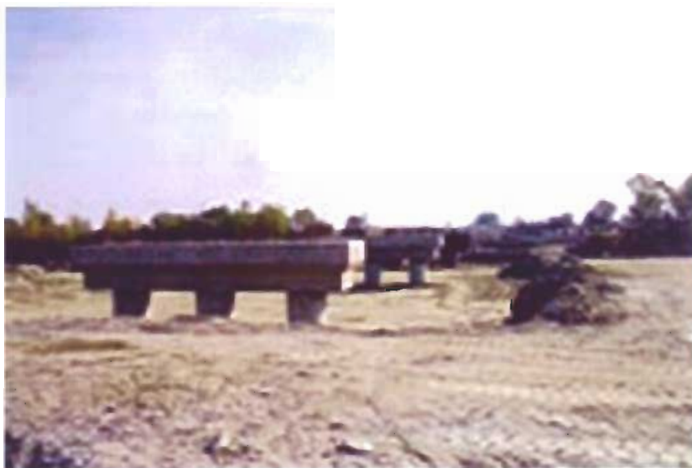
4. Γέφυρα επί της οδού Δοβρά - Γιργιούπολης (500 εκ. δρχ.)