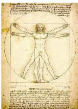
Ο Άνθρωπος του Βιτρούβιου ή Κανόνας των Αναλογιών.

Το Ευρωπαϊκό Δικαστήριο του Στρασβούργου κρίνει αυστηρά και δεν επιτρέπει καμία παραβίαση των θεμελιωδών ανθρωπίνων δικαιωμάτων ενώ τηρεί με σχολαστικότητα την « Αρχή της Αναλογικότητας ». Η αρχή αυτή ορίζει ότι μεταξύ του συγκεκριμένου διοικητικού μέτρου και του επιδιωκόμενου σκοπού πρέπει να υπάρχει εύλογη σχέση. Υποδηλώνει το όριο των περιορισμών που δυνάμει μπορεί να επιβάλει η δημόσια διοίκηση στην άσκηση και απόλαυση των συνταγματικών δικαιωμάτων. Ο περιορισμός, πρέπει να συγκεντρώνει τις ιδιότητες της καταλληλότητας και της αναγκαιότητας. Η αρχή της αναλογικότητας προσδιορίζει τη σχέση ανάμεσα στο σκοπό του νομοθέτη (κοινό δίκαιο) και το μέσο που χρησιμοποιεί για την επίτευξή του και το οποίο περιορίζει συνταγματικό δικαίωμα (συνταγματικό δίκαιο). Η αρχή της αναλογικότητας απορρέει από την αρχή του κράτους δικαίου, διαμορφώθηκε μέσα από την νομολογία του Συμβουλίου της Επικρατείας, στην δεκαετία του '80 και σήμερα, μετά την αναθεώρηση του 2001 αναγνωρίζεται ρητά στο Σύνταγμα, στο άρθρο 25 § 1, όπου ορίζεται ότι οι κάθε είδους περιορισμοί των συνταγματικών δικαιωμάτων πρέπει να σέβονται την αρχή της αναλογικότητας.