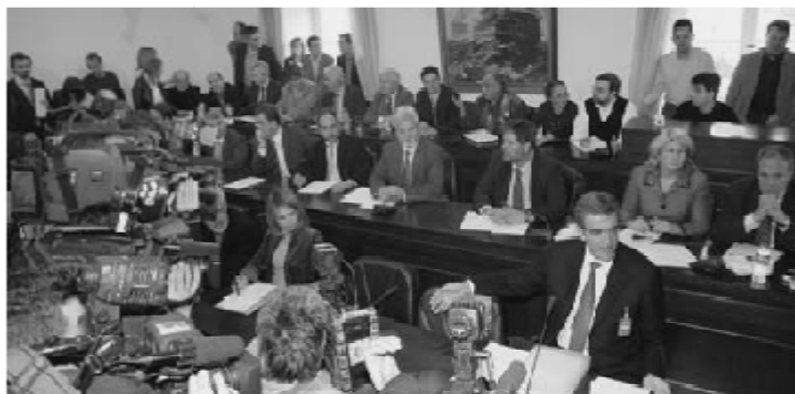
Εμπλοκή πολιτικών προσώπων στις υποκλοπές της Vodafone

Το σκάνδαλο τηλεφωνικών υποκλοπών 2004-05 της Vodafone χαρακτηρίζεται ως ένα από τα μεγαλύτερα σκάνδαλα των τελευταίων δεκαετιών στην Ελλάδα. Αφορούσε τηλεφωνικές υποκλοπές σε βάρος σημαντικών δημοσίων προσώπων, συμπαρασέρνοντας στο πέρασμά του τον πρωθυπουργό, προσωπικότητες του δημόσιου βίου, ελεγκτικές αρχές και «επώνυμες» επιχειρήσεις.