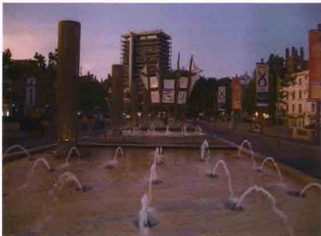
Εικόνα 4:Κεντρική πλατεία της πόλης του Bristol