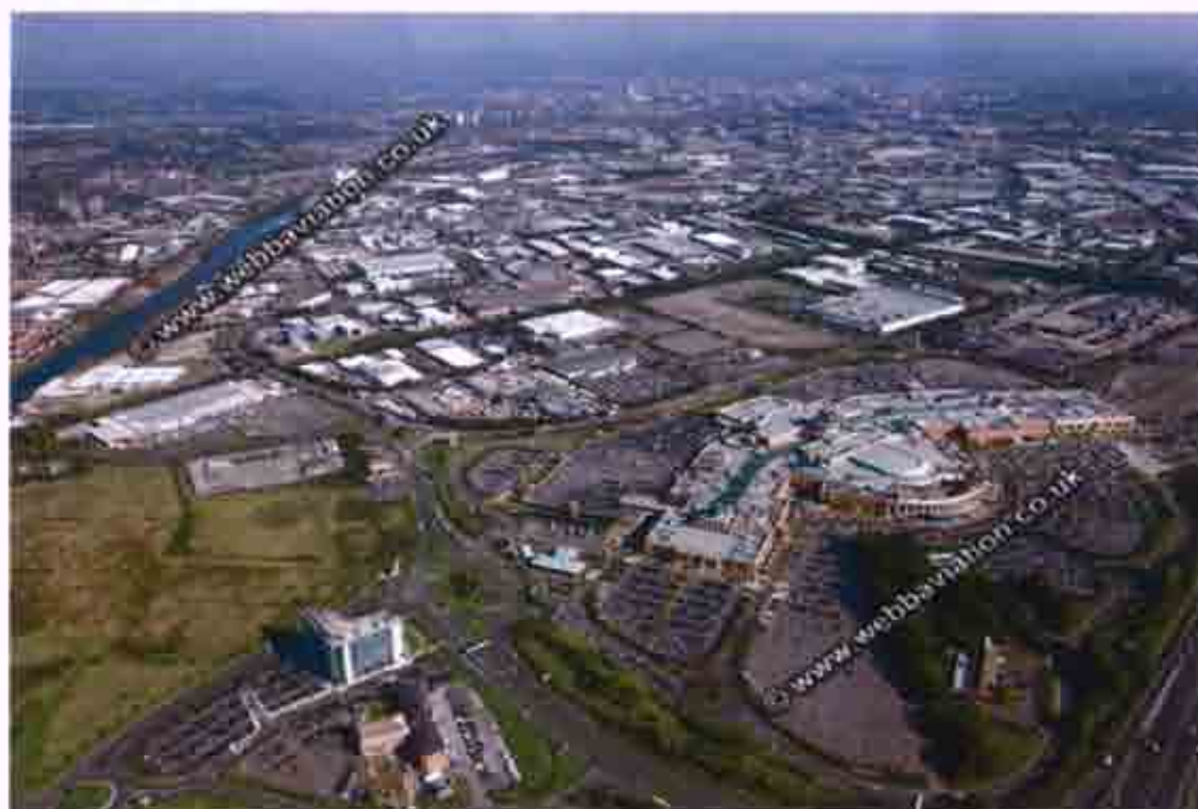
Εικόνα 5: Πανοραμική λήψη του Trafford Park

Η εταιρία που εδραιώθηκε το 1987 για την ανάπτυξη του Trafford Park διαφύλαξε την οικονομική και φυσική ανάπτυξη του πάρκου . Τα κύρια αντικείμενα αυτής της εταιρίας είναι να παρέχουν συμβουλές και καθοδήγηση σε θέματα ποιότητας , στην ανάπτυξη της επικοινωνίας και στο να ενθαρρύνουν εταιρίες να μοιράζονται πηγές και εμπειρίες και να παρέχουν συνδέσμους με υψηλότερα εκπαιδευτικά ιδρύματα .