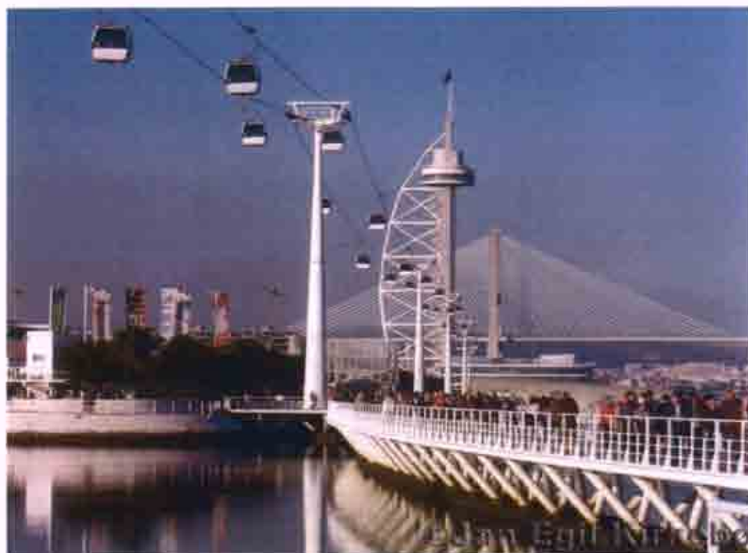
Εικόνα 1: Εθνικό πάρκο της Λισσαβόνας

Επιπτώσεις της EXPO της Λισσαβόνας: Η EXPO του 1998 άφησε πίσω μια μεγάλη κληρονομιά κτιρίων, εγκαταστάσεων και υποδομών. Στον οικονομικό τομέα η EXPO'98 παρήγαγε έναν μεγάλο αριθμό θέσεων εργασίας. Μεταξύ των ετών 1994 – 1996 το γεγονός δημιούργησε 18.000 θέσεις εργασίας, το 1997 19.000 και το 1998 μεταξύ 23.000 και 29.000. Όσον αφορά τον τουρισμό, η EXPO έχει προαγάγει την Πορτογαλία και τη Λισσαβόνα σε προορισμό τουριστών με μεγάλη επιτυχία. Γενικά, ο τουρισμός στην Πορτογαλία έχει αυξηθεί θεαματικά. Σαν επιχειρησιακός προορισμός η Λισσαβόνα φαίνεται επίσης να ωφελείται από την άνοδο της στη ταξινόμηση των πόλεων που διοργανώνουν συνέδρια. Η EXPO'98 έχει συμβάλλει επίσης σε μία ουσιαστικά βελτιωμένη εικόνα της Λισσαβόνας λόγω της ευρείας έκθεσης της πόλης στα διεθνή Μ. Μ. Ε. Χωρίς τη διοργάνωση αυτού του μεγάλου γεγονότος η άνοδος της θέσης της Λισσαβόνας θα ήταν πολύ δύσκολο επιτευχθεί.