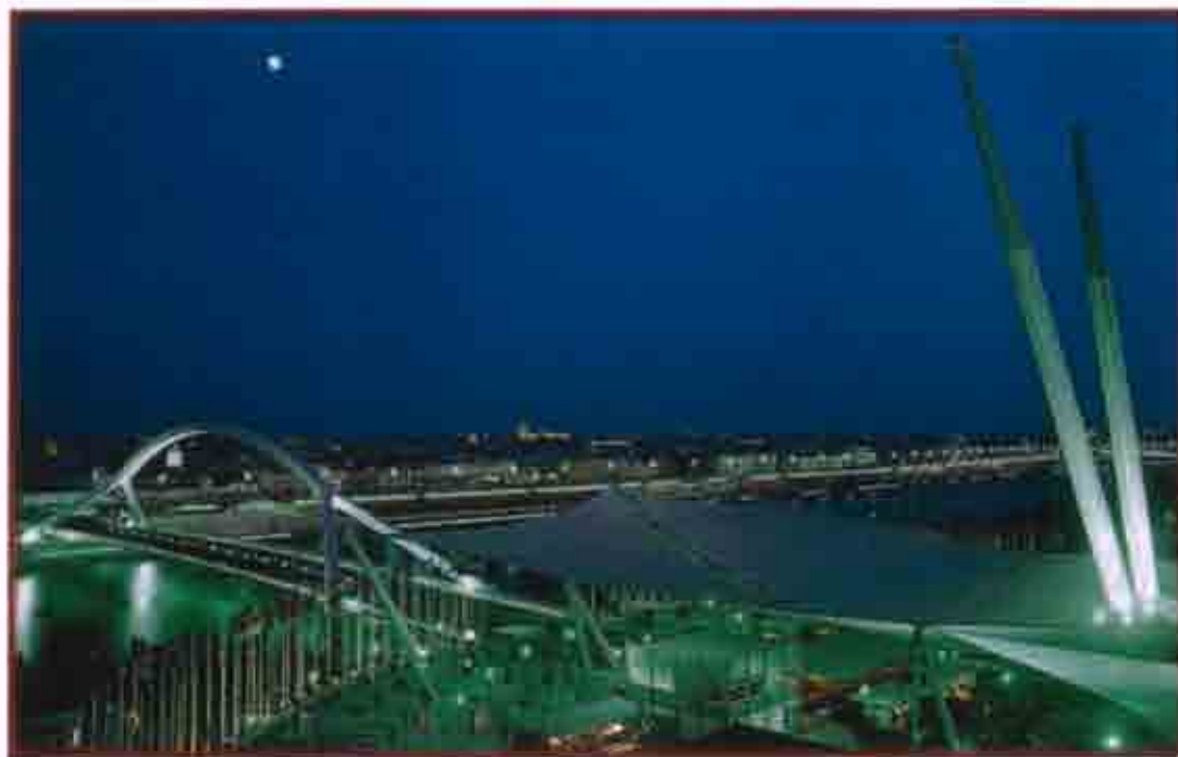
Εικόνα 2: Αναδημιουργία της πόλης της Σεβίλλης από την έκθεση EXPO του 1992