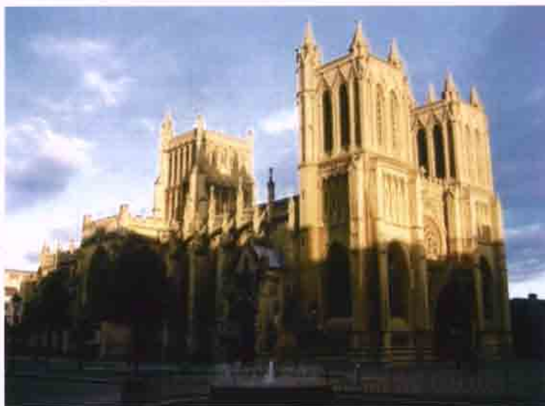
Εικόνα 3: Καθεδρικός Ναός της πόλης του Bristol

Η αστική περιοχή του Bristol έχει ένα μείγμα ανθρώπων και διαχέεται από συνδυασμούς διαφορετικών πολιτιστικών, κοινωνικών και οικονομικών δομών. Το αστικό πρόγραμμα του Bristol έχει βοηθήσει στην εφαρμογή πολλών πρωτοβουλιών και ενεργειών, από τις οποίες έχουν αναδυθεί τα εξής σημαντικά οφέλη: