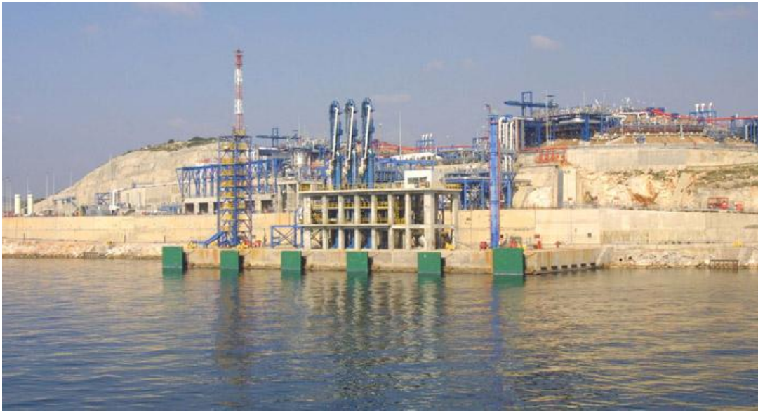
Ο σταθμός υγροποιημένου φυσικού αερίου στη Ρεβυθούσα