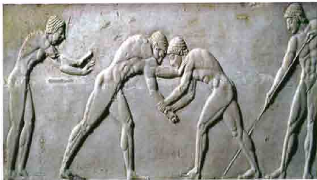
(Αρχαιολογικό Μουσείο Ολυμπίας)

Η Πέμπτη μέρα ήταν αφιερωμένη στη στέψη των νικητών και σε θυσίες προς τους Θεούς.