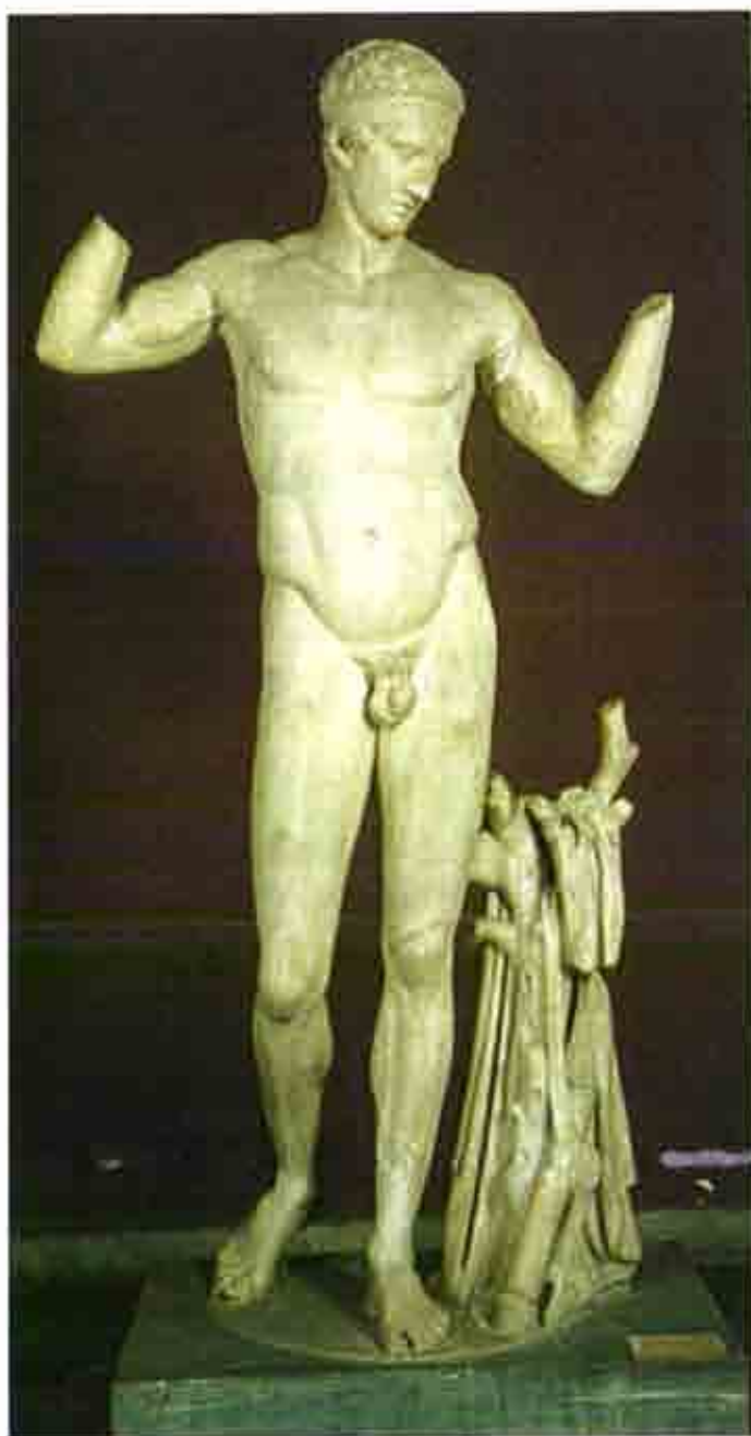
Νικητής αθλητής που δένει την ταινία στο κεφάλι του(Εθνικό αρχαιολογικό Μουσείο)