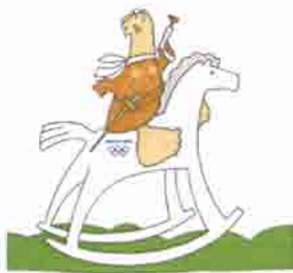
Μοντέρνο Πένταθλο Modern Pentathlon