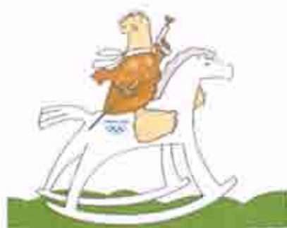
Μοντέρνο Πένταθλο Modern Pentathlon