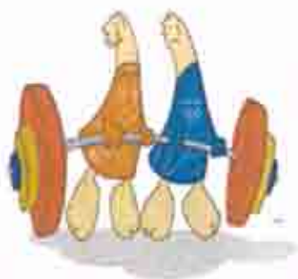
Άρση Βαρών Weightlifting