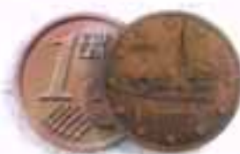
Αδελφική Τριήρης Εξελκυσμένος ποταμός των πρόβατων του Κίμωνος (Νησιωκό Μουσείο) An advanced model of an Albanian Trireme Dating from the times of Kimon (Maritime Museum)