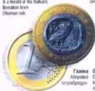
Γλάρος Αίθρητικό τετραόβριον Owl Design taken from an ancient Albanian 4-drachma coin