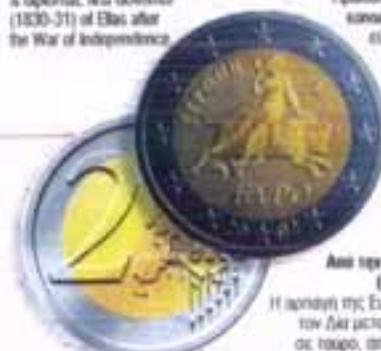
Από την αρχαία Ελλάδα (Μαθαλαγία) Η Αφροδίτη της Ευρώπης από τον Δελ μεταμορφώθηκε σε τρωάδα, από ψηφιδωτό της Σπάρτης A scene from Mythology Europa being abducted by Zeus in the shape of a bull (from a mosaic in Sparta)