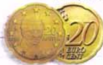
Ιωάννης Καποδίστριας (1776-1831) Κερσεύας, Έλληνας & Ευρωπαίος πολιτικός & διπλωμάτης, πρώτος συντακτικός αρχηγός του Ελληνικού κράτους Ioannis Capodistrias (1776-1831) A leading national & European politician & diplomat, first Governor (1830-31) of Ellican after the War of Independence