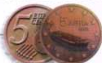
Αχιλλεύσιον Τανκέρ Ευρωπαϊκό εμπορικό πλοίο Tanker A modern ship