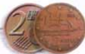
Κορβίνα - Καρίτζα Πλοίο της Επανάστασης του 1821 A Corvette A type of ship used during the Ellican War of Independence (1821)