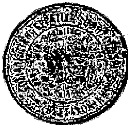
Εικόνα 2. ΣΦΡΑΓΙΔΑ ΤΗΣ ΦΕΝΤΕΡΑΣΙΟΝ

Οι νεότουρκοι γίνονται τώρα πανίσχυροι μα και οι εργάτες πιο απαιτητικοί. Μια σειρά από εργατικά νομοθετήματα ετοιμάζονται με σκοπό να βάλουν κάτω από τον κυβερνητικό έλεγχο τα συνδικάτα απαγορεύοντας τις απεργίες στους δημόσιους υπαλλήλους και στους εργαζόμενους των κοινωφελών υπηρεσιών. Η εργατική αντίδραση στη νομοθεσία παίρνει μεγάλες διαστάσεις. Διαδηλώσεις σημειώνονται σε όλες τις μεγάλες πόλεις της Αυτοκρατορίας. Το κέντρο όμως της αντίστασης είναι η Θεσσαλονίκη.