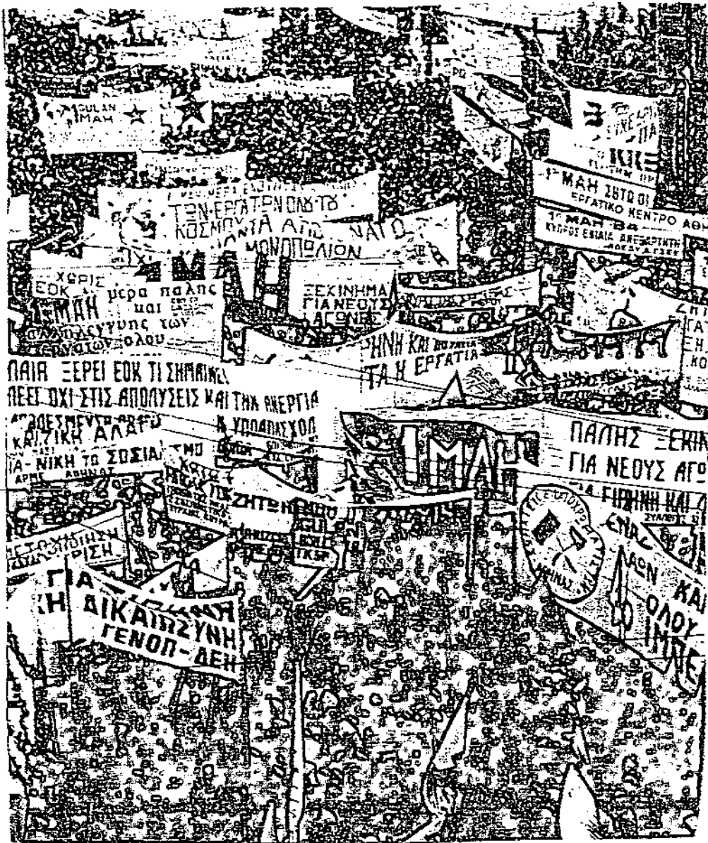
Πορεία εργαζομένων για την Εργατική Πρωτομαγία.

(Από το βιβλίο του Γ.Κουκουλέ "Ελληνικά Συνδικάτα: Οικονομική Αυτοδυναμία και εξάρτηση 1983-1984").