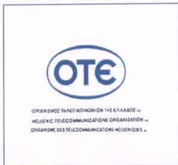
Εταιρία σταθερής τηλεφωνίας Ο.Τ.Ε.