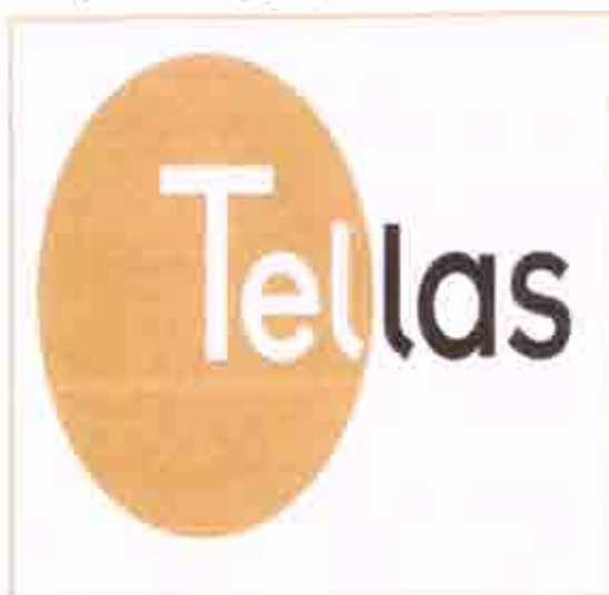
Εταιρία σταθερής τηλεφωνίας TELLAS