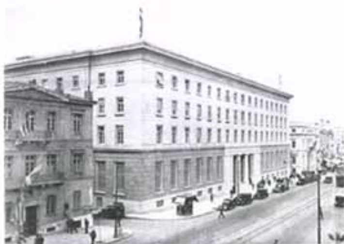
Το κτίριο της Τράπεζας της Ελλάδος στην οδό Πανεπιστημίου.

Η Τράπεζα της Ελλάδος ιδρύεται στις 14/05/1928, και η δραχμή εντάσσεται και πάλι στον κανόνα χρυσού-συναλλάγματος στο επίπεδο 1.000 γρμ. χρυσού ίσο με 51.212,87 δραχμές. Η σύνδεση της δραχμής με τον χρυσό έγινε μέσω της Αγγλικής λίρας με ισοτιμία : 1 λίρα Αγγλίας = 375 δραχμές.