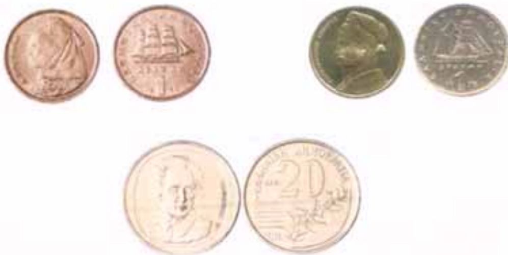
Μπουμπουλίνα, Κανάρης και Φεραίος, ήρωες του 1821 στα μονόδραχμα της μεταπολίτευσης.

Το 1986 εκδίδονται νέα χάλκινα κέρματα της 1 και 2 δραχμών με τις απεικονίσεις της Μπουμπουλίνας και της Μαντώ Μαυρογένους αντιστοίχως. Το 1990 εκδίδεται για πρώτη φορά κέρμα 100 δραχμών με την κεφαλή του Μεγάλου Αλεξάνδρου σε συνδυασμό με το αστέρι της Βεργίνας ενώ παράλληλα αντικαθίσταται και το κέρμα των 20 δραχμών με την κεφαλή του Περικλέους με νέο μικρότερο, με την κεφαλή του Σολωμού.