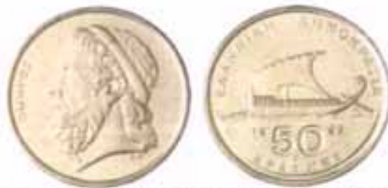
Ένα νόμισμα με βραβείο το πενητάριο του 1986.

Το 1986 εκδίδεται κέρμα των 50 δραχμών με την κεφαλή του Ομήρου στη μία όψη και αργαίο σκάφος των ομηρικών χρόνων στην άλλη. Το νόμισμα αυτό παίρνει το πρώτο βραβείο ως το καλύτερο στον κόσμο σε παγκόσμιο διαγωνισμό που έλαβε χώρα στην Αμερική το 1988.