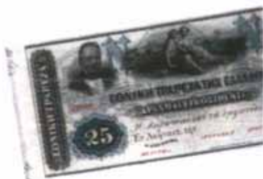
Χαρτονόμισμα των 25 δραχμών του 1867 με την επισήμανση 'Νέον', σύμβολο της Νομισματικής Λατινικής Ένωσης. Το μέσο μεροκάματο της εποχής ήταν 2-3 δραχμές και με το χαρτονόμισμα αυτό μπορούσες να αποκτήσεις ένα αξιοπρεπές μουλάρι ή πέντε αρνιά.

Οι επόμενες εκδόσεις είναι σημαντικές καθώς τα χαρτονομίσματα έχουν πια τυπωμένη και την πίσω τους πλευρά και φέρουν τη σήμανση "N" δίπλα στην αριθμητική αναγραφή της ονομαστικής τους αξίας. Πρόκειται για τις 'νέες δραχμές της Λατινικής Ένωσης.