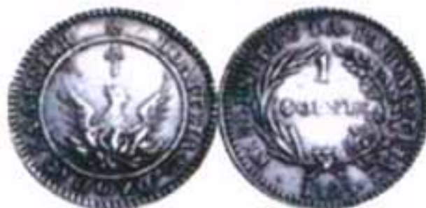
Ο φοίνικας, το πρώτο νόμισμα των Ελλήνων

Στη Δ' Εθνική συνέλευση που έγινε τον Ιούλιο του 1828 στο Άργος ο Καποδίστριας υπέβαλε το σχέδιο προς έγκριση για την δημιουργία Εθνικού νομίσματος.