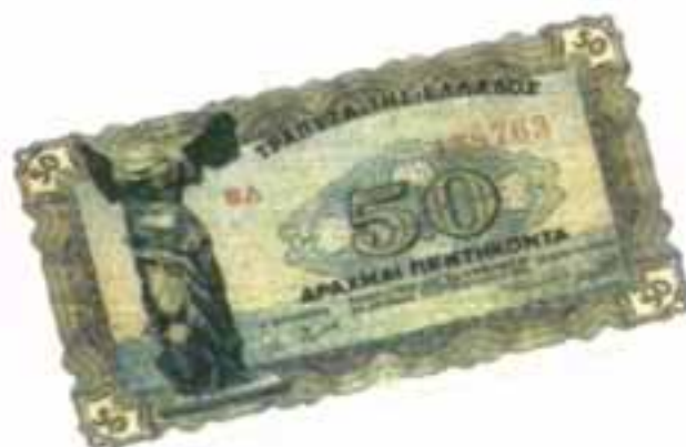
Το πρώτο ελληνικό χαρτονόμισμα μετά την κατοχή, των 50 δραχμών. Στην μπροστινή του όψη απεικονίζει την Νίκη της Σαμοθράκης.

Η συνολική ζημιά της περιόδου της Κατοχής για την ελληνική οικονομία έχει υπολογιστεί σε 549 εκατομμύρια δολάρια, εώς τις αρχές του Οκτωβρίου του 1944. Η προσπάθεια οικονομικής ανασυγκρότησης μετά την απελευθέρωση καθυστέρησε λόγω του εμφύλιου πολέμου που ακολούθησε. Ο μεγάλος όγκος κατοχικού χαρτονομίσματος αχρηστέυτηκε μεταπολεμικά με την έλδοση νέων τραπεζογραμμάτων. Αλλεπάλληλες προσπάθειες για οικονομική σταθερότητα πραγματοποιήθηκαν μετά την σύσταση και λειτουργία της Νομισματικής Επιτροπής και με τις Η.Π.Α. να καταλαμβάνουν θέση επιρροής μέσω του σχεδίου Marschal.