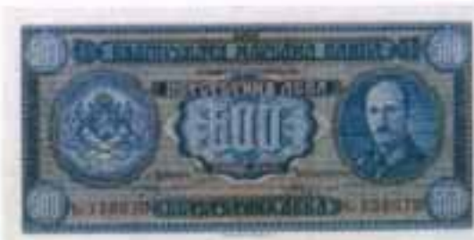
Τα βουλγάρικα λέβα

Το φαινόμενο του υπερπληθωρισμού εμφανίζεται στην Ελλάδα το Νοέμβριο του 1943, όταν σημειώθηκε απότομη αύξηση της ταχύτητας κυκλοφορίας του χρήματος, οφειλόμενη στην άνοδο των προσδοκίων για μελλοντικό πληθωρισμό. Το μήνα αυτό όταν η δραχμή είχε χάσει παντελώς την αγοραστική της αξία, και το μεγαλύτερο μέρος των συναλλαγών διεξαγόταν με αντιπραγματισμό , οι αρχές κατοχής άρχισαν να διωχετεύουν στην χρηματαγορά της Αθήνας χρυσές λίρες Αγγλίας και χρυσά Γαλλικά εικοσόφραγκα. Παράλληλα, όμως, η ταχύτητα κυκλοφορίας του χρήματος σημείωσε δραματική αύξηση, φαινόμενο που εμφανίζεται σε όλους τους υπερπληθωρισμούς καθώς το κοινό δεν είχε καμία εμπιστοσύνη της δραχμής, στάθηκε μαζικά στον αποθησαυρισμό χρυσών λιρών υποκαθιστώντας έτσι τα χαρτονομίσματα. Ο χρυσός αποτέλεσε το κύριο μέσο συναλλαγών και διαφύλαξης πλούτου, όχι μόνο κατά την κατοχική περίοδο αλλά και στην πρώτη μεταπολεμική περίοδο. Κατά τον τελευταίο χρόνο της κατοχής, το δημοσιονομικό και νομισματικό σύστημα της χώρας κατέρρευσε εντελώς.