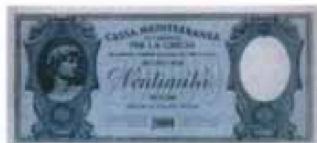
Οι ιταλικές μεσογειακές δραχμές