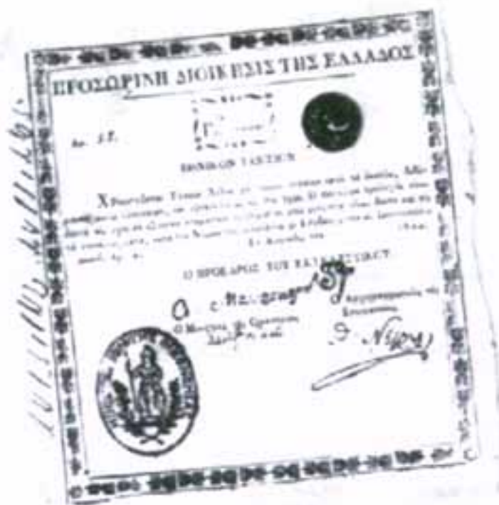
Το πρώτο ελληνικό ομόλογο. Αποτελεί τον πρόδρομο των μετέπειτα ελληνικών χαρτονομισμάτων. Σαν κάλυμμα τους είχαν τις τουρκικές περιουσίες.

Η τύχη της Ελληνικής επανάστασης θα πάρει ευνοϊκή τροπή όταν το 1827 με την συνθήκη του Λονδίνου οι τρεις ευρωπαϊκές Δυνάμεις-Αγγλία, Γαλλία και Ρωσία- θα δούν θετικά την προσπάθεια της επαναστατημένης Ελλάδας. Η ναυμαχία του Ναυαρίνου θα είναι το φυσικό επακόλουθο της.