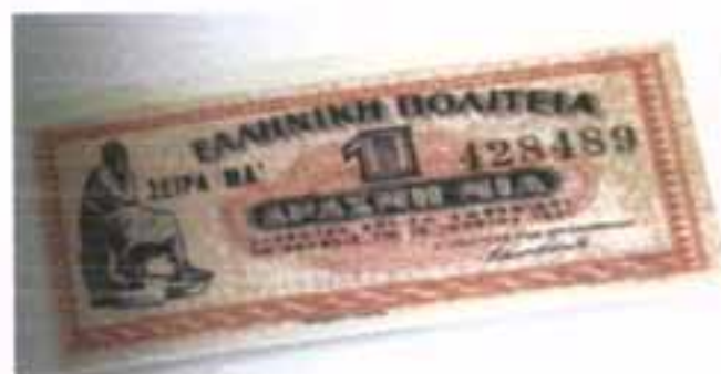
Κρατικό χαρτονόμισμα της 1 δραχμής που κυκλοφόρησε το 1941. Επάνω δεν αναγράφεται η τιμή αλλά το πολίτευμα της χώρας.

Η έναρξη των πολεμικών γεγονότων στην Ευρώπη το 1939 δημιούργησε ανησυχία στην ελληνική αγορά. Στις 28 Οκτωβρίου του 1940, με την επίθεση της Ιταλίας ο Β' Παγκόσμιος Πόλεμος θα αρχίσει και για την Ελλάδα. Μπροστά σε ένα δεύτερο κύμα πανικού και αναλήψεων τραπεζικών καταθέσεων, η Τράπεζα της Ελλάδος αναγκάστηκε αυτή τη φορά να δεσμεύσει προσωρινά τις τραπεζικές καταθέσεις.