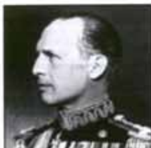
Ο Γεώργιος Β'. Ο τρίτος βασιλιάς της οικογένειας Γλόμπουργκ

Βασιλιάς της Ελλάδας, γιος του βασιλιά Κωνσταντίνου, εγγονός του Γεωργίου του Α'. Ανέβηκε στο θρόνο το 1922, ύστερα από την παραίτηση του πατέρα του, μετά την επανάσταση του Σεπτεμβρίου του 1922. Το 1923 υποχρεώθηκε να αποχωρήσει στο εξωτερικό, με υπόδειξη της επαναστατικής κυβέρνησης. Γύρισε στην Ελλάδα μετά το δημοψήφισμα της 3ης Νοεμβρίου 1935. Στις 4 Αυγούστου 1936 υπέγραψε το διάταγμα κήρυξης δικτατορίας από τον Ιωάννη Μεταξά. Το Μάιο του 1941 έφυγε στο εξωτερικό, μετά την κατάληψη της Κρήτης από τους Γερμανούς. Ξαναγύρισε την 1η Σεπτεμβρίου του 1946, ύστερα από δημοψήφισμα, και πέθανε από συγκοπή καρδιάς την 1η Απριλίου του 1947 στην Αθήνα.