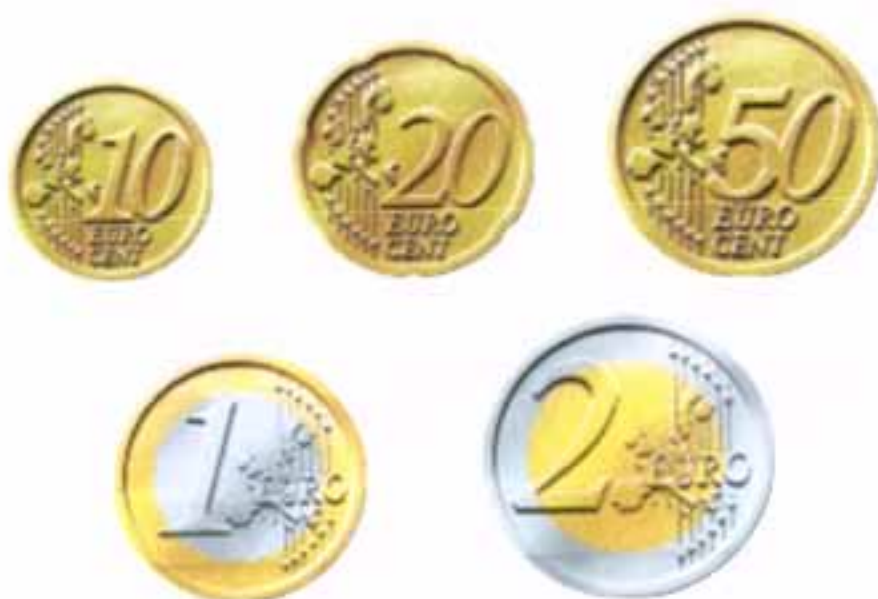
Οι κοινές όψεις των νομισμάτων της Ευρωπαϊκής Νομισματικής Ένωσης