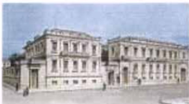
Το κτίριο της Εθνικής Τράπεζας στην οδό Αιόλου.

Το νομισματικό σύστημα σταδιακά επεκτάθηκε, και το 1841, μετά από πολυετείς προσπάθειες, ιδρύθηκε η Εθνική Τράπεζα της Ελλάδος με κεφάλαιο 5.000.000 δραχμών και παραχώρηση προνομίου για την έκδοση τραπεζικών γραμματίων στον κομιστή. Πρώτος Διευθυντής διορίστηκε ο Γ. Σταύρου και η Εθνική Τράπεζα της Ελλάδος άρχισε τις εργασίες της τον Ιανουάριο του 1842 προικοδοτημένη με κεφάλαιο 3.402.000 δραχμών.