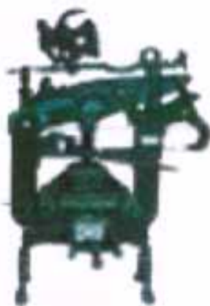
Η τυπογραφική μηχανή που τύπωσε τους πρώτους χάρτινους φοίνικες.

Οι προστάτιδες δυνάμεις της Ελλάδας επιλέγουν για βασιλιά της Ελλάδας τον βαυαρό πρίγκιπα Όθωνα, ο οποίος φτάνει στην χώρα μαζί με τους συμβούλους του τον Ιανουάριο του 1833.