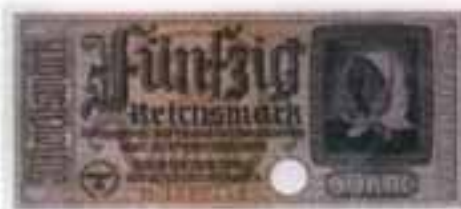
Τα γερμανικά κατοχικά μάρκα

μικρότερη από την αξία για τις δυνάμεις κατοχής, αφού οι τελευταίοι είχαν το αποκλειστικό δικαίωμα αγοράς όλου του εθνικού προϊόντος στον τόπο παραγωγής του, σε τιμές που οι ίδιες καθόριζαν σε εξαιρετικά χαμηλά επίπεδα. Μέσα σε ένα χρόνο, το 1941, η νομισματική κυκλοφορία αυξήθηκε κατά 117%, ο δείκτης κόστους ζωής κατά 252% και η τιμή της χρυσής λίρας Αγγλίας κατά 299%.