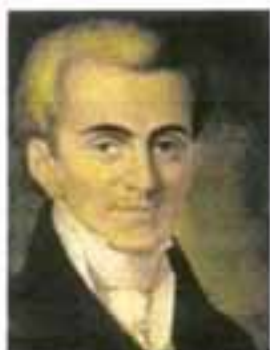
Ο Ιωάννης Καποδίστριας

Στις 3 Απριλίου 1827 θα εκλεγθεί από τη Γ' Εθνική Συνέλευση ο Ιωάννης Καποδίστριας ως προσωρινός κυβερνήτης του νέου Ελληνικού Κράτους. Με την άφιξή του στην Ελλάδα τον Ιανουάριο του 1828, ο Καποδίστριας προσπάθησε να δημιουργήσει κράτος αλλά και να συνεχίσει τον αγώνα, αφού η Οθωμανική Αυτοκρατορία εξακολουθούσε τις πολεμικές επιχειρήσεις μέσα σε εδάφη που, σύμφωνα με τις συνθήκες, άνηκαν πια στην Ελλάδα.