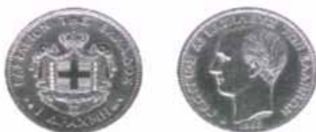
Νόμισμα 1 δραχμής του 1873. Στη μία του όψη ο βασιλικός θυρέος με την επιγραφή 'ΒΑΣΙΛΕΙΟΝ ΤΗΣ ΕΛΛΑΔΟΣ' ενώ στην άλλη η προτομή του Γεωργίου σε νεαρή ηλικία.

προσπάθεια εκείνης της εποχής για νομισματική ενοποίηση μεταξύ των ευρωπαϊκών χωρών. Το σύστημα αυτό βασιζόταν στον διμεταλλισμό, δηλαδή είχε βάση την ισοτιμία του χρυσού και του αργύρου που ορίστηκε σε 15,5 προς 1. Έτσι η Ελλάδα αναγκάστηκε να αυξήσει την περιεκτικότητα της δραχμής σε χρυσό κατά 0,29 γραμ. Τα Ευρωπαϊκά νομίσματα των χωρών που συμμετείχαν στην Νομισματική Λατινική Ένωση, είχαν τυπωμένη στην πίσω πλευρά τους την ονομαστική τους αξία σε φράγκα.