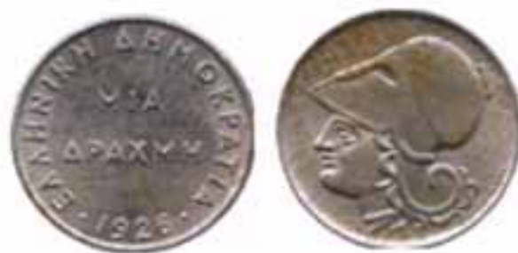
Νόμισμα της 1 δραχμής του 1926 όπου στην μία όψη απεικονίζεται η Αθηνά με περικεφαλαία.

Οι καλλιτέχνες που φιλοτέχνησαν τα νομίσματα αυτά ήταν οι Percy Metcalfe, Langford Jones, Kruger Gray και Μιχαήλ Αξελό.