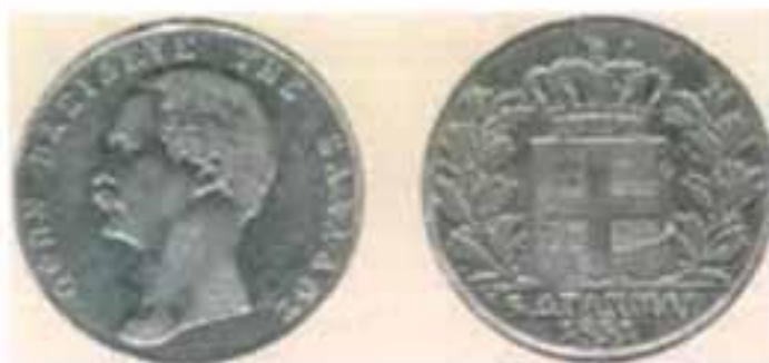
Νόμισμα των 5 δραχμών του 1851, με την προτομή του Όθωνα σε μεγάλη ηλικία.

Ο Όθωνας έφυγε από την Ελλάδα όταν ξέσπασε η αντιοθωνική επανάσταση, τον Οκτώβριο του 1862. Έζησε τα τελευταία χρόνια της ζωής του στη Βαυαρία. Πέθανε σε ηλικία 52 ετών, στις 14 Ιουλίου 1867, και ενταφιάστηκε στο Μόναχο, φορώντας, όπως ο ίδιος είχε ζητήσει, την παραδοσιακή ελληνική φουστανέλλα.