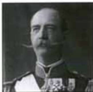
Ο βασιλιάς Γουλιέλμος Γεώργιος Γκλύξμπουργκ, ή πιο απλά Γεώργιος ο Α'. Είναι ο πρώτος εκ των Γκλύξμπουργκ, οικογένειας βασιλιάδων εγκατεστημένων στην Ελλάδα μέχρι και την μεταπολίτευση.

Το 1864, ένα έτος μετά την διαδοχή του, η Εθνοσυνέλευση αποφάσισε την ψήφιση νέου Συντάγματος. Η εξασφάλιση άμεσης, μυστικής και καθολικής ψηφοφορίας για την ανάδειξη της Βουλής καθιστούσε την Ελλάδα, τυπικά, ένα εκ των δημοκρατικότερων κρατών της Ευρώπης. Υπήρχαν όμως δυσκολίες όσον αφορά την επίτευξη σταθερότητας. Από το 1864 έως το 1911 προέκυψαν 70 κυβερνήσεις κατόπιν 21 εκλογικών αναμετρήσεων.