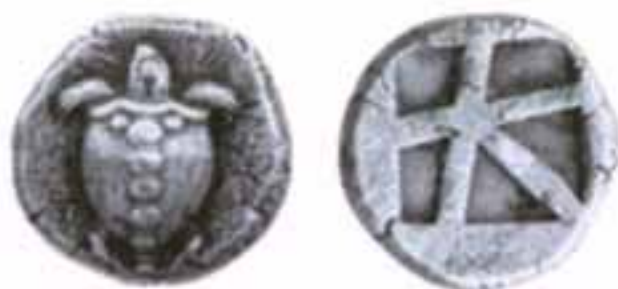
Οι χελώνες, τα πρώτα ελληνικά νομίσματα που κόβονται στον ελλαδικό χώρο

Με την κατάλυση του ρωμαϊκού κράτους, ο χρυσός εξαφανίστηκε από την Δυτική Ευρώπη. Χρυσά νομίσματα άρχισαν να κυκλοφορούν και πάλι μόλις από τον 13 ο αιώνα μ.χ., όταν εξήχθησαν από το Βυζάντιο, την εποχή των Σταυροφοριών. Στα μέσα του 14 ου αιώνα, είχε εκχωρηθεί από τους αυτοκράτορες σε όλους τους ηγεμόνες το δικαίωμα κοπής χρύσων νομισμάτων.