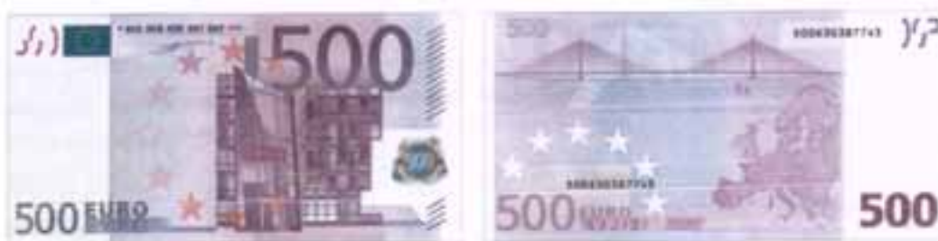
Μοντέρνα αρχιτεκτονική του 20 ου αιώνα