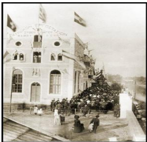
Εικόνα: από τα εγκαίνια ζυθοποιείου 1909

Διέκοψε την λειτουργία του το 1980. Από τα ιστορικά κτίρια ΜΑΜΟΣ Α.Ε που ανήκουν σε ιδιώτη έχει απομείνει το κεντρικό τετραώροφο μαζί με μερικά γειτονικά ισόγεια βοηθητικά και δύο υψικαμίνους κηρυγμένα διατηρητέα από το ΥΠΠΟ εξαιρετικά δείγματα βιομηχανικής αρχιτεκτονικής της δεκαετίας του 20ου αιώνα, που χρήζουν ανακαίνισης και αξιοποίησης μαζί τον περιβάλλοντα ελεύθερο διαθέσιμο χώρο.