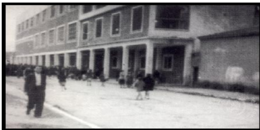
Εικόνα: Εργάτες προσέρχονται στο εργοστάσιο υφαντουργίας Β. Μαραγκόπουλου, στη νέα πτέρυγα, επί της οδού Κορίνθου, 1935