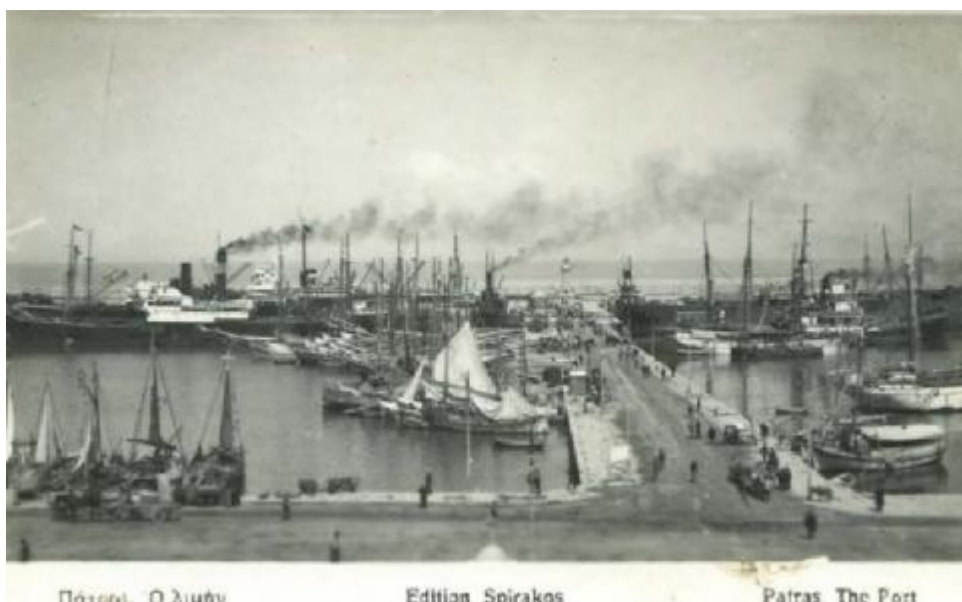
Εικόνα: Ο μόλος της Αγ. Νικολάου

Η Αχαΐα κατά το 19 ο αιώνα αποτέλεσε το μεγαλύτερο εμπορικό κέντρο της Πελοποννήσου. Ο προσανατολισμός της οικονομικής περιοχής ήταν εξωστρεφής. Το μεγαλύτερο ποσοστό των εμπορικών συναλλαγών με τις διάφορες Μεσογειακές χώρες γινόταν από το λιμάνι της Πάτρας.