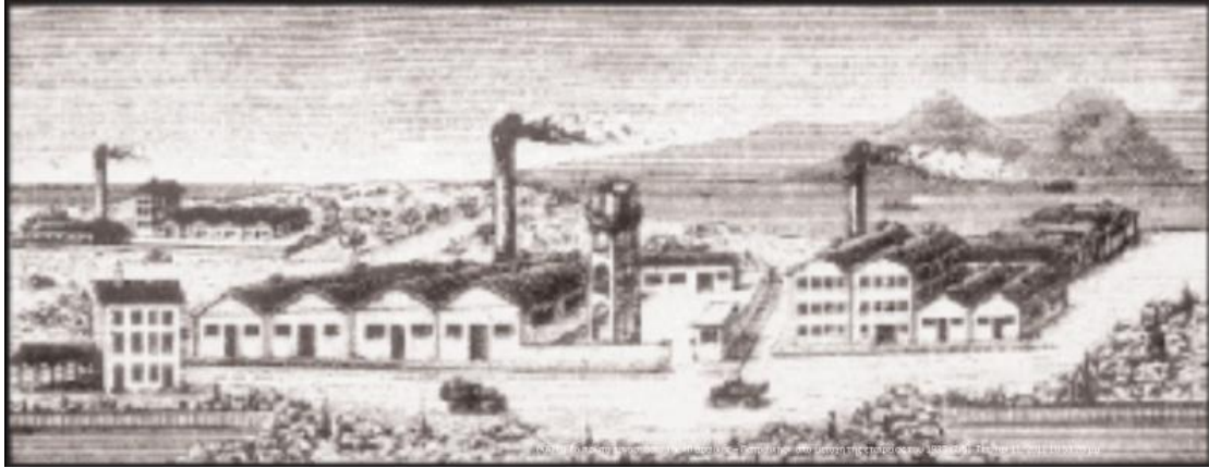
Εικόνα: Το πρώτο εργοστάσιο της "Πειραιϊκής – Πατραϊκής" από μετοχή της εταιρείας του 1933