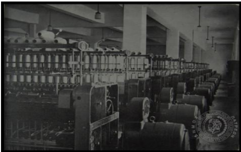
Εικόνα: Εργοστάσιο υφαντουργίας Β. Μαραγκόπουλου. Το εσωτερικό τού εργοστασίου, 1938

Το κλωστοϋφαντουργείο «Β. Μαραγκόπουλος» δημιουργήθηκε από τον Βασίλειο Μαραγκόπουλο, που ίδρυσε την πρώτη του βιοτεχνία το 1920.