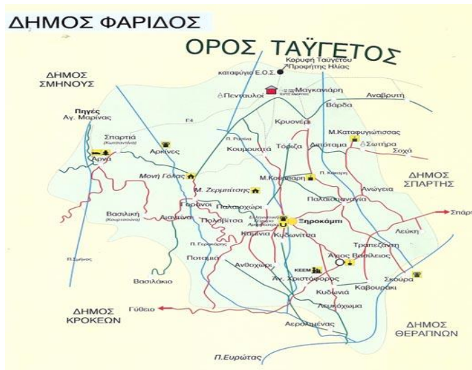
Εικόνα 4: Δήμος Φάριδος