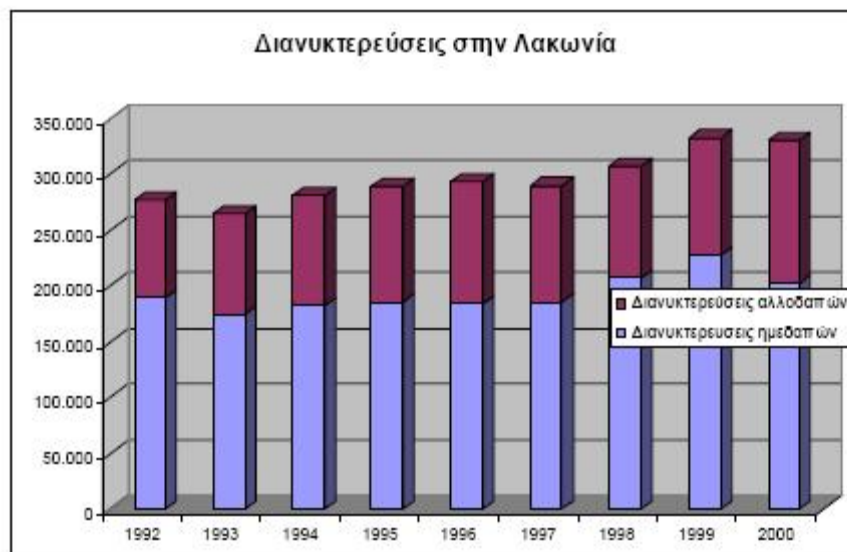
ΓΡΑΦΗΜΑ 2 ΔΙΑΝΥΚΤΕΡΕΥΣΕΙΣ ΣΤΗΝ ΛΑΚΩΝΙΑ

Είναι γεγονός και κοινή πεποίθηση πλέον ότι ο αγροτικός χώρος δεν μπορεί να στηριχθεί αποκλειστικά στη γεωργική παραγωγή. Στόχος του προγράμματος δεν είναι η περαιτέρω αστικοποίηση και η εγκατάλειψη της Λακωνικής υπαίθρου. Για το λόγο αυτό στο πλαίσιο αναζήτησης εναλλακτικών αναπτυξιακών προτάσεων θα πρέπει να βρεθούν τρόποι που θα συνδυάζουν τη γεωργική παραγωγή με άλλες πιθανές πηγές εισοδημάτων. Ο Ευρώτας με την ιστορία του, αλλά και την πλούσια περιβαλλοντική του αξία θα πρέπει να αναδειχθεί ως ένα σημαντικό συγκριτικό πλεονέκτημα της περιοχής για την ανάπτυξη ενός άλλου μοντέλου τουρισμού.