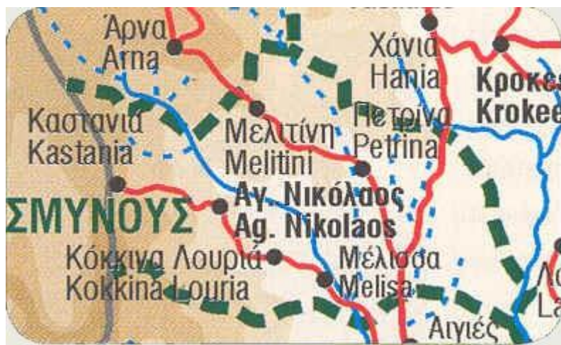
Εικόνα 3: Δήμος Σμύνης