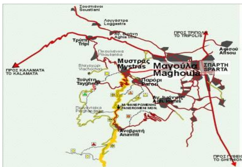
Εικόνα 1 : Δήμος Μυστρά