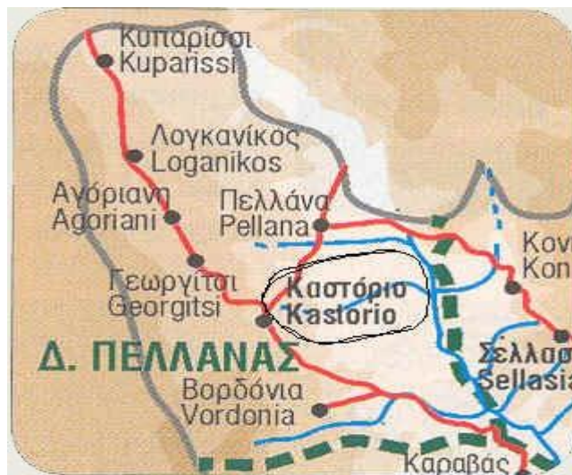
Εικόνα 2: Δήμος Πελλάνας

Η Πελλάνα ιδρύθηκε τον 7ο π.Χ. αιώνα ενώ αναφέρεται στα κείμενα πολλών ιστορικών της αρχαιότητας όπως τον Ξενοφώντα, τον Πλούταρχο και τον Πausανία. Στον αρχαιολογικό χώρο έχουν βρεθεί 6 θολωτοί, λαξευτοί σε βράχο τάφοι και άρα προμυκηναϊκής εποχής. Ο ένας από αυτούς είναι ο δεύτερος σε μέγεθος μετά του Αγαμέμνονα στις Μυκήνες και είναι σίγουρα βασιλικός, κατά πάσα πιθανότητα του Μενελάου ή του Τυνδάρεω. Εικάζεται ότι στον ευρύτερο χώρο υπάρχουν τα ανάκτορα ενός εκ των παραπάνω. Στη θέση Παλαιόκαστρο τα αρχαιολογικά ευρήματα μαρτυρούν την ύπαρξη Ακρόπολης. Ο αρχαιολόγος κ. Σπυρόπουλος, υπεύθυνος ανασκαφών στην Πελλάνα, υποστηρίζει ότι οι αρχαιότητες που παραμένουν κρυμμένες στο χώρο είναι εφάμιλλης αξίας με εκείνες της Βεργίνας.