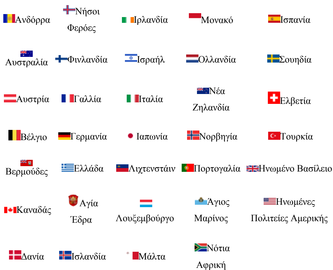
Πίνακας 2.3 Η Λίστα της CIA