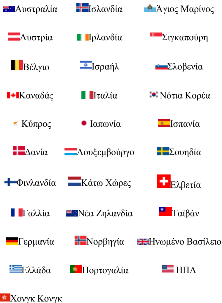
Πίνακας 2.5 –Λίστα CIA

Πηγή: CIA.,2010, World Fact book International Organizations and Groups, Ανάκτηση στις 4-2-2012 από https://www.cia.gov/library/publications/the-world-factbook/appendix/appendix-b.html