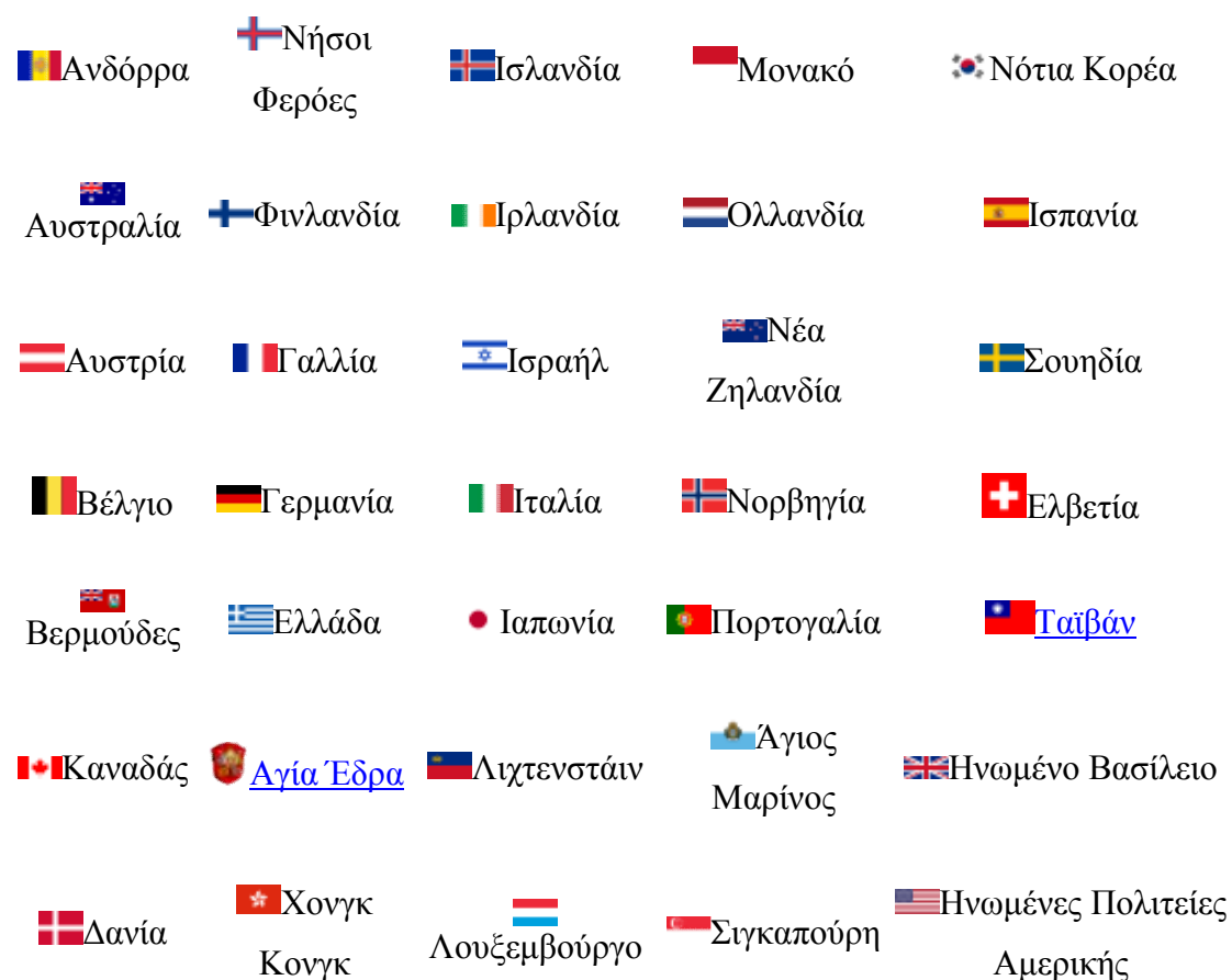
Πίνακας 2.4 Η Λίστα της CIA