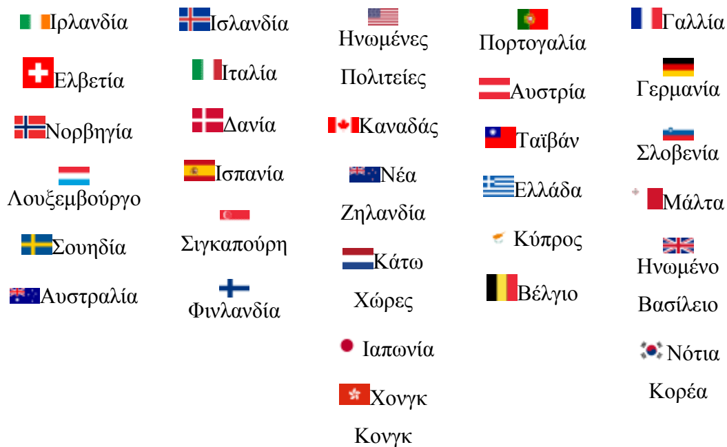
Πίνακας 2.5 – Λίστα χωρών με την καλύτερη ποιότητα ζωής