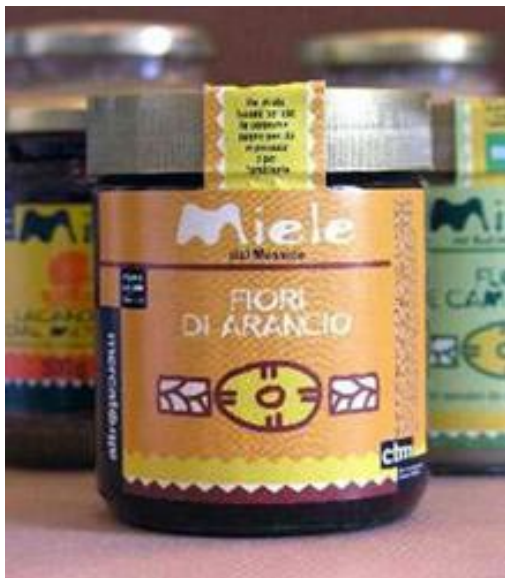
Μέλι από άνθη πορτοκαλιού από το Μεξικό

Παράγεται με ένα νομαδικό σύστημα μελισσοκομίας από μικρούς μελισσοκόμους του συνεταιρισμού Miel bajo Volcan, σε ορεινά χωριά κοντά στο Morelos. Το μέλι αυτό είναι από άνθη πορτοκαλιού και διατηρεί όλες τις ευεργετικές ιδιότητες γιατί δεν επεξεργάζεται χημικά.