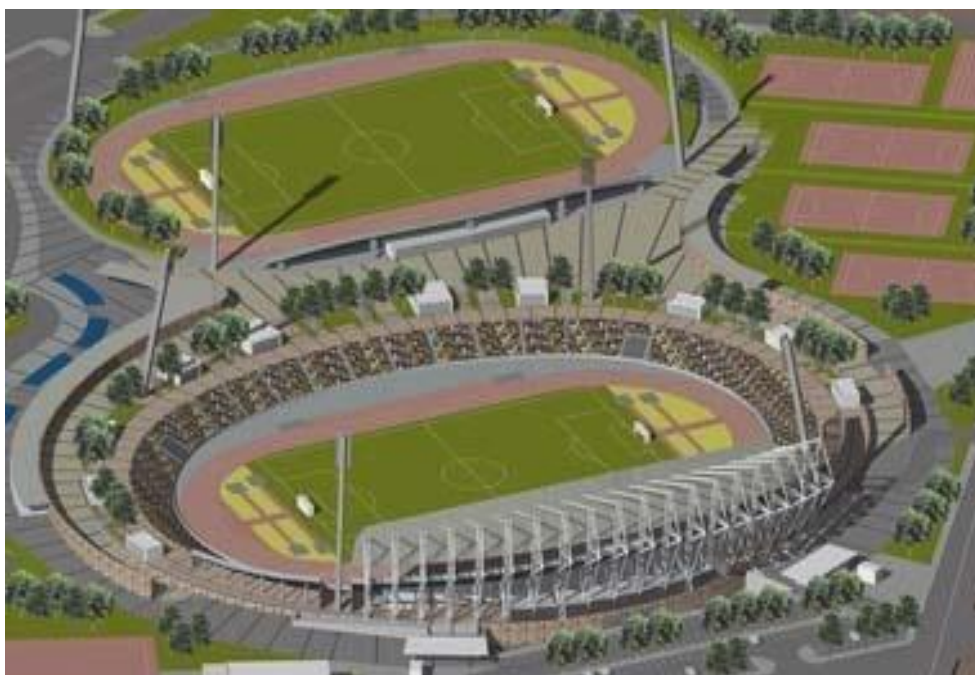
ΑΠΟΨΗ ΤΟΥ ΣΤΑΔΙΟΥ ΑΠΟ ΨΗΛΑ

Τα έργα που έγιναν κατά την ανακαίνισή του περιέλαβαν : επέκταση της δυτικής εξέδρας, νέες ηλεκτρομηχανολογικές εγκαταστάσεις, σκέπαστρα πάνω από τη δυτική πλευρά του σταδίου, πλαστικά καθίσματα και ηλεκτρονικούς πίνακες, αναμόρφωση όλων των χώρων κάτω από τις κερκίδες, αλλαγή του ηλεκτροφωτισμού, κλειστό κύκλωμα τηλεόρασης κ.λπ. Αξίζει να σημειωθεί ότι η ανακατασκευή του επιτρέπει τη μελλοντική ανέγερση επέκτασης των εξεδρών και από την ανατολική πλευρά, όμοια με τη δυτική που κατασκευάστηκε για το 2004. Αν γίνει στο μέλλον κάτι τέτοιο, η χωρητικότητα του Παμπελοποννησιακού θα αυξηθεί κατά 6.500 θέσεις επιπλέον, μεταμορφώνοντας το πραγματικά σε ένα στάδιο-στολίδι. Η διαφορά με το παραμελημένο οικοδόμημα που υπήρχε στη θέση του ως τα μέσα του 2002 ( με χωρητικότητα 18.000 θεατών χωρίς καθίσματα ) θα είναι τότε τεράστια.