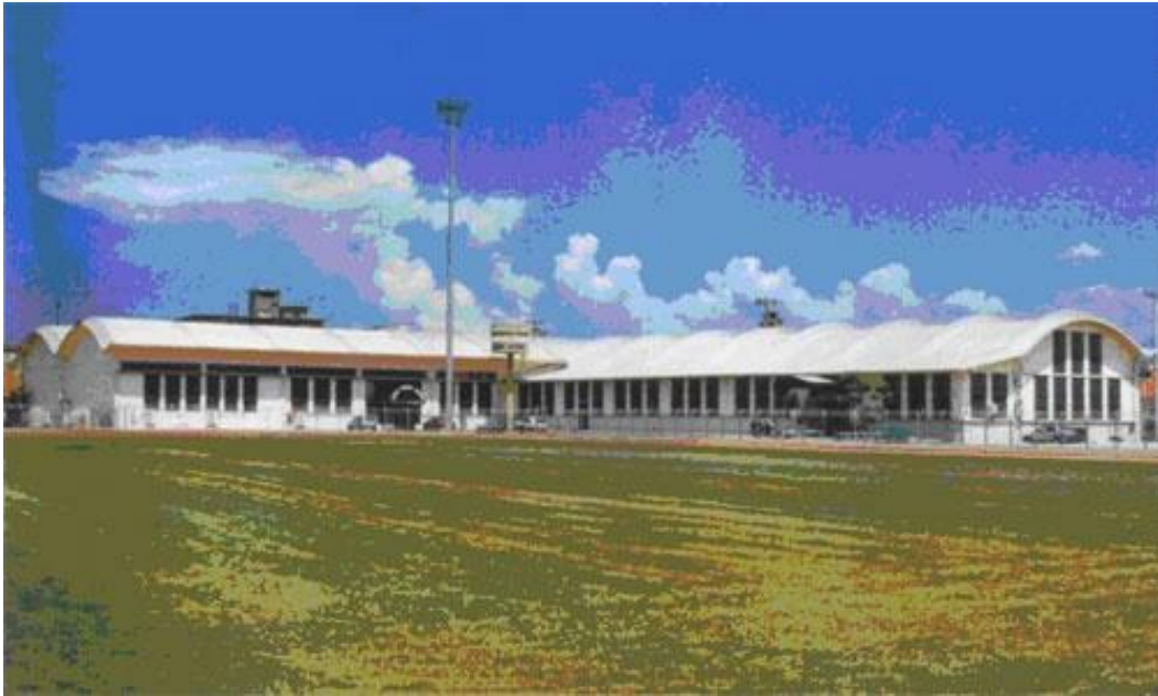
ΕΞΩΤΕΡΙΚΗ ΑΠΟΨΗ ΤΟΥ ΣΤΑΔΙΟΥ