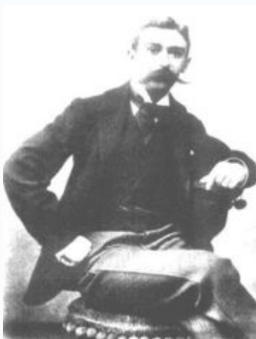
Ο βαρόνος Πιέρ ντε Κουμπερτέν

Ο Κουμπερτέν ήθελε επίσης να ενώσει της εθνότητες και να φέρει μαζί την νεολαία με τον αθλητισμό παρά να γίνονται πόλεμοι. Πίστευε ότι η αναβίωση των Ολυμπιακών Αγώνων θα πετύχαινε και τους δύο πιο πάνω σκοπούς του.