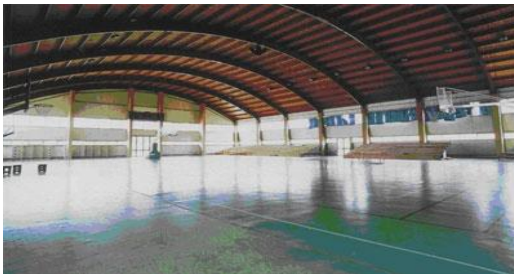
ΕΣΩΤΕΡΙΚΗ ΑΠΟΨΗ ΤΟΥ ΚΛΕΙΣΤΟΥ ΓΥΜΝΑΣΤΗΡΙΟΥ

Πανελλήνια/διεθνή πρωταθλήματα: ως μέλος της Επιτροπής Αθλητισμού Τριτοβάθμιας Εκπαίδευσης, το γυμναστήριο συμμετέχει με αντιπροσωπευτικές ομάδες στο σύνολο των Πανελληνίων Φοιτητικών πρωταθλημάτων που υλοποιεί το Υπουργείο Παιδείας με στόχο την ανάδειξη πρωταθλητών που θα αγωνιστούν σε Πανευρωπαϊκά ή διεθνή φοιτητικά πρωταθλήματα.