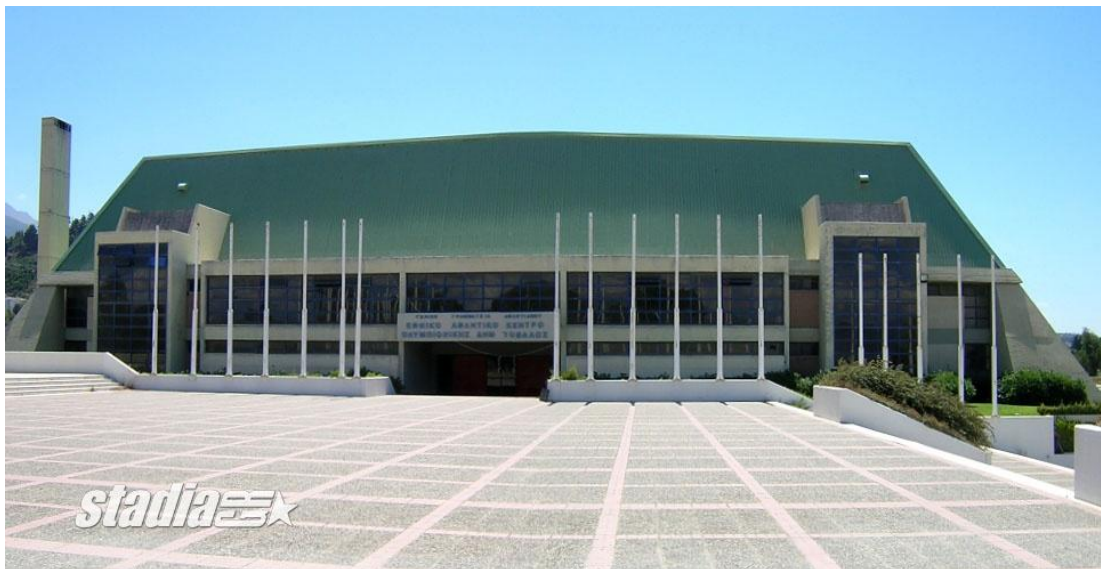
ΕΞΩΤΕΡΙΚΗ ΑΠΟΨΗ ΤΟΥ ΣΤΑΔΙΟΥ

Νοσοκομείο, Πανεπιστήμιο, τα οποία κάνουν στάση μπροστά στη θύρα 1 του αθλητικού κέντρου. Αποτελεί ιδανικό χώρο για μεγάλες αθλητικές διοργανώσεις, καθώς και για προετοιμασία ομάδων σε πολλά αθλήματα. Είναι χωρητικότητας 4.000 καθημένων θεατών, ενώ προσφέρει όλες τις ανέσεις για την άψογη διεξαγωγή αγώνων και προπονήσεων.