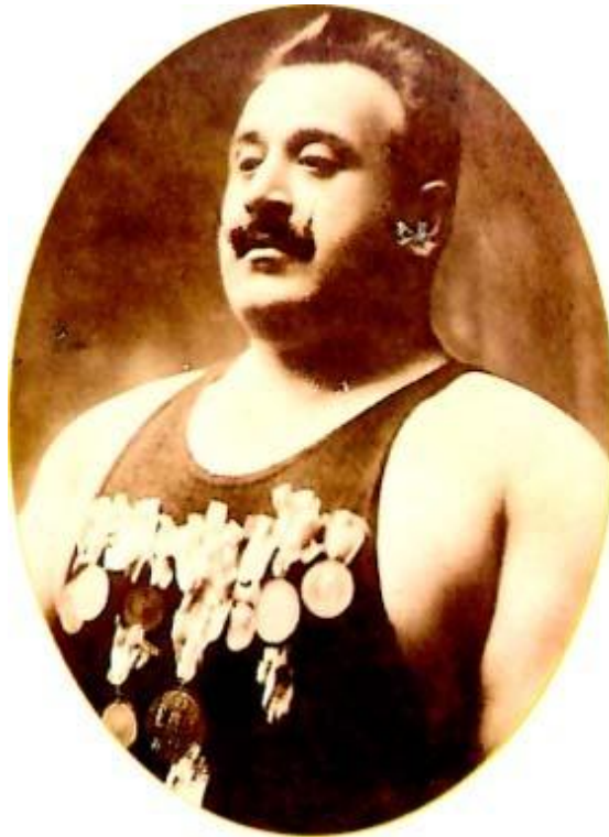
Ο Ολυμπιονίκης Δημήτριος Τόφαλος

Το αθλητικό κέντρο παραδόθηκε για χρήση την 1/11/1995, έχει κατασκευαστεί με όλες τις σύγχρονες τεχνικές προδιαγραφές, διαθέτει ιδανικούς χώρους για τη διοργάνωση ποικίλων εκδηλώσεων, καθώς και την αναγκαία υποδομή για την άρτια και επιτυχημένη διεξαγωγή αθλητικών αγώνων.