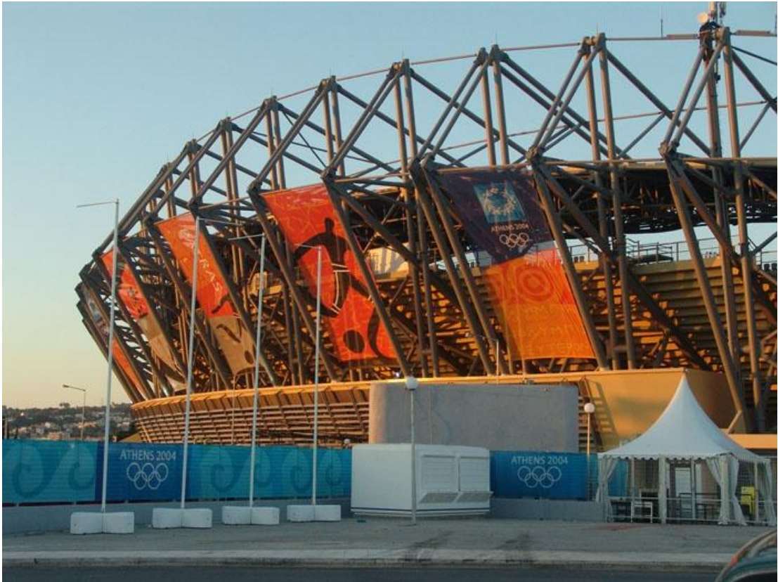
ΕΞΩΤΕΡΙΚΗ ΑΠΟΨΗ ΤΟΥ ΣΤΑΔΙΟΥ