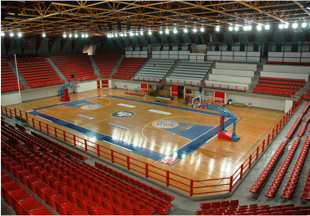
ΤΟ ΓΗΠΕΔΟ ΚΑΛΑΘΟΣΦΑΙΡΙΣΗΣ ΤΟΥ ΣΤΑΔΙΟΥ