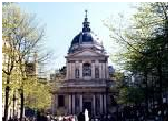
Το πανεπιστήμιο της Σορβόννης

Καλό είναι επίσης να γίνει μια επαφή με το ΔΙΚΑΤΣΑ, για να δείτε εάν τα διπλώματα του πανεπιστημίου που επιλέξατε αναγνωρίζονται στην Ελλάδα για να μη βρεθείτε προ εκπλήξεως. Μέχρι πρότινος, τα πτυχία πασίγνωστων γαλλικών ΑΕΙ (ανάμεσα στα οποία ακόμα και η... Σορβόννη!) ακόμα και κατόπιν κανονικών σπουδών εξ ολοκλήρου στη Γαλλία δεν αναγνωρίζονταν στην Ελλάδα, επειδή τα ιδρύματα αρνούσαν να ενημερώσουν το ΔΙΚΑΤΣΑ για το αν οι σπουδές έγιναν στη Γαλλία ή σε συνεργαζόμενα ελληνικά κολέγια