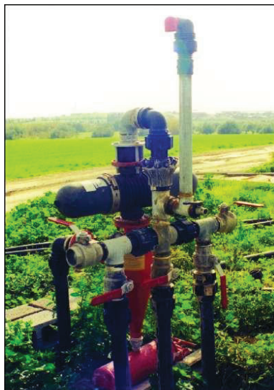
Εικόνα 3 Λιπαντήρας

λιπαντήρων, οι οποίοι λειτουργούν με την πίεση του συστήματος. Ο λιπαντήρας κλειστού τύπου, ο λιπαντήρας τύπου Βεντούρι και ο λιπαντήρας τύπου πιστονιού.