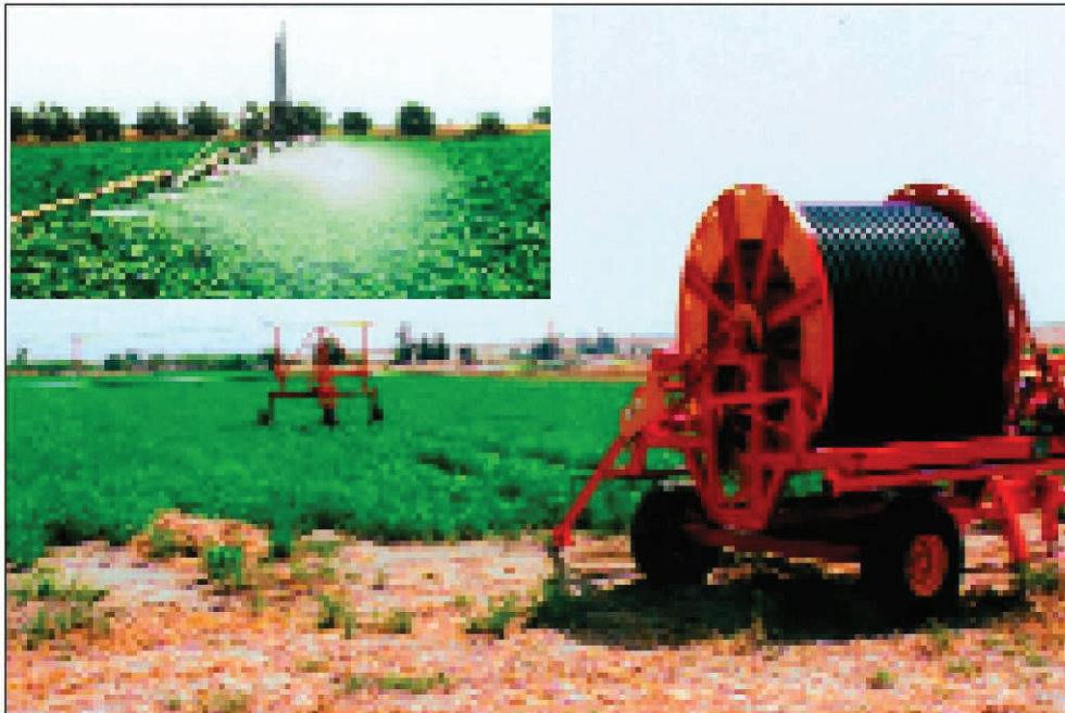
Εικόνα 5. Φορητά αυτοκινούμενα συστήματα άρδευσης

Παραλλαγή του συστήματος αποτελεί η χρήση αντένας (πολυμπέκ) μήκους 30-50 μέτρων αναρτημένη περίπου 2 μέτρα πάνω από το έδαφος. Η αρχή λειτουργίας της είναι η ίδια με πιο πάνω.