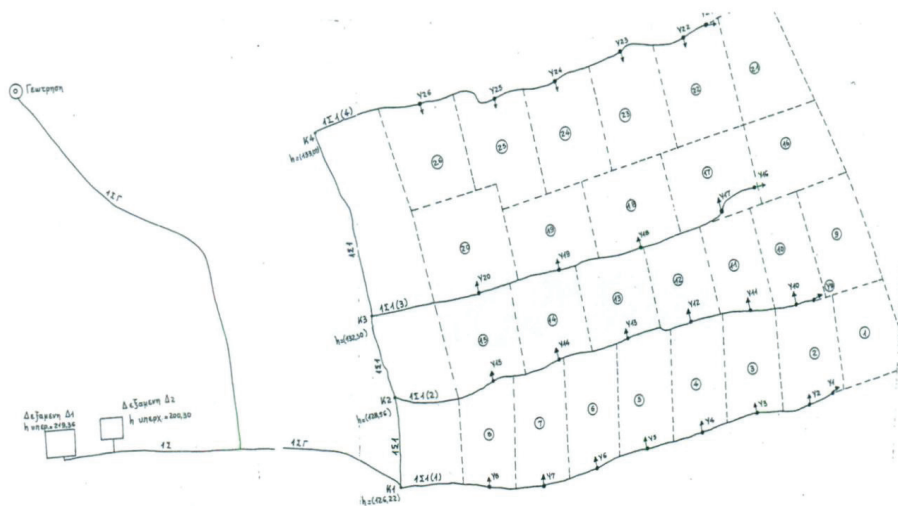
Εικόνα 7 Διάταξη σωληνώσεων από την πηγή στις δεξαμενές και τα χωράφια

Πρόκειται για λιμνοδεξαμενές κατασκευασμένες σε μικτή διατομή μέρος σε εκκαφή μέρος σε επίχωμα , πυθμένα σχήματος πενταγώνου, με πρηνή τραπεζοειδή, υπενδεδυμένες με άοπλο σκυρόδεμα.