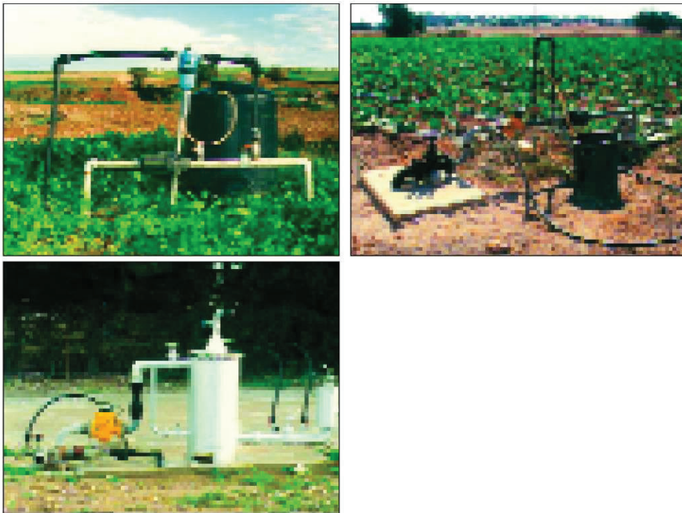
Εικόνα 2 Κεφαλές συστήματος άρδευσης

Το φίλτρο: Είναι απαραίτητο για το φιλτράρισμα του νερού άρδευσης. Τα κυριότερα είδη φίλτρων σήμερα στο εμπόριο, είναι οι αυλακωτοί δίσκοι, τα φίλτρα τατσίας, τα φίλτρα χαλικιών/άμμου και οι υδροκυκλώνες αν και οι τελευταίοι μπορούμε να πούμε ότι ανήκουν σε ξεχωριστή κατηγορία λόγω του ότι το φιλτράρισμα δεν επιτυγχάνεται με την παρέμβαση κάποιου διηθητικού μέσου αλλά γίνεται μηχανικά. Ανάλογα με την προέλευση και τα ποιοτικά χαρακτηριστικά του νερού άρδευσης, μπορούν να τοποθετηθούν περισσότερα του ενός φίλτρα ή και συνδυασμός διαφορετικών ειδών φίλτρων.