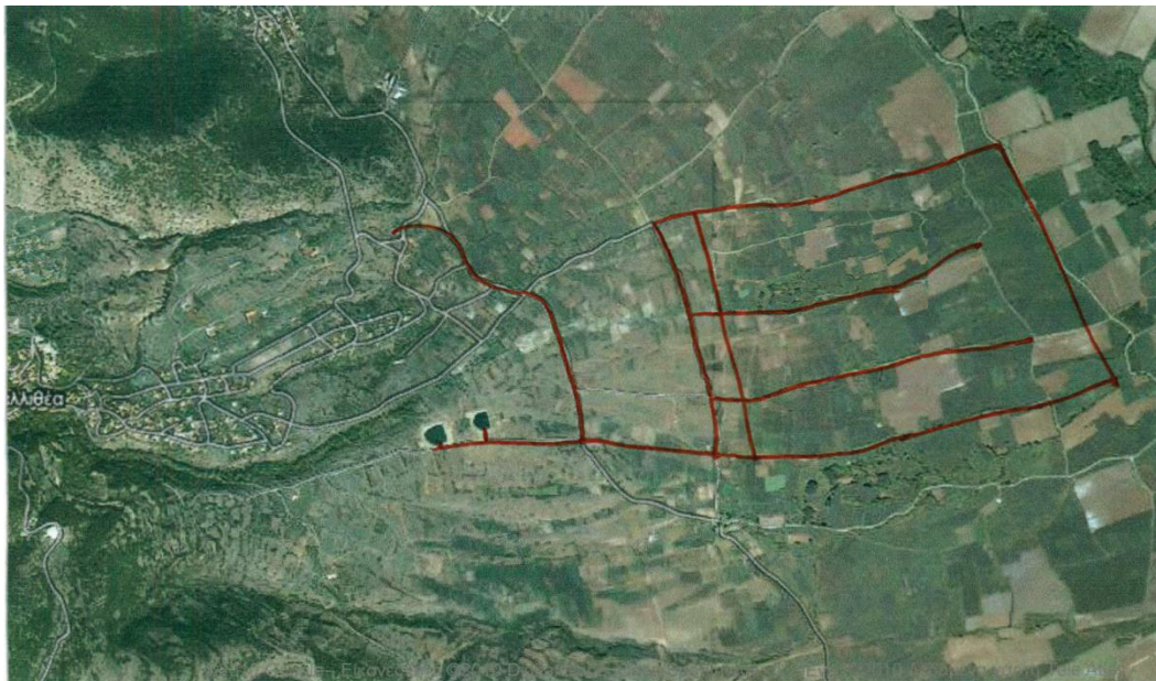
Εικόνα 6. Περιοχή αρδευτικού δικτύου

Το υφιστάμενο αρδευτικό δίκτυο υδροδοτείται από μικρό φράγμα εκτροπής, αξιοποιώντας εκφορτίσεις πηγών και από υφιστάμενη γεώτρηση. Η ποσότητα νερού που θα χρειαστεί να πάρουμε κατά την αρδευτική περίοδο για τις ανάγκες του προτεινόμενου έργου, παραμένει ίδια με την ποσότητα νερού του παλαιού δικτύου, έτσι με την παρούσα επέμβαση δεν μεταβάλετε το Υδατικό Ισοζύγιο της περιοχής, επιπρόσθετα μειώνετε με τον εκσυγχρονισμό του δικτύου τις απώλειες νερού και έτσι γίνεται καλύτερη αξιοποίηση και εξοικονόμηση του υπάρχοντος νερού.