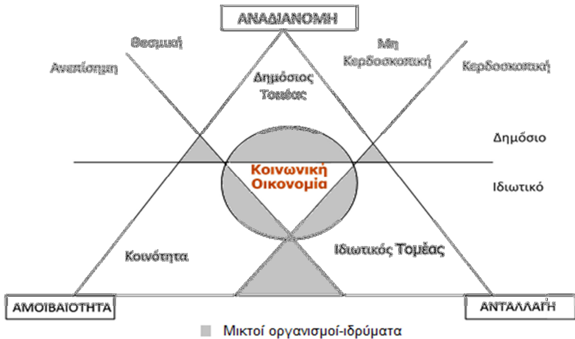
Διάγραμμα 2: Εννοιολογική Παρουσίαση της Κοινωνικής Οικονομίας

Πηγή: Pestoff (2004), επεξεργασία από Σοφία Αδάμ (2012)