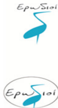
Εικόνα 4.1: Λογότυπο εθελοντικής ομάδας «Ερωδιών» Μεσολογγίου.

Η εθελοντική ομάδα «ερωδιοί» 35 , επέλεξαν αυτή την ονομασία για: την αγάπη για τη θάλασσα και τα δώρα της, την διάθεση να αιωρηθούν ελεύθερα πάνω από αυτήν και να την φανταστούν ξανά, κι αυτήν, κι όλους, και την πόλη ολάκερη.