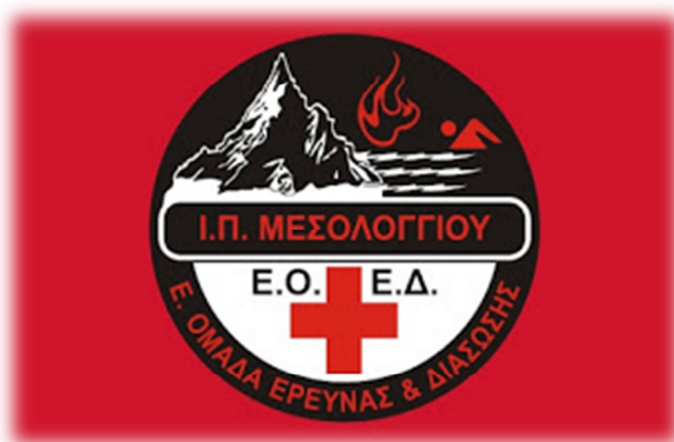
Εικόνα 4.3: Λογότυπο της εθελοντικής ομάδας Έρευνας και Διάσωσης.