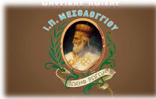
Εικόνα 4.6: Λογότυπο του Μ.Ο.Μ «Ιωσήφ Ρωγών».

Η δράση του Μ.Ο.Μ «Ιωσήφ Ρωγών» 40 δεν περιορίζεται μόνο στο πεδίο των παρελάσεων. Πολλές φορές οι εμφανίσεις τους έχουν συναυλιακό χαρακτήρα. Η πρώτη παράσταση πραγματοποιήθηκε στην εκδήλωση πολυτέκνων στις 13 Νοεμβρίου 2011, περιλάμβανε ένα μικρό πρόγραμμα μουσικών κομματιών και έγινε δεκτή από το κοινό με ένα γερό και ζεστό χειροκρότημα πράγμα που τόνωσε το ηθικό των μουσικών τους καλωσόρισε στα μουσικά δρώμενα της πόλης και τους βοήθησε να συνεχίσουν τις ενέργειες τους με μεγαλύτερη χαρά και ευχαρίστηση ξέροντας πλέον πως είχαν όχι μόνο την στήριξη των ίδιων των μουσικών και των οικογενειών τους αλλά και αξιόλογων πολιτών του Μεσολογγίου.