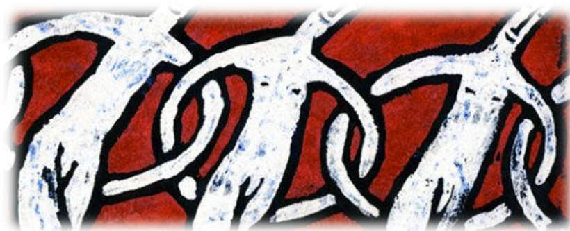
Εικόνα 4.2: Λογότυπο Ομάδας Αλληλεγγύης Μεσολογγίου.

επαναχρησιμοποίησης αγαθών δείχνοντας παράλληλα έμπρακτα, αλληλεγγύη στο συνάνθρωπό τους 36 .