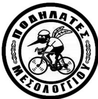
Εικόνα 4.4: Λογότυπο των ποδηλάτων της Ιεράς Πόλεως Μεσολογγίου.

Οι ποδηλάτες της Ιεράς Πόλεως Μεσολογγίου 38 είναι μια ελεύθερη και ανεξάρτητη ομάδα ποδηλάτων-ποδηλατιστών κάθε ηλικίας πέρα από πολιτικά και οικονομικά συμφέροντα, χωρίς χορηγίες που προσπαθεί να προωθήσει τη χρήση ποδήλατου. Δημιούργησαν δικτυακό χώρο ώστε όλοι οι ποδηλάτες της πόλης και όχι μόνο να επικοινωνούν μεταξύ τους, με συζητήσεις πάνω σε θέματα και προβλήματα που τους αφορούν, την διοργάνωση ποδηλατοδρομιών και δράσεων με σεβασμό στη φύση και το περιβάλλον, και την ενθάρρυνση νέων χρηστών ποδήλατου. Και όλα αυτά για μια καλύτερη ποιότητα ζωής στην