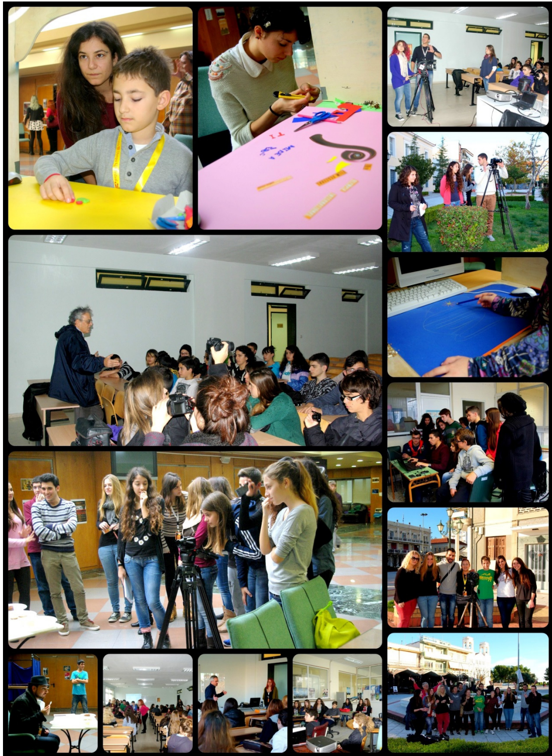
Φωτογραφίες εργαστηρίων και διαλέξεων