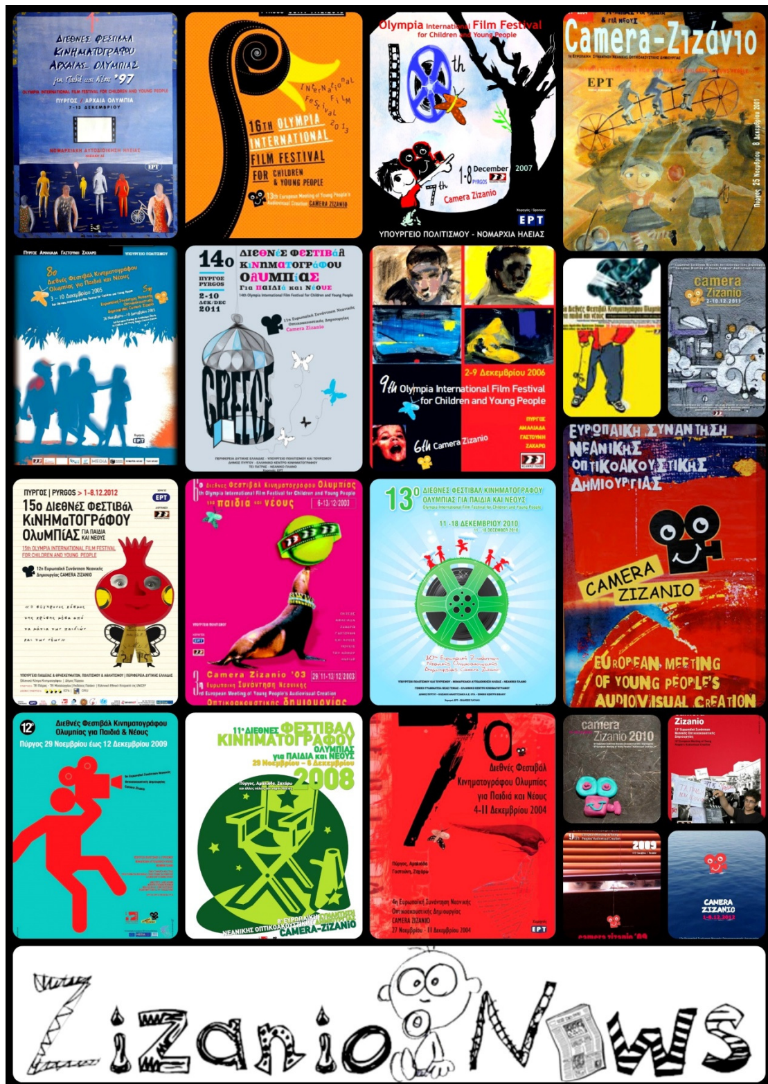
Αφίσες Φεστιβάλ Ολυμπίας και Camera Zizanio