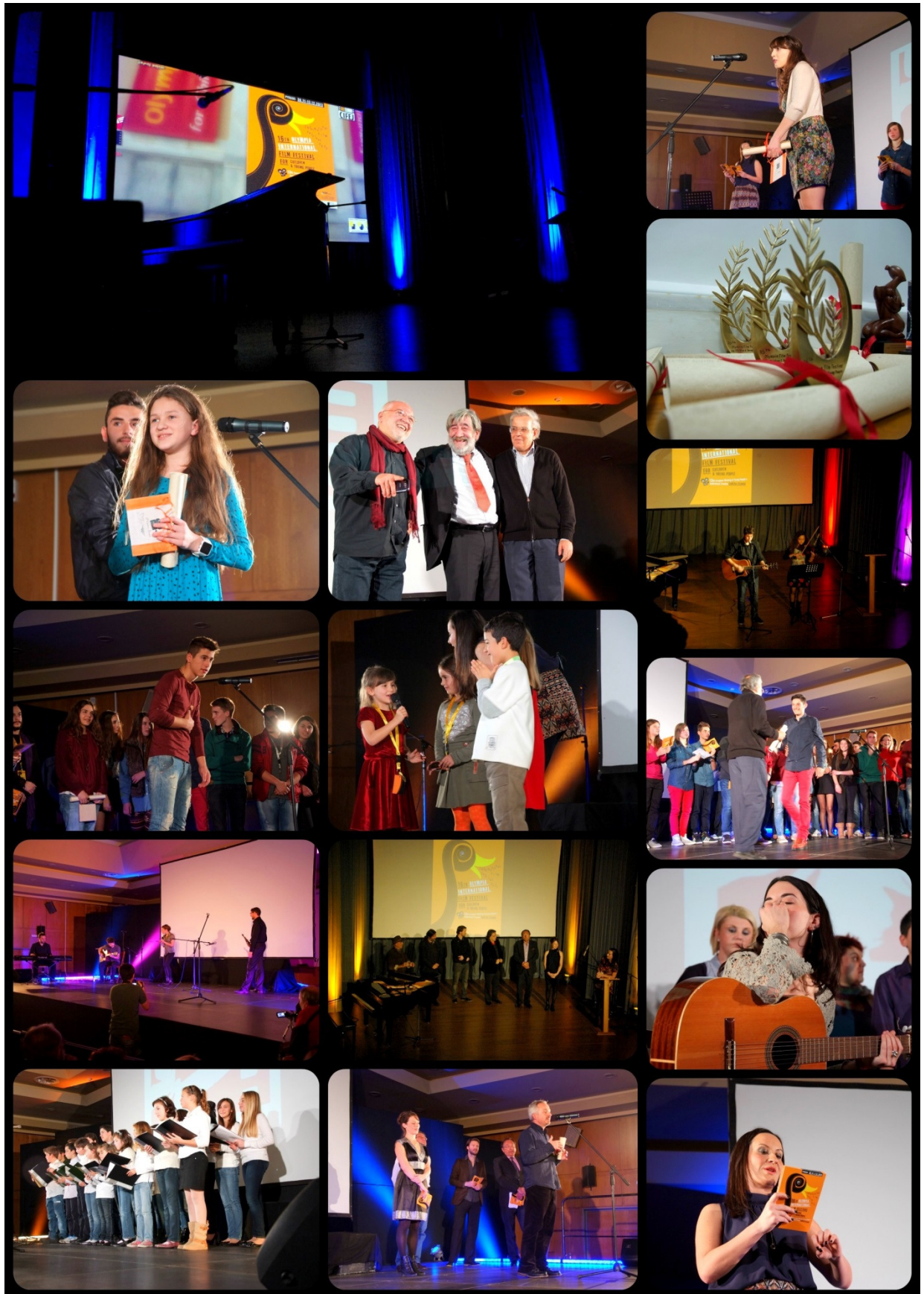
Φωτογραφίες Τελετών Έναρξης και Λήξης