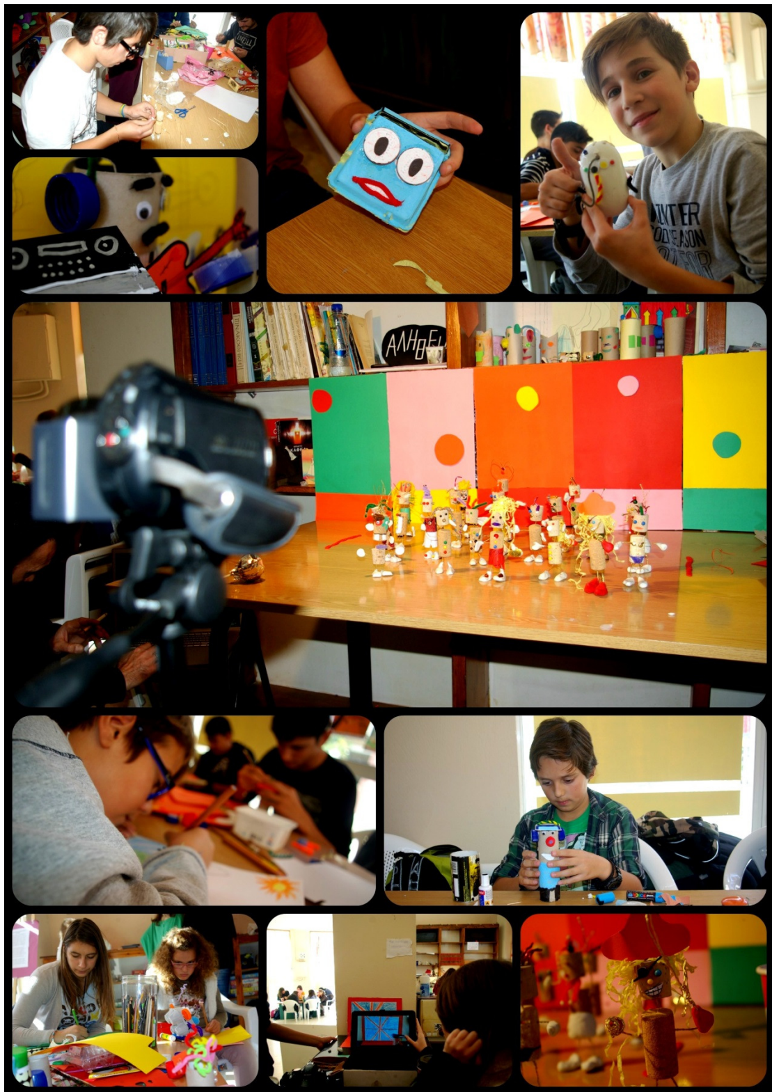
Φωτογραφίες εργαστηρίου Animation